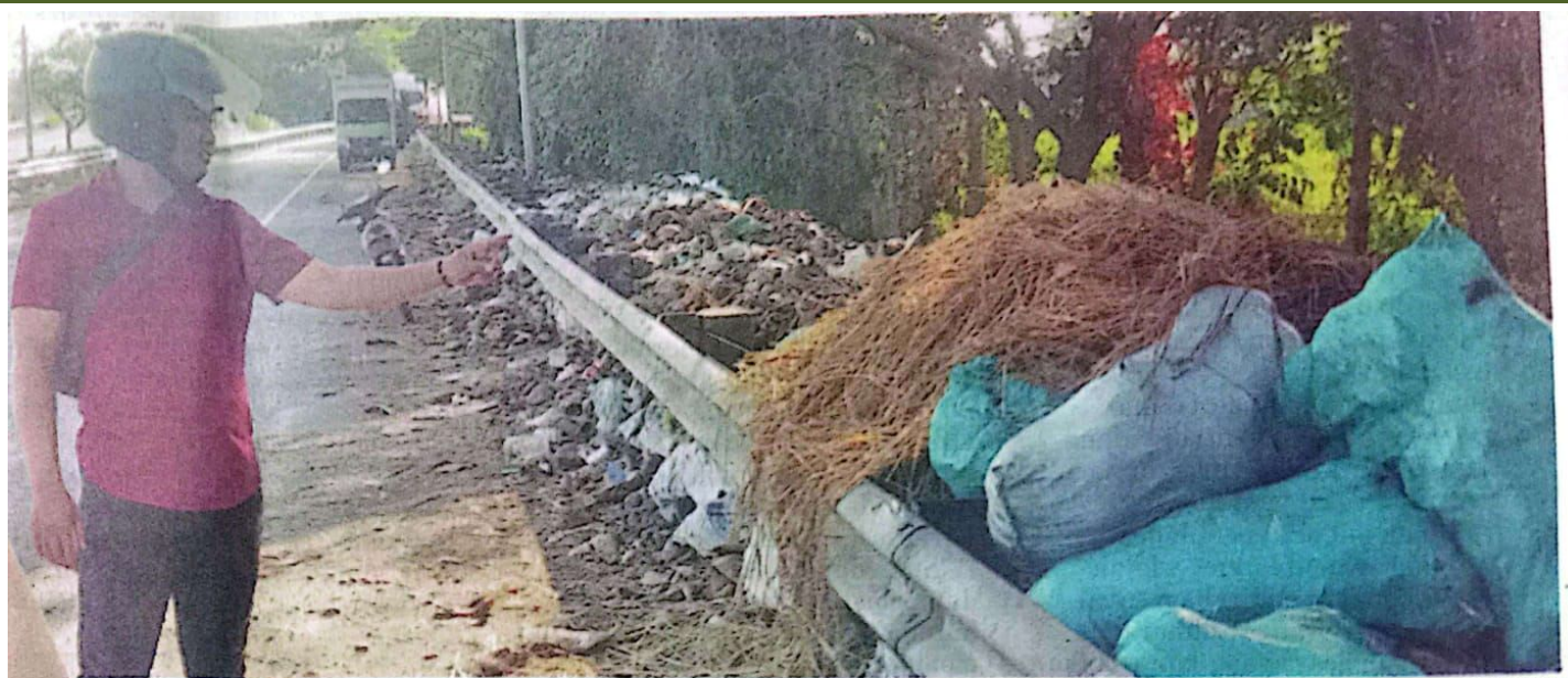
KOTOR : Salah satu warga menunjukkan adanya tumpukan sampah di pintu keluar Tol Porong.