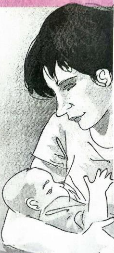
GRAFIS: BAGUS/JAWA POS