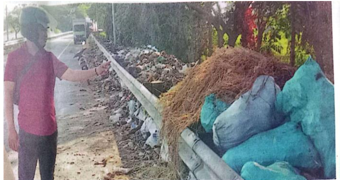
KOTOR : Salah satu warga menunjukkan adanya tumpukan sampah di pintu keluar Tol Porong.