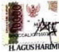
H. AGUS HARIMURTI YUDHOYONO, M.Sc., M.P.A., M.A.