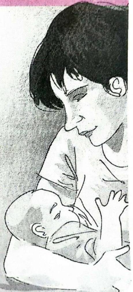
GRAFIS: BAGUS/JAWA POS