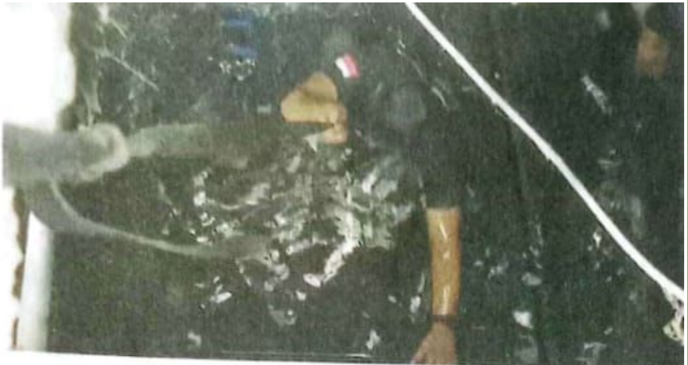
RESCUE BPBD SIDOARJO

BASAH KUYUP: Petugas rescue BPBD Sidoarjo masuk ke filter Kolam Renang Embun Jati Mas, Desa Sugihwaras, Candi, untuk mengambil ponsel seorang pelapor pada Senin (23/9) malam.