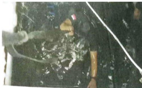
RESCUE BPBD SIDOARJO