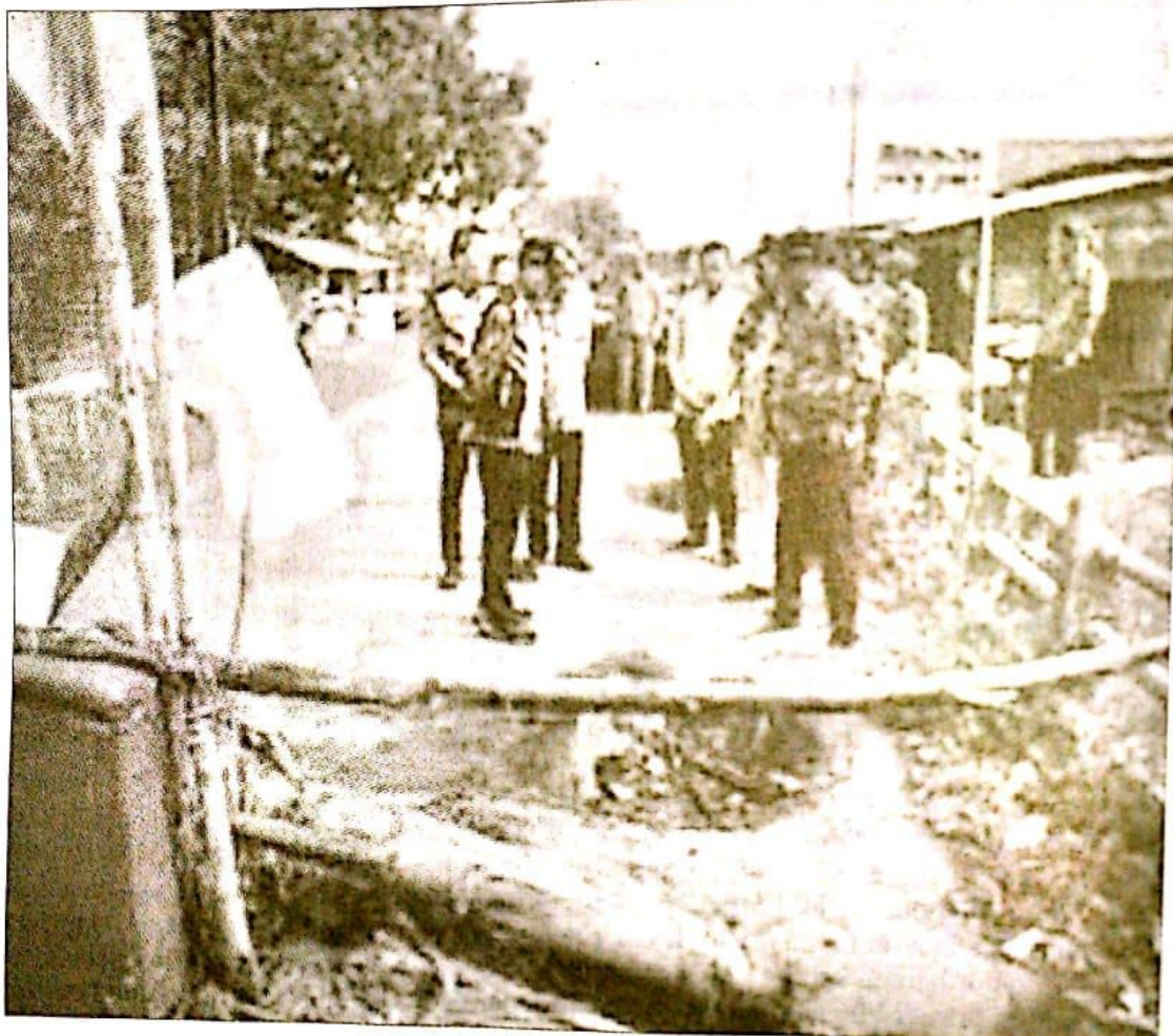
JEMBATAN RUSAK: Wakil Bupati Sidoarjo, Subandi saat meninjau jembatan rusak yang ada di Desa Prasung. BMAS1

"Dua hari ke depan jembatan ini sudah ada pelaksanaan perbaikan, minimal Minggu ini sudah ada mulai dilakukan perbaikan," ujarnya. (udi)