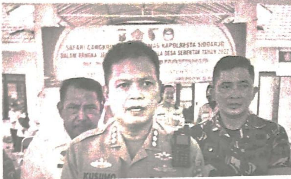
Kapolresta Sidoarjo Kombes Pol Kusumo Wahyu Bintoro.