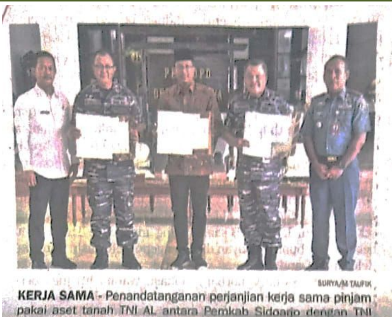
KERJA SAMA - Penandatanganan perjanjian kerja sama pinjam pakai aset tanah TNI AL antara Pemkab Sidoarjo dengan TNI AL, Rabu (23/11).