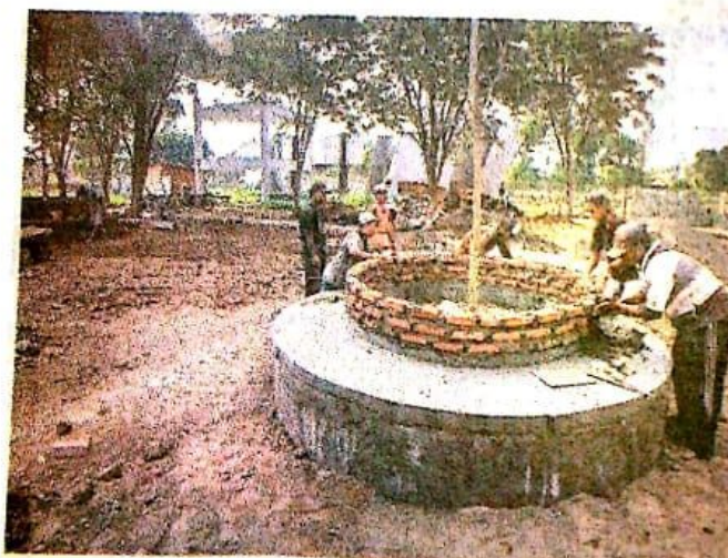
SELESAI AKHIR TAHUN: Pekerja menggarap taman Monumen Ilyushin-28 di kawasan Aloha kemarin.

"Fondasi flying fox dan miniatur kepulauan sudah, untuk fondasi patung sedang proses. Belum selesai karena butuh dibuatkan relief terkait Ir Juanda," katanya. Relief tersebut menggambarkan perjalanan hidup Ir Juanda dari kecil hingga tutup usia. (uzi/c6/any)