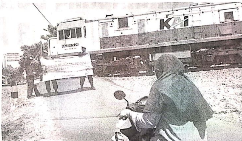
SOSIALISASI : PT KAI Daop memberikan imbauan di perlintasan sebidang tak berpalang di Sepanjang.