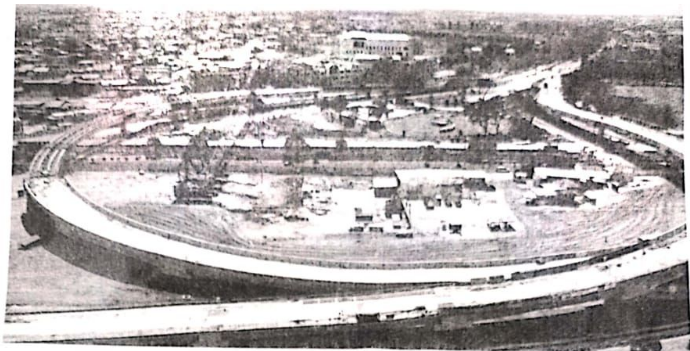
Progres pembangunan proyek flyover Aloha Rabu(6/12/23)