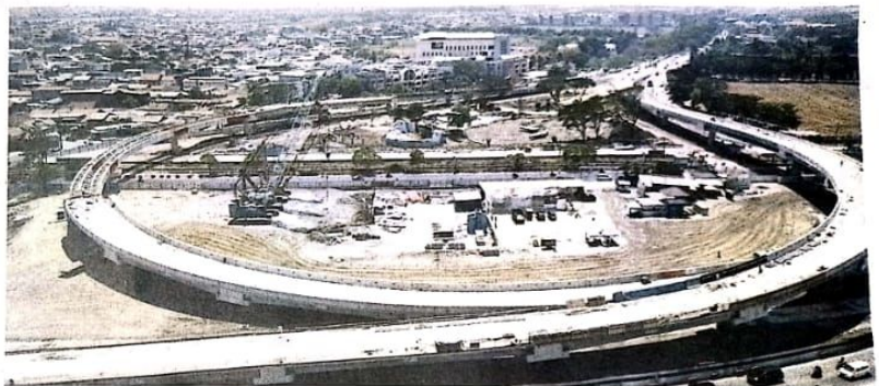
HAMPIR SELESAI - Flyover Aloha pengerjaannya hampir selesai atau sudah mencapai 91 persen. Rencananya, pertengahan Desember flyover Aloha akan dilakukan uji fungsional.

Aris menjelaskan, pengaspalan di jalur Sidoarjo-Juanda baru empat bentang dari 13 bentang yang ada. Nah, sisanya baru akan dilanjutkan setelah pengecoran sisa parapet rampung sepenuhnya.