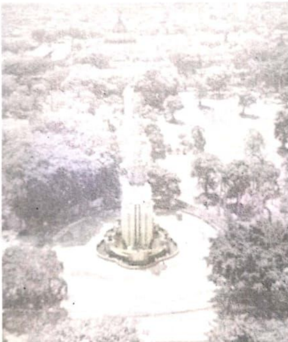
Kondisi Alun-Alun Sidoarjo yang sedang direvitalisasi.