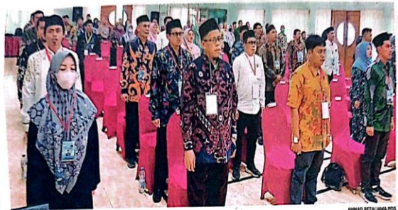
UJI KE-MAMPUAN: Peserta seleksi calon PPIH mengikuti tes tulis di Kantor Kemenag Sidoarjo kemarin (21/11). Materinya tentang pengetahuan layanan kepada calon jemaah haji.

angkutan umum strategis. "Pemecahan kemacetan adalah dengan memasifkan penggunaan kendaraan umum seperti yang dilakukan di negara-negara besar," ujarnya. (uzi/ris)