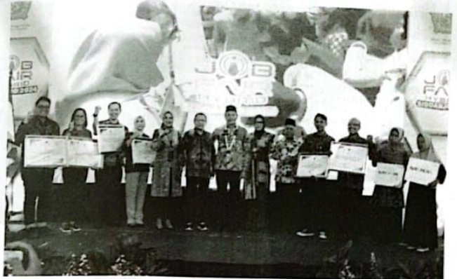
Job Fair Kabupaten Sidoarjo Selama hingga Rabu (21/8/24)

"Atas nama Pemerintah Kabupaten Sidoarjo saya memberikan apresiasi kepada 40 perusahaan yang telah berpartisipasi dalam mengikuti kegiatan bursa kerja terbuka ini saya berharap semoga kegiatan ini tidak hanya seremonial belaka tetapi benar-benar dapat membuka lapangan kerja bagi masyarakat Kabupaten Sidoarjo bagi para pencari kerja