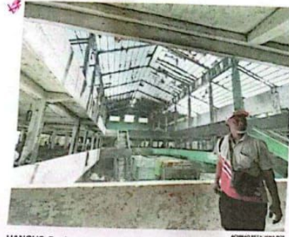
HANGUS: Bagian atas Pasar Induk Krian juga ludes setelah dilalap api.