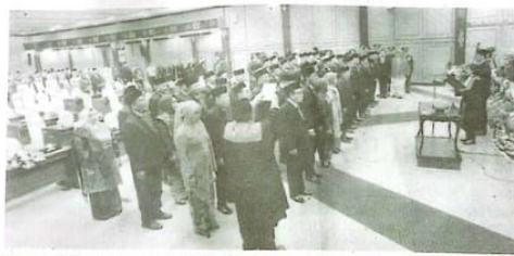
Pengambilan sumpah jabatan 50 anggota DPRD Sidoarjo masa jabatan 2024-2029, Rabu (21/8).