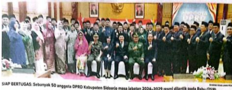
SAP BERTUGAS: Sebanyak 50 anggota DPRD Kabupaten Sidoarjo masa jabatan 2024-2029 resmi dilantik pada Rabu (21/8).