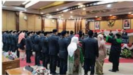
Pengambilan sumpah dan janji anggota DPRD Kabupaten Sidoarjo masa jabatan 2024-2029