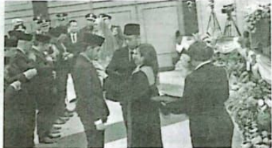
Ketua PN Sidoarjo mengambil sumpah jabatan anggota dewan periode 2024-2029.