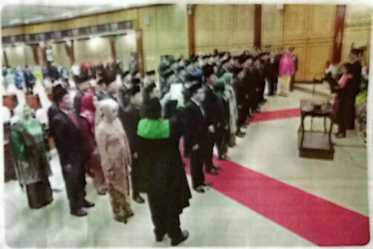
KHIDMAT Proses pengambilan sumpah jabatan anggota DPRD Sidoarjo periode 2024-2029.