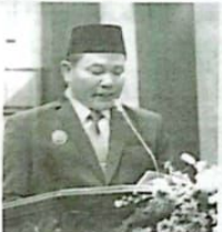
Plt Bupati Sidoarjo Subandi memberikan sambutan.