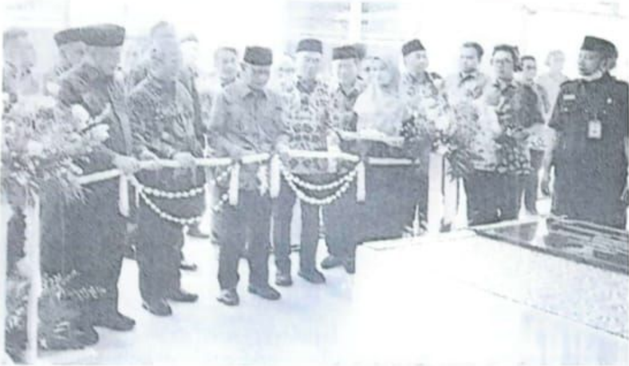
Pemotongan pita simbolis peresmian gedung medik 3 RS Siti Khodijah, Sabtu (10/8).

Menko PMK Muhadjir Effendy menyatakan, dirinya teragum-kagum dengan semangat tancap gas pembangunan Rumah Sakit di Muhammadiyah. Muhadjir juga mengajak agar secara bertahap mulai menggunakan produk asli anak bangsa, karya anak-anak Muhammadiyah, yakni infus Surya Pena. (sta/rus)