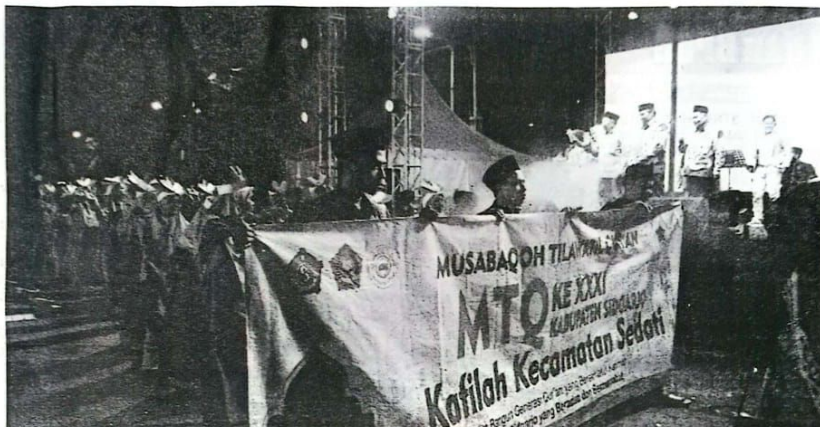
MTQ Kabupaten Sidoarjo ke XXXI tahun 2024 dibuka

bagai juara, yang tidak kalah pentingnya tujuan ikut MTQ Kabupaten Sidoarjo kali ini adalah bagaimana menggerakkan gairah umat islam untuk lebih giat lagi dalam pembangunan yang didasari dengan nilai-nilai luhur yang bersumber dari Al-Quran," pesannya.