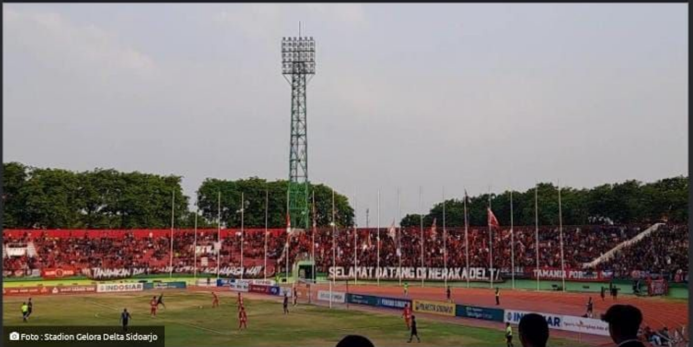
Foto : Stadion Gelora Delta Sidoarjo

Deltras FC saat berlaga di Stadion Gelora Delta Sidoarjo, musim 2023-2024.