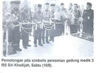
Pemotongan pita simbolis peresmian gedung medik 3 RS Siti Khodijah, Sabtu (10/8).