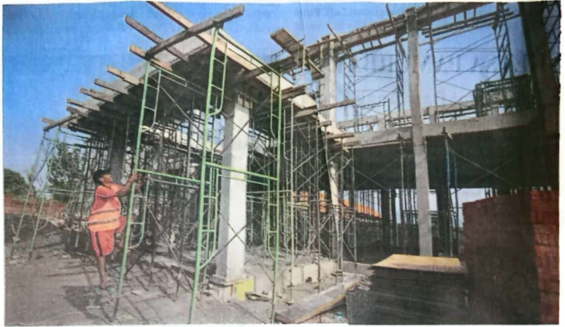
LANJUTAN: Kondisi proyek pembangunan SMPN 2 Tulangan, Sidoarjo, kemarin (11/8)

Untuk SMPN 2 Tulangan, di lantai 1 dibangun ruang inklusi, ruang UKS dan BK, ruang