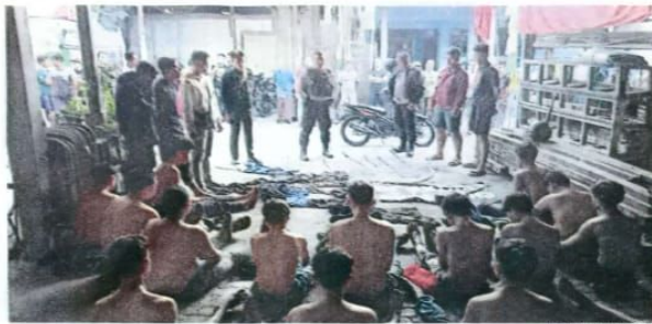
BERANDALAN: Tujuh bilah sajam jenis celurit diamankan Tim Raimas Satsamapta Polresta Sidoarjo di Desa Becirongeng, Wonoayu.