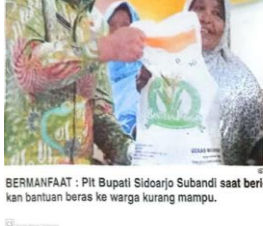
BERMANFAAT - Pjt Bupati Sidoarjo Subandi saat berikan bantuan beras ke warga kurang mampu.

KOTA-Berdasarkan data yang dirilis Badan Pusat Statistik (BPS) Sidoarjo, persentase penduduk miskin di Kota Delta pada Maret 2024 sebesar 4,53 persen. Atau menurun 0,47 poin dibanding Maret 2023 yang sebesar 5,00 persen. Artinya jumlah penduduk miskin di Sidoarjo mencapai 109,39 ribu jiwa. Berkurang sebesar 9,76 ribu jiwa, dibandingkan kondisi Maret 2023 yang mana penduduk miskin mencapai 119,15 ribu jiwa. Garis Kemiskinan Sidoarjo pada Maret 2024 sebesar Rp 597.284 per kapita dalam satu bulan. Bertambah sebesar Rp 25.588 atau meningkat sebesar 4,48 persen, dibandingkan kondisi Maret 2023 yang sebesar Rp 571.696. Kepala Badan Perencanaan Pembangunan Daerah Ke Halaman 10