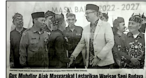
Mayor dan Wakil Mayor Kabupaten Sidoarjo bersama jajaran DPRD dan Kepala Dinas terkait menghadiri acara pelantikan pengurus Dewan Perwakilan Rakyat Daerah Kabupaten Sidoarjo.

Gus Muhdlor Ajak Masyarakat Lestarikan Warisan Seni Budaya Bupati Sidoarjo, Gus Muhdlor mengajak masyarakat Kabupaten Sidoarjo untuk melestarikan warisan seni budaya yang ada di Kabupaten Sidoarjo. Beliau mengatakan, warisan seni budaya adalah aset yang sangat berharga dan perlu dilestarikan agar tidak punah. Beliau mengajak masyarakat untuk bersama-sama menjaga dan merawat warisan seni budaya yang ada di Kabupaten Sidoarjo.