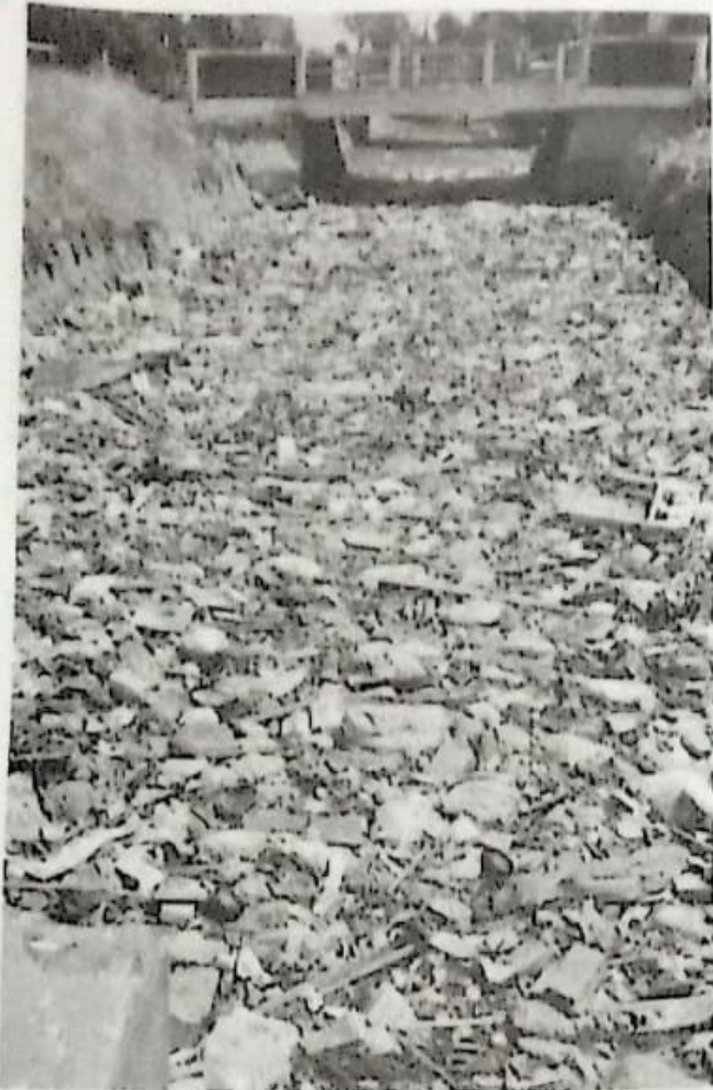
Volume sampah yang mencapai ratusan kubik di Sungai Mangatan Kanal di Desa Gedangan Kecamatan Gedangan Sidoarjo.

DEWAN PERWAKILAN RAKYAT DAERAH KABUPATEN SIDOARJO