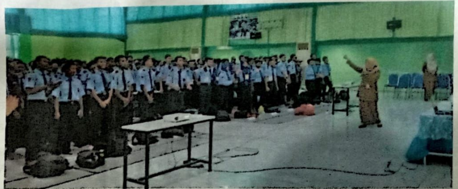
PENCEGAHAN: Sosialisasi terkait bahaya tindak perundungan di SMK Negeri 3 Buduran.

Menurutnya, sosialisasi seperti itu harus terus dilakukan. Sebab, Sidoarjo menjadi kabupaten dengan ting-