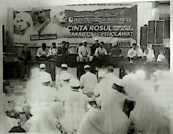
Ribuan siswa SMK Antartika 2 Buduran dzikir dan bersholawat serta doa bersama guru dan karyawan, Senin (30/10/23)

"Kami berharap para siswa yang mengikuti majlis dzikir ini sukses dalam hal lmtaq dan lpteknya. Doa dan pengharapan, semoga kegiatan yang diikuti siswa-siswi sekolah ini bisa lancar, mudah dan sukses kedepannya," doanya. ●Loe