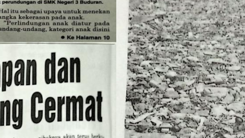
Pekerjaan pembenahan dan perbaikan jalan di Frontage Road dekat Perempatan Gedangan telah selesai.

Dn Frontage Road Dekat Perempatan Gedangan Pekerjaan pembenahan dan perbaikan jalan di Frontage Road dekat Perempatan Gedangan telah selesai. Pekerjaan ini meliputi pembenahan badan jalan, perbaikan saluran air, dan pemasangan trotoar. Pekerjaan ini telah selesai dan jalan tersebut sudah dapat dilewati dengan nyaman.