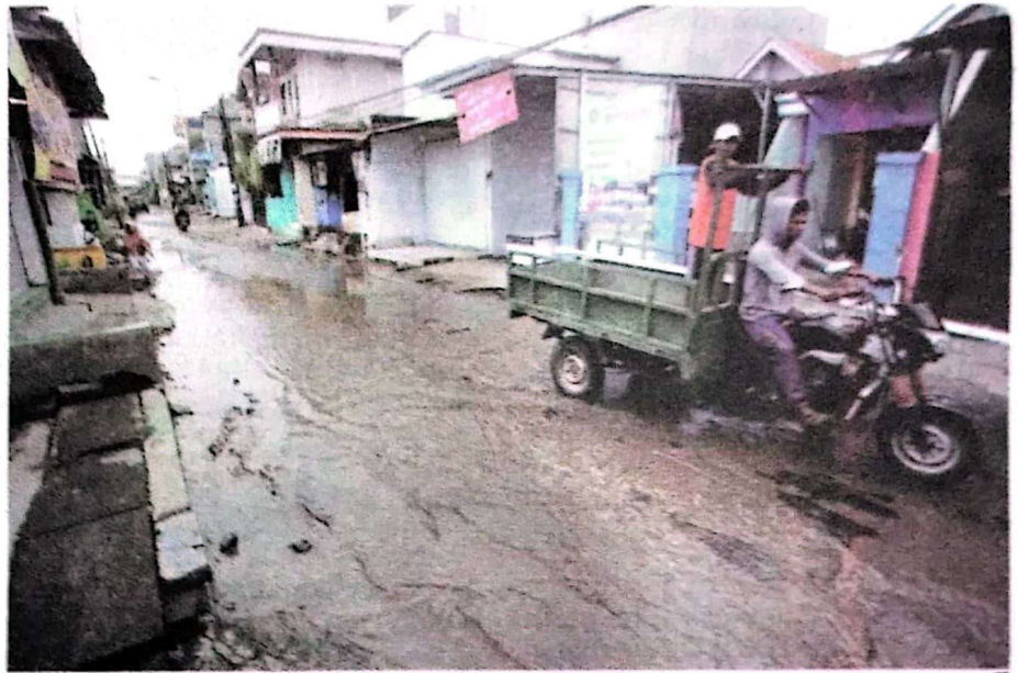
TERGENANG: Ruas Jalan Tropodo 1 yang rusak akan segera dibeton.

Menurutnya, bulan depan ditargetkan sudah dalam tahap pengerjaan. Ruas jalan yang akan dibeton tersebut panjangnya mencapai panjang 930 meter. Sementara lebarnya sekitar empat meter. "Kalau lelang tuntas, bisa segera