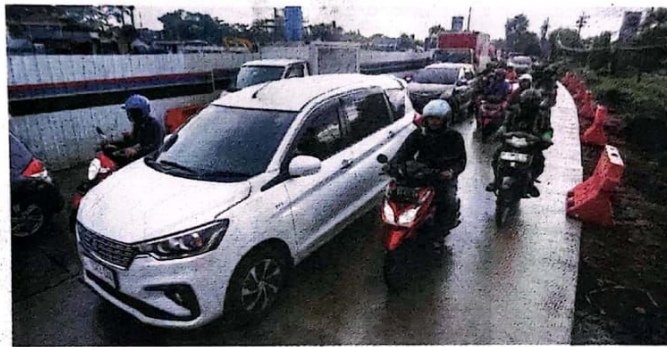
UJIAN KESABARAN: Kendaraan melintas di sekitar proyek pembangunan flyover Aloha, Sidoarjo, kemarin. Penyempitan jalan akibat pembangunan flyover Aloha berimbas pada kemacetan di kawasan tersebut.