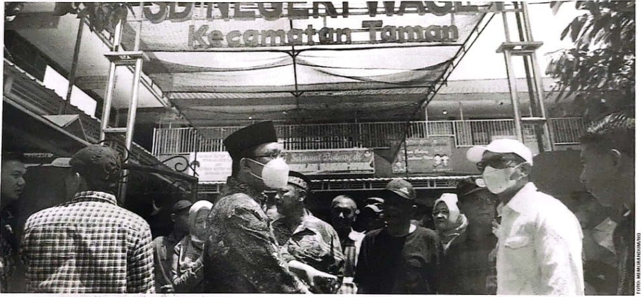
Bupati Sidoarjo Ahmad Muhdlor bersama korban bencana di Wage, Taman.

"Saya tadi juga meminta dinas terkait untuk memberikan atensi lebih terhadap kondisi sekolah SDN 1 Wage," ujarnya. (no/kri/jok)