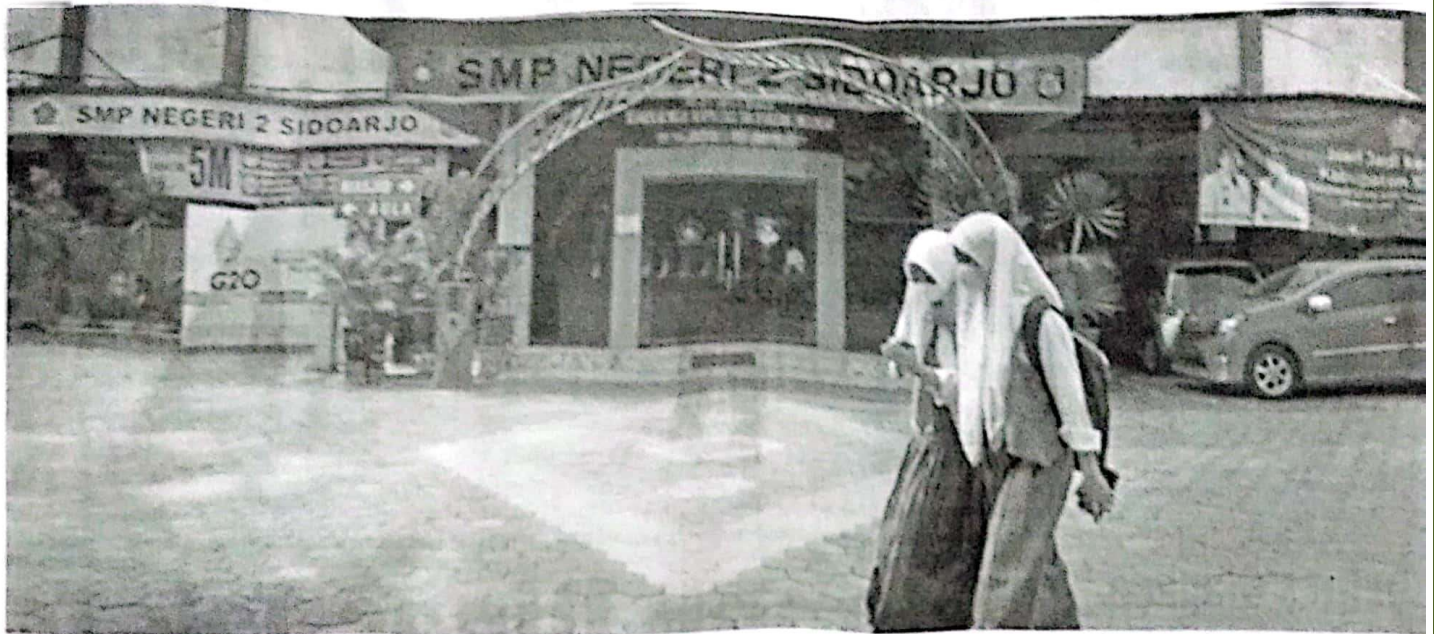
FASILITAS LENGKAP: SMPN 2 Sidoarjo menjadi satu-satunya sekolah penerima KKO.