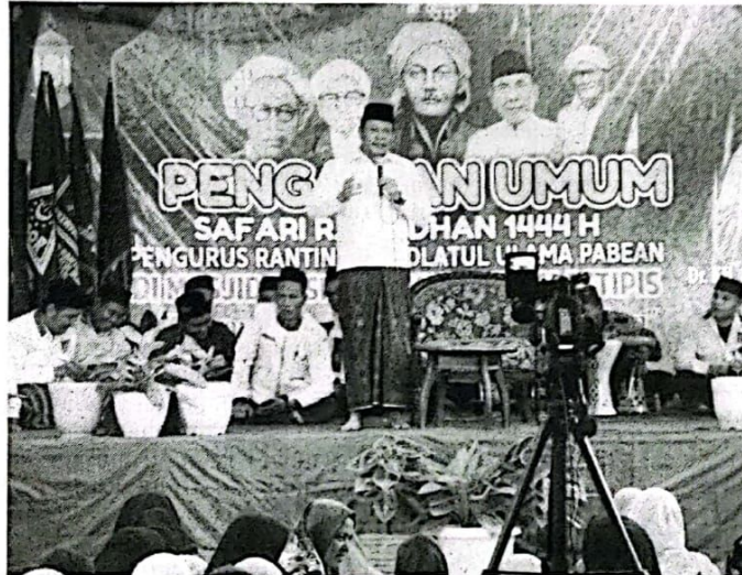
SAMBUTAN - Wabup Sidoarjo Subandi menyampaikan sambutan saat acara Peringatan malam Nuzulul Qur'an sekaligus Safari Ramadhan GP Ansor dan Fatayat NU digelar di Desa Pabean, Kecamatan Sedati, Sidoarjo, Minggu (09/04/2023) petang.

Wakil Bupati (Wabup) Sidoarjo, Subandi mengatakan kegiatan ini sebagai upaya Pemkab Sidoarjo mendekati diri dan mengunjungi langsung masyarakat. Menurutnya, kegiatan ini sebagai penguat dan pengikat tali silaturahmi dengan masyarakat Desa Pabean serta semakin mempererat hubungan harmonis antara pemerintah dan masyarakat.