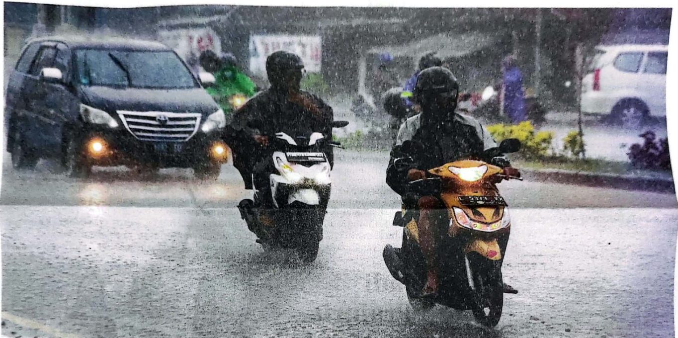
HATI-HATI DI JALAN: Hujan deras melanda Gedangan kemarin (10/4). BMKG Juanda mengeluarkan peringatan cuaca ekstrem untuk beberapa wilayah di Jawa Timur. Salah satunya, Sidoarjo.

DEWAN PERWAKILAN RAKYAT DAERAH KABUPATEN SIDOARJO