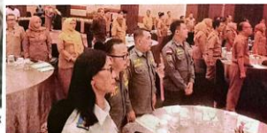
PREVENTIF: Sosialisasi tentang netralitas ASN yang diorganisasikan Bawaslu kemarin (7/10) diikuti para pimpinan OPD pembah hingga perwakilan TNI dan Polri.

"Dalam waktu dekat, kami menggelar rapat pleno," ujarnya. Agung mengatakan, jika nanti terbukti ada pelanggaran, mekanisme pemberian sanksi bakal diserahkan ke instansi tempat mereka bekerja. Seperti di Seledati, kasus itu bakal diserahkan ke Badan Kepegawaian Daerah (BKD). "Untuk yang di Balongbendo akan kami serahkan ke Kemendagri, Sarikstya, dan Kemendagri," katanya. Namun, Agung memastikan tidak berujung ke sumpah pidana. (uzi/ris)