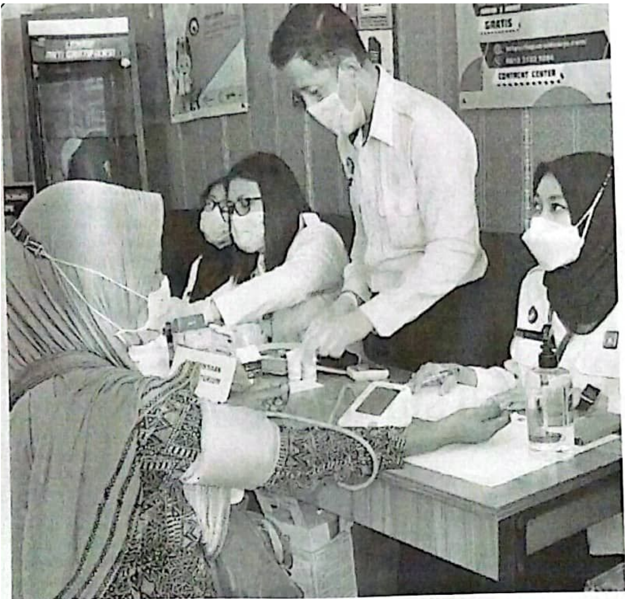
Pelayanan kesehatan di Lapas Sidoarjo.