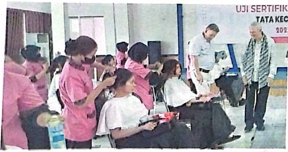
LIHAT LANGSUNG: Wali Kota Cockburn, Australia, Logan Howlett (kanan) bersama rombongan saat meminjau uji tata rias di SMKN 1 Buduran kemarin.

SIDOARJO - SMKN 1 Buduran dikunjungi rombongan dari Australia kemarin. Di antaranya, Wali Kota Cockburn, Australia, Logan Howlett dan sejumlah perwakilan kampus di Australia Barat. Hasilnya, mereka merancang kerja sama antara Cockburn dan SMKN 1 Buduran.