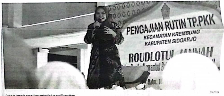
Ratusan jamaah pengajian sambut bulan suci Ramadhan.

Dalam acara yang dihadiri oleh Forkopimka Kecamatan Krembung, Ketua Tim Penggerak PKK se-Kecamatan Krembung, Muslimat NU, Fatayat NU tersebut juga juga berlangsung pasar murah dengan disediakan sebanyak 5,5 kwintal beras dengan harga murah untuk masyarakat Kecamatan Krembung. ● Ioe