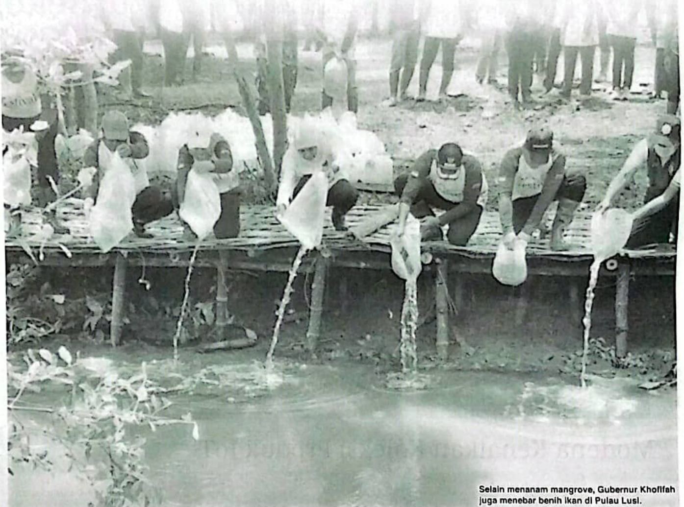
Selain menanam mangrove, Gubernur Khofifah juga menebar benih ikan di Pulau Lusi.