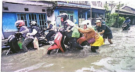
LANGGANAN TIAP TAHUN: Pengendara menerjang genangan air di Desa Kureksari, Waru, Sidoarjo, kemarin (29/1).

Perempuan 45 tahun itu menyebut daerahnya memang langganan banjir. Karena problem utamanya tak kunjung diselesaikan pemkab, warga akhirnya mencari solusi sendiri. "Dinaikkan rumahnya biar air nggak masuk