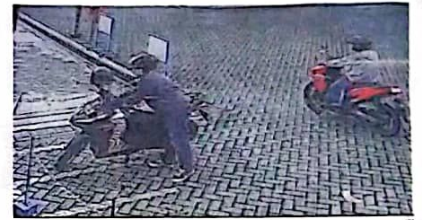
NEKAT: Aksi pencurian saat terekam CCTV.

"Ya dari CCTV kelihatan kalau ada dua pria yang berboncengan motor war-