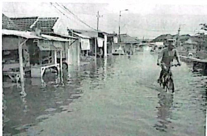
Banjir yang melanda salah satu desa di Sidoarjo.