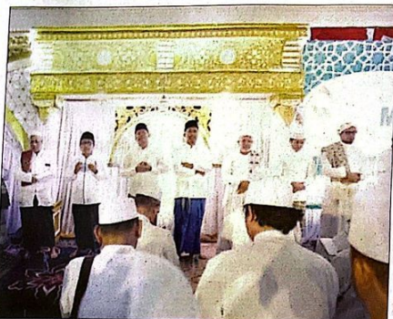
Ribuan jama'ah Al-Khidmah dari berbagai daerah mengikuti doa Bersama dan majelis dzikir Maulidurrasul Muhammad SAW dalam rangka memperingati Hari Jadi Kabupaten Sidoarjo ke-164 tahun 2023.

doa untuk bangsa dan negara, semoga doa dan dzikir kita diterima dan dikabulkan oleh Allah SWT serta menjadikan kabupaten yang toyyibun," ujarnya.