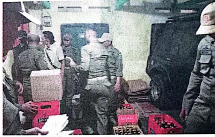
FIRMA ZUHDI/JAWA POS

Pada razia kali ini, salah satu lokasi yang disisir petugas gabungan adalah rusunawa Wonocolo. Para penghuni di dua gedung diperiksa semuanya, terutama kelengkapan identitasnya. "Hasilnya, semua penghuni membawa identitas," kata