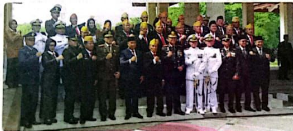
APRESIASI: Foto bersama dengan para veteran usai upacara di Alun-alun.

"Saya berharap penghargaan ini dapat memberikan motivasi bagi ASN lainnya untuk terus mengabdikan diri bagi kemajuan daerah dan bangsa," pungkasnya. (sai/vga)