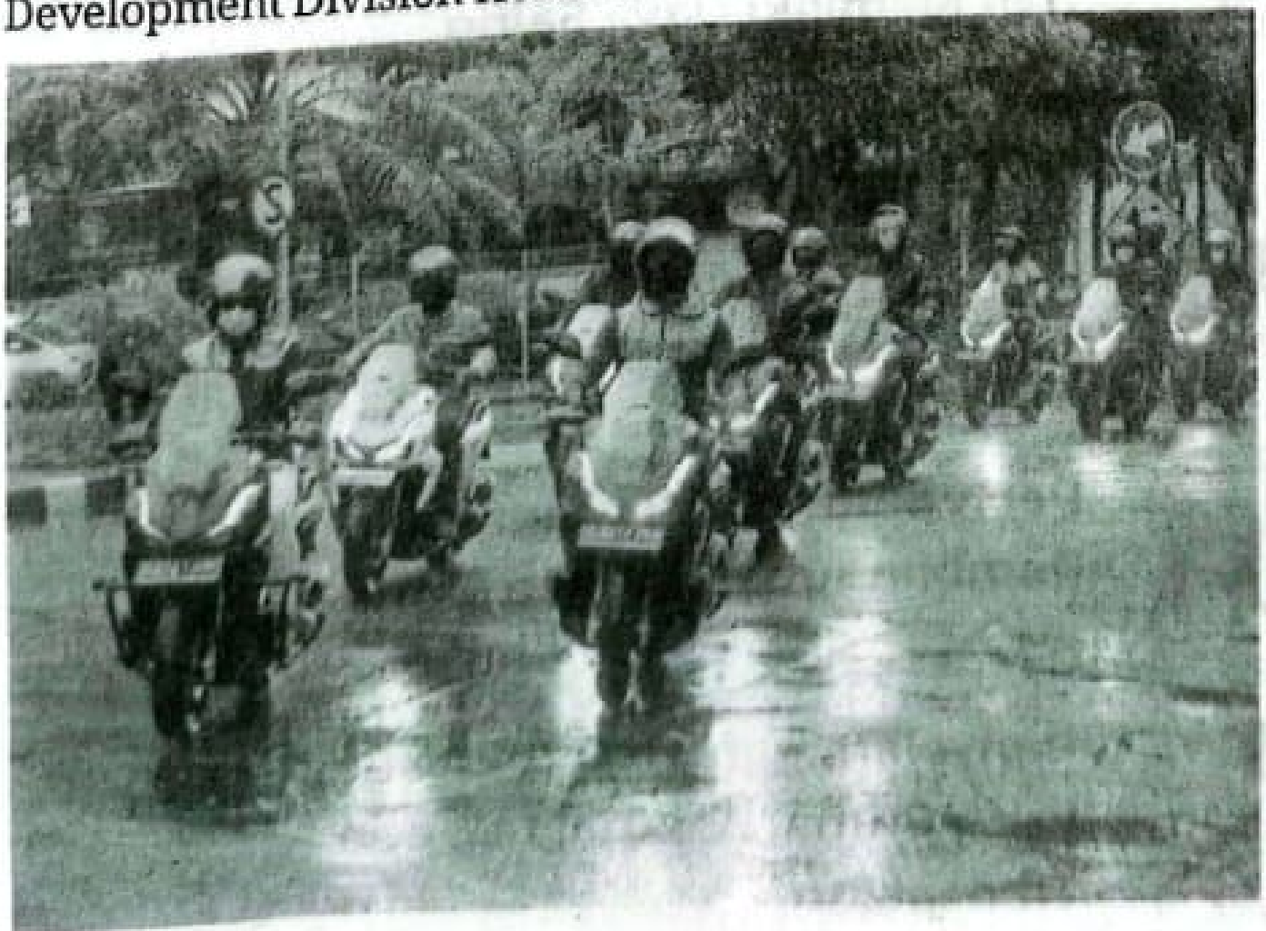
Para pengendara Honda saat berkendara di musim hujan.