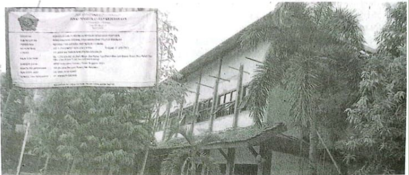
Proyek Rehab Berat SMPN 1Taman terlihat pilar hanya distek.