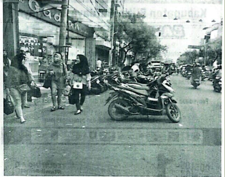
Titik parkir yang pembayarannya dipermudah dengan kartu e-voucher untuk retribusi parkir sistem digital. (kri/jok)

PT Indonesia Sarana Servis (ISS), rekanan Pemkab Sidoarjo dalam mengelola parkir, me-launching e-voucher di areal parkir di Pasar Larangan. Acara itu dihadiri Kepala Dinas Perhubungan Sidoarjo Benny Airlangga dan Ketua Komisi B Bambang Pujiyanto, serta perwakilan dari Dinas Pasar dan Polresta Sidoarjo. "Sementara kami menyiapkan 20 ribu kartu e-voucher sebagai alat baru pembayaran parkir di Sidoarjo secara digital. Saat ini kami baru melayani