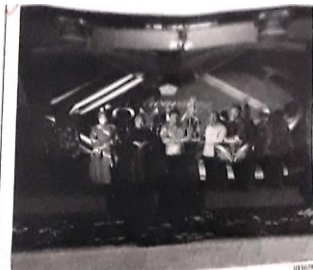
Pengawasan (awand) lomba RT se Kabupaten Sidoarjo di Perhico Delta Wibawa