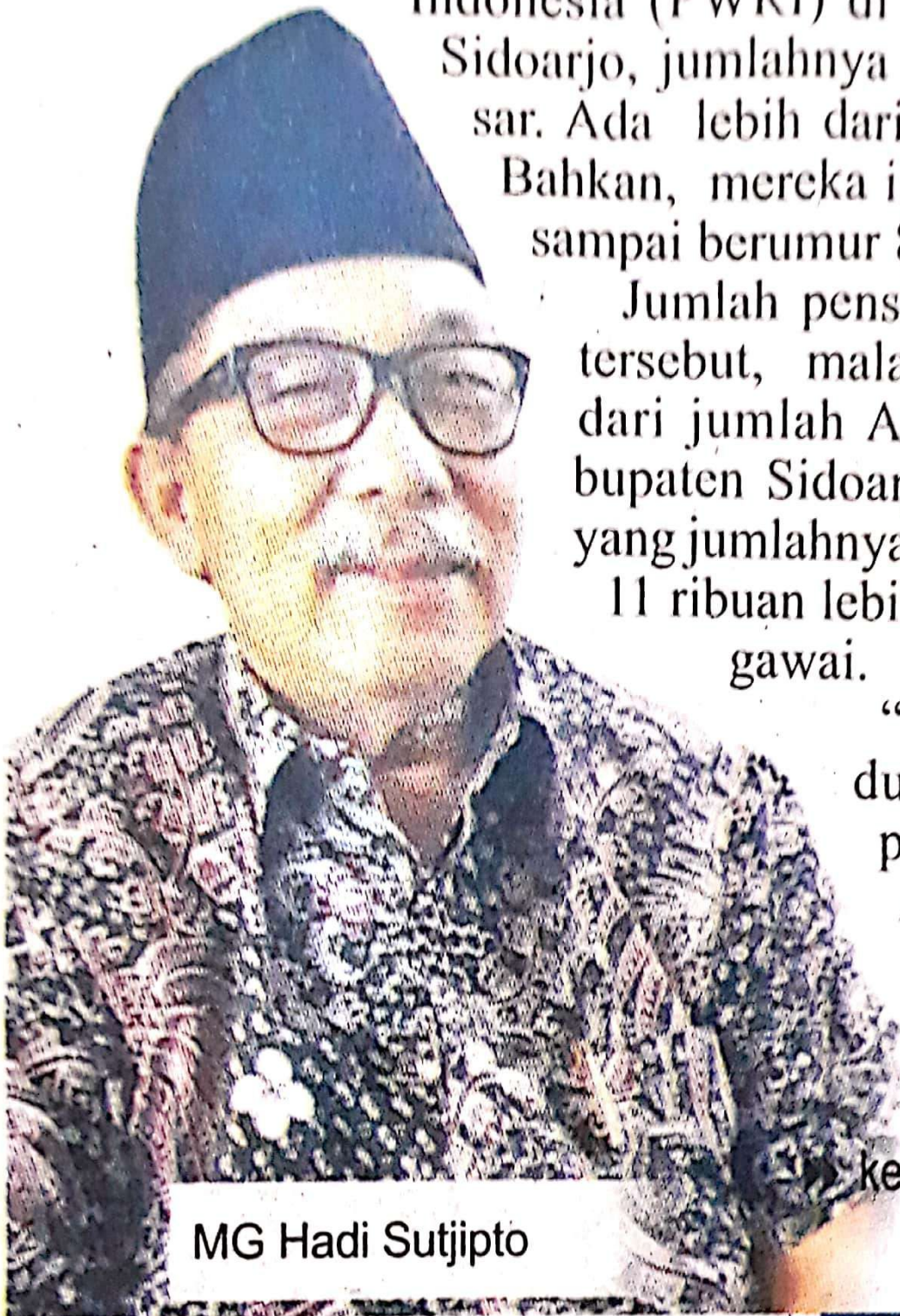
MG Hadi Sutjipto