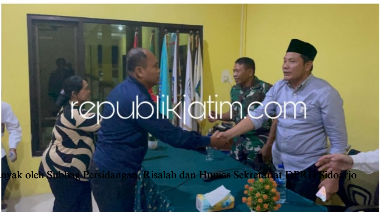
Diperbanyak oleh Subbag Persidangan, Risalah dan Humas Sekretariat DPRD Sidoarjo