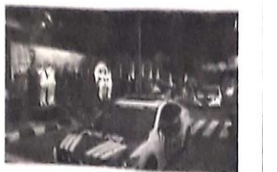
Upacara perayaan Hari Bhayangkara ke-78 di Alun-alun Sidoarjo