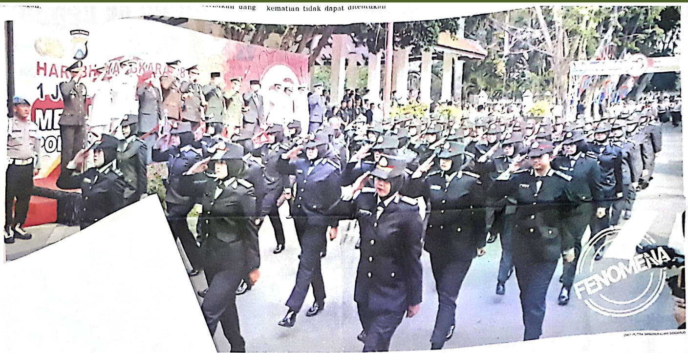
...melihat defile perayaan Hari Bhayangkara ke-78.

DEWAN PERWAKILAN RAKYAT DAERAH KABUPATEN SIDOARJO