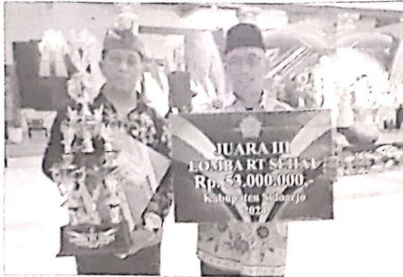
LOMBA RT - Pemerintah Kabupaten (Pemkab) Sidoarjo mengumumkan pemenang Lomba Rukun Tetangga (RT) se-Kabupaten Sidoarjo. Sejak diluncurkan (kick-off) Januari 2024, lomba ini berhasil melahirkan RT-RT hebat.

Sebab, RT-RT adalah garda terdepan dalam pembangunan suatu wilayah. Partisipasi aktif mereka