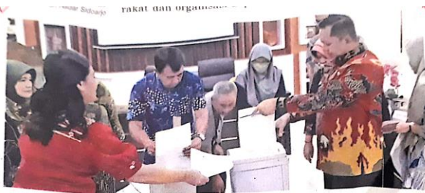
DIKURANGI: Pemusnahan arsip sebagai langkah mengurangi arsip di Dinas Perpustakaan dan Arsip Sidoarjo.