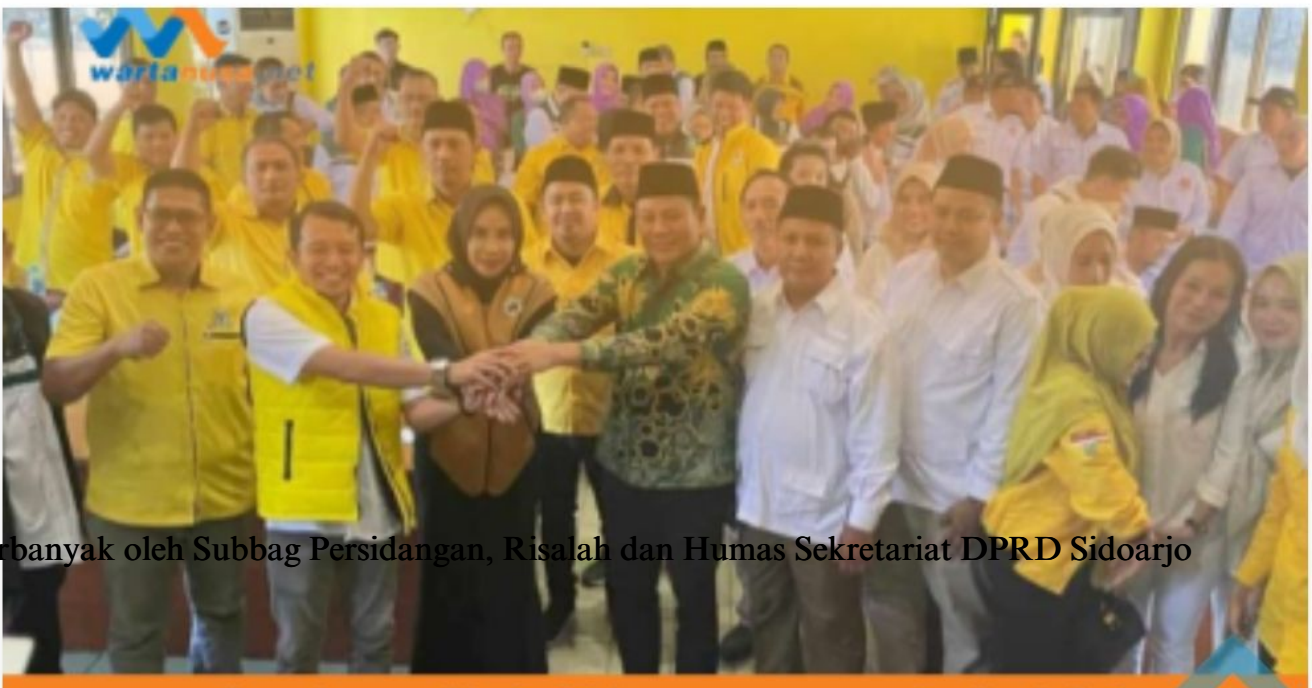
Diperbanyak oleh Subbag Persidangan, Risalah dan Humas Sekretariat DPRD Sidoarjo