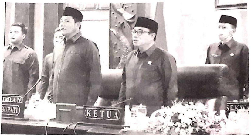
BERIRINGAN: Suasana rapat paripurna membahas raperda RPJPD 2025-2045 di gedung DPRD Sidoarjo.