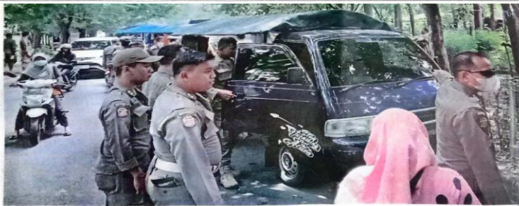
SAKUS TERBIT: Petugas Satpol PP menertibkan pedagang yang berjualan di bahu jalan.

Pelwira polisi berpangkat meletau satu itu mengatakan, pelaku akhirnya menyerahkan diri ke Polsek Buduran. "Pelaku menyerahkan diri Jumat malam dan kini masih dalam pemeriksaan kami," paparnya. (eza/c19/any)