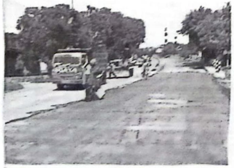
Perbaikan Jalan Prambon yang sempat dikeluhkan warga.

"Kami saat ini fokus untuk memperbaiki titik-titik jalan rusak, yaitu 39 titik. Nah, semua ini kami targetkan 2 bulan rampung," paparnya. (jok/ep)