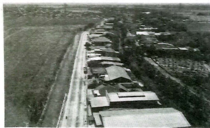
Gambaran jalan yang sudah dibeton di wilayah Kabupaten Sidoarjo.

"Tentunya kenaikan tersebut akan membangkitkan geliat ekonomi di daerah kami, bahkan terlihat juga mulai ramai orang berjualan di wilayah kami," jelasnya.