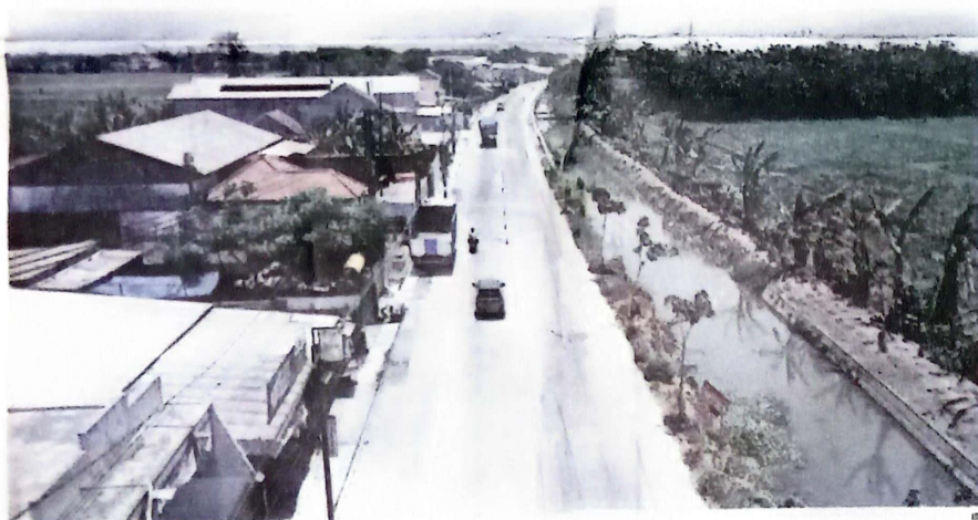
MULUS: Proyek betonisasi yang sudah dikerjakan Pemkab Sidoarjo secara berkelanjutan.

KOTA -Proyek betonisasi yang bertujuan untuk meningkatkan infrastruktur dan aksesibilitas desa dan kecamatan di Kabupaten Sidoarjo memicu transformasi ekonomi. Namun, efek samping yang paling mencolok adalah kenaikan harga tanah meroket mencapai 100 persen.