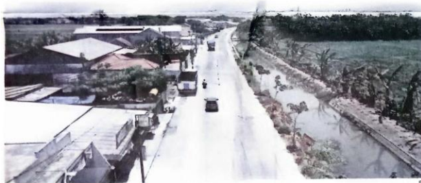
MULUS: Proyek betonisasi yang sudah dikerjakan Pemkab Sidoarjo secara berkelanjutan.

KOTA -Proyek betonisasi yang bertujuan untuk meningkatkan infrastruktur dan aksesibilitas desa dan kecamatan di Kabupaten Sidoarjo memicu transformasi ekonomi. Namun, efek samping yang paling mencolok adalah kenaikan harga tanah meroket mencapai 100 persen.