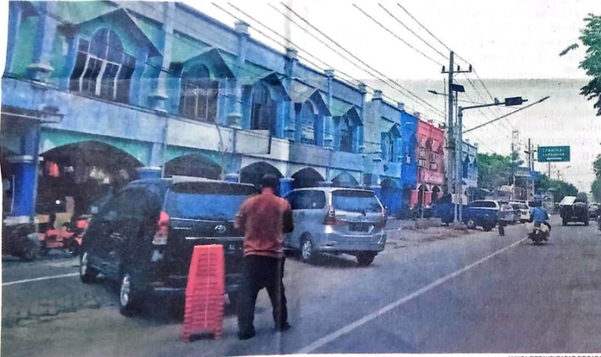
LEBIH RAPI: Penataan parkir di sisi timur Pasar Larangan setelah revitalisasi.