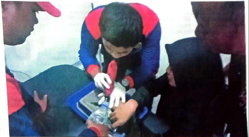
● Ke Halaman 10 HATI-HATI: Proses pelepasan cincin di Krian.

Mereka berusaha untuk mengatasi situasi ini dengan hati-hati dan cermat agar tidak menyebabkan