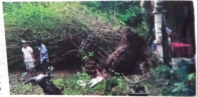
AMBRUK: Kondisi pohon tumbang yang menutup akses jalan perumahan di Sidoarjo.