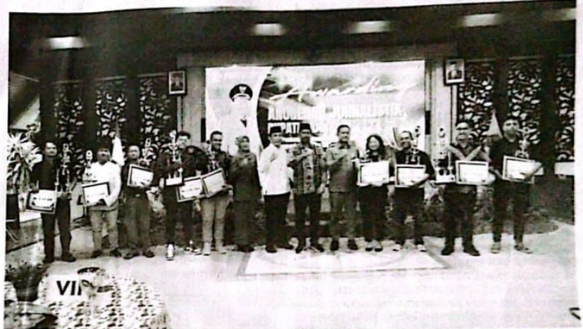
Awarding anugerah jurnalistik Bupati Sidoarjo 2023 Serin(27/11/23) sore.

"Acara seperti ini sudah selayaknya diadakan rutin, bisa tiap momen, atau rutin satu tahun dua kali agar pers berlomba-lomba menciptakan karya jurnalistik terbaik, pegiat fotografi memotret pembangunan Sidoarjo dan para vlogger mendokumentasikan dengan video