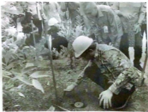
Bupati Sidoarjo Gus Muhdlor saat bikin Biopori.

Gus Muhdlor saat peringatan HUT ke-52 KORPRI Tahun 2023 serta HUT ke 24 Dharma Wanita Persatuan Tahun 2023. Dimulainya pembuatan biopori diawali langsung oleh Bupati Sidoarjo Ahmad Muhdlor bersama jajaran forkopimda Kabupaten Sidoarjo di halaman Balai Desa Tropodo Kecamatan Waru, Senin, (27/11/2023). "Gerakan ini untuk seluruh ASN di lingkungan Pemkab Sidoarjo, 1 ASN 2 lubang biopori. Masyarakat juga bisa membuat di rumah masing-masing," ujarnya. Gus Muhdlor menargetkan jumlah lubang biopori yang dibuat ASN sebanyak 27.000 lubang. Pembuatannya di rumah masing-masing. Bagi ASN yang tinggalnya di luar Sidoarjo pembuatan lubang biopori dilakukan di kantor-kantor pemerintah tempat bekerja serta di ruang