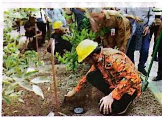
BIOPORI - Bupati bersama sejumlah pejabat Sidoarjo saat membuat lubang biopori, Selasa (28/11).