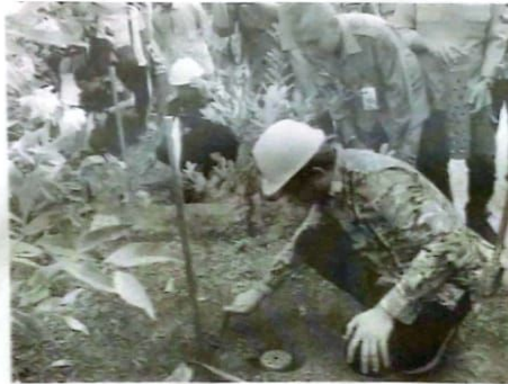
Bupati Sidoarjo Gus Muhdlor saat bikin Biopori.

Gus Muhdlor menargetkan jumlah lubang biopori yang dibuat ASN sebanyak 27.000 lubang. Pembuatannya di rumah masing-masing. Bagi ASN yang tinggalnya di luar Sidoarjo pembuatan lubang biopori dilakukan di kantor-kantor pemerintah tempat bekerja serta di ruang