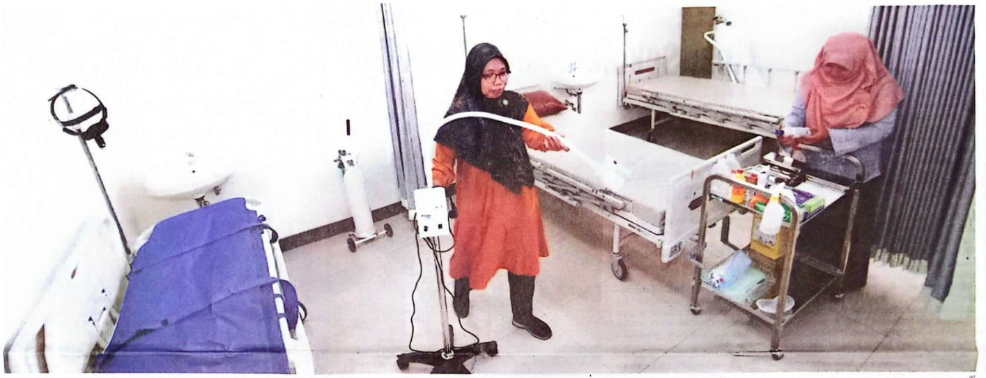
PERSIAPAN : Puskesmas Uranguno dua masih tahap penyempurnaan untuk terakreditasi paripurna.