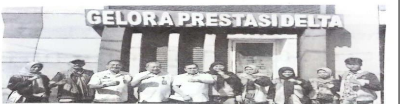
Para atlet youth putri arung jeram Sidoarjo, kemarin, dilepas oleh Ketua Umum IKONI Sidoarjo, di kantor Koni Sidoarjo, untuk bertanding dalam Kejurnas arung jeram di Jakarta.