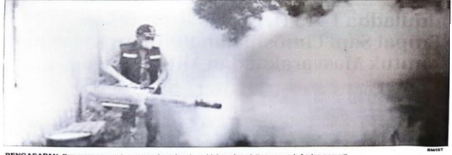
PENGASAPAN: Penyisapan untuk mencegah perkembangbiakan dan gigitan nyamuk Aedes aegypti.

KOTA -Badan Pengawas Pemilu (Bawaslu) Sidoarjo mengambil peran aktif dalam mengawasi proses rekrutmen Petugas Pemutakhiran Data Pemilih (Pantarlih) yang sedang berlangsung. Hal ini dilakukan untuk memastikan proses rekrutmen berjalan sesuai prosedur dan menjerang calon Pantarlih yang memenuhi persyaratan. Ketua Bawaslu Sidoarjo Agung Nugraha menegaskan komitmen Bawaslu untuk mengawasi seluruh tahapan Pemilihan Kepala Daerah (Pilkada) 2024.