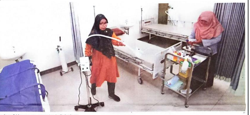
PERSIAPAN: Puskesmas Urangguno dua masih tahap penyempurnaan untuk terakreditasi paripurna.

Termasuk proses rekrutmen Pantarlih. "Semua tahapan Pilkada 2024 akan kami awasi. Termasuk saat ini dalam proses rekrutmen Pantarlih kami juga akan mengawasi," ujarnya. Menurut Agung, terdapat dua fokus utama dalam pengawasan rekrutmen Pantarlih. Pertama, memastikan proses rekrutmen mematuhi prosedur yang telah ditetapkan. Kedua, memastikan calon Pantarlih memenuhi persyaratan yang berlaku. "Tentu yang kita awasi bagaimana rekrutmen harus taat terhadap prosedur jangan sampai di luar ketentuan.