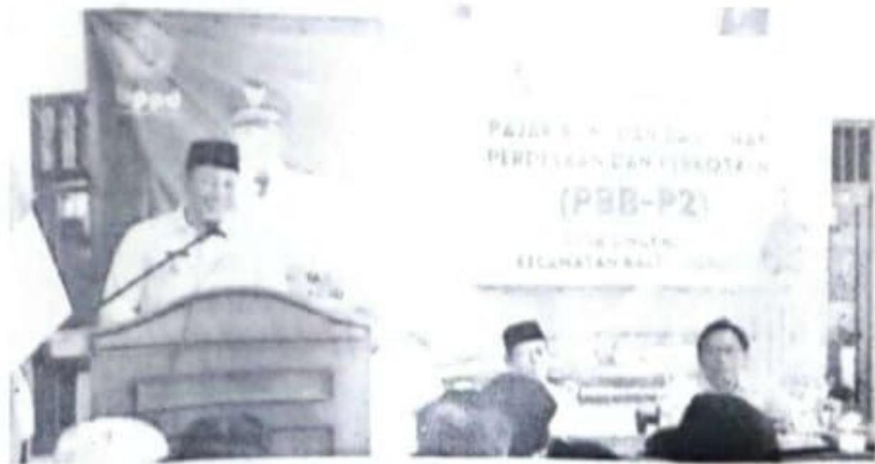
Plt Bupati Sidoarjo Subandi sosialisasi PBB-P2 di Balai Desa Singkalan, Kecamatan Balongbendo.

PBJT itu meliputi pajak makanan dan minuman, pajak tenaga listrik, pajak jasa perhotelan, pajak jasa parkir, pajak jasa kesenian dan hiburan. Ingat, pemutihan pajak berakhir sampai 27 September 2024. (md/rus)