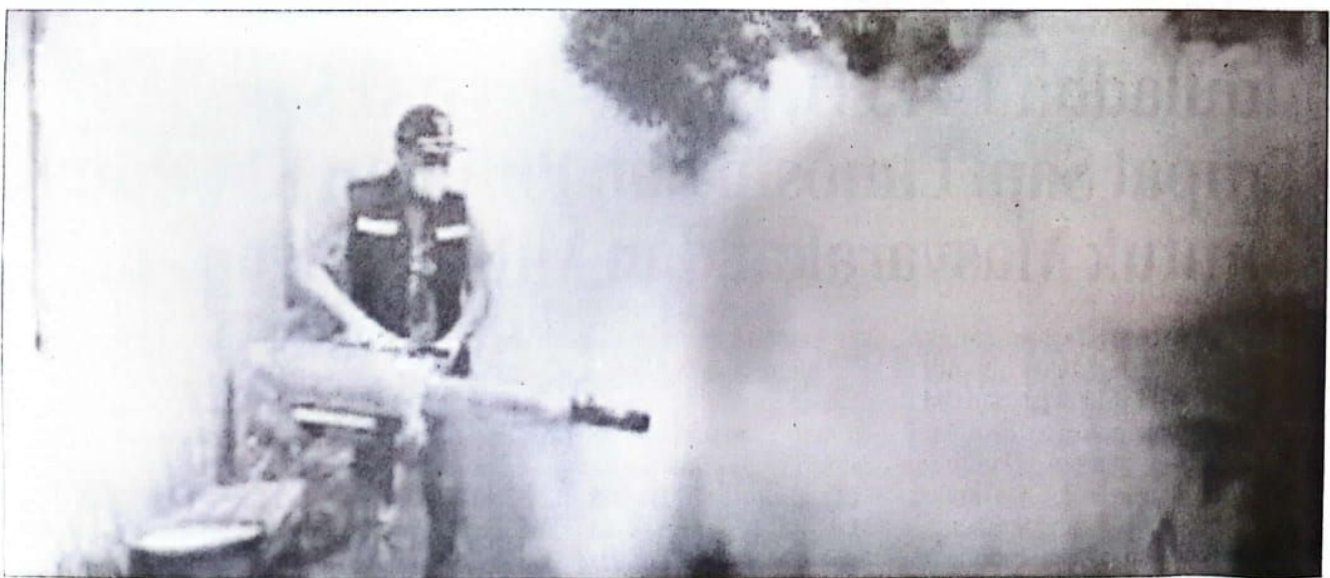
PENGASAPAN: Penyasapan untuk mencegah perkembangbiakan dan gigitan nyamuk Aedes aegypti .

Di seluruh dunia telah ditemukan 390 juta infeksi virus Dengue per tahun dan diperkirakan ada 3,9 miliar orang yang berisiko terinfeksi DENV ini. Di Kabupaten Sidoarjo sampai tanggal 5 Juni 2024 ditemukan 242 kasus dengan dua kematian. (udi)