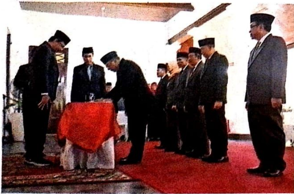
UTAK-ATIK: Bupati Sidoarjo Ahmad Muhdlor memimpin mutasi pejabat.