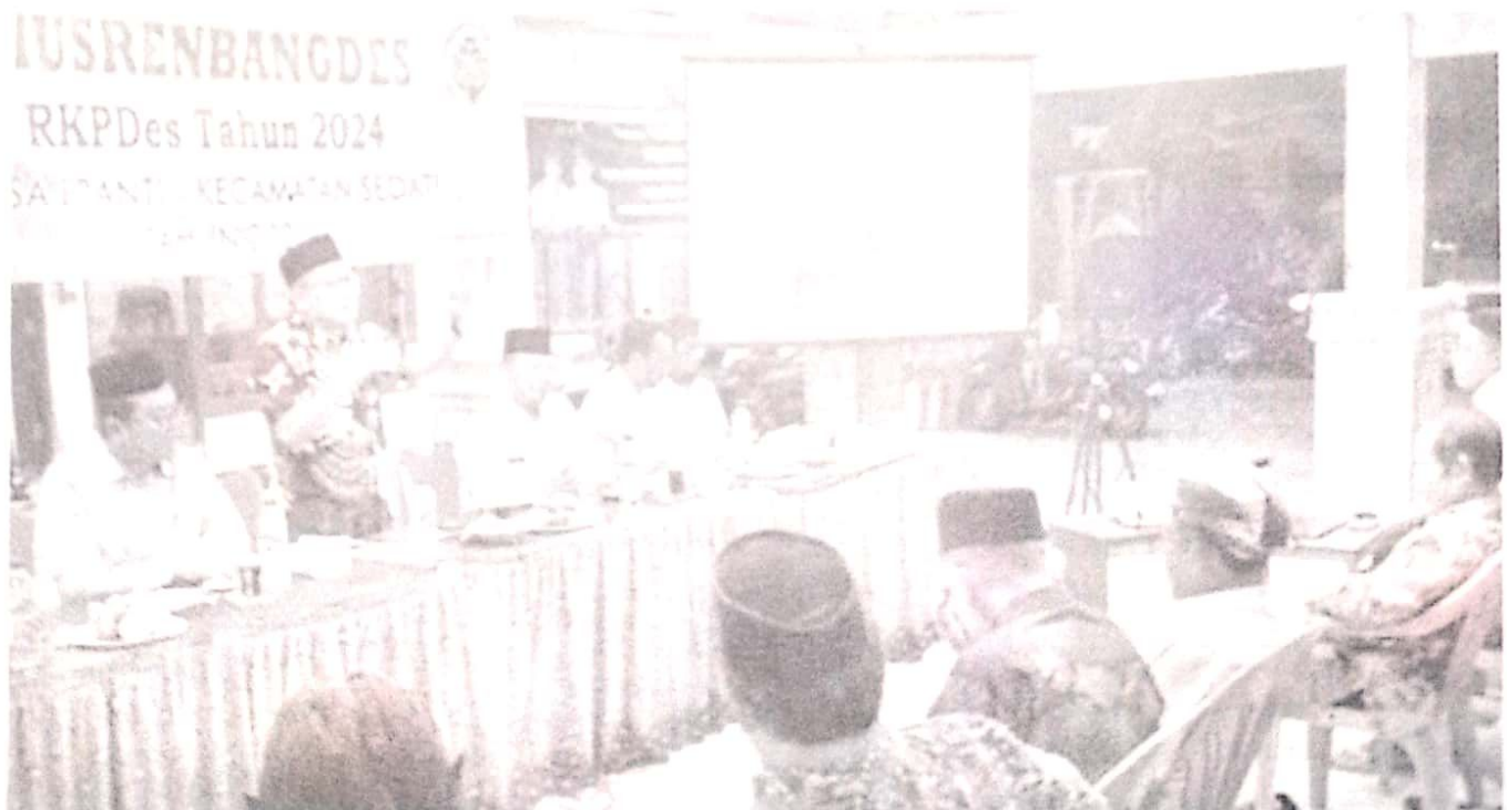
Musrenbangdes RKPDes tahun 2024 Desa Pranti, Kecamatan Sedati, Kabupaten Sidoarjo.

Hadir dalam musrenbang Desa Pranti di antaranya, ketua BPD Pranti bersama anggota, LPMD, penggerak PKK, karang taruna, ketua RT, RW, tokoh masyarakat, dan tokoh agama.(adv/din/rd)