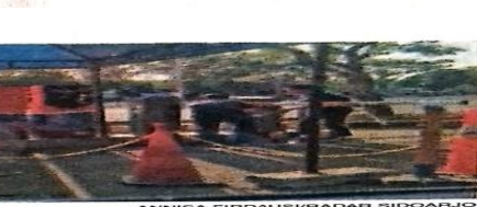
BAKAL DICEK: Salah satu titik parkir yang saat ini dikelola oleh PT ISS.