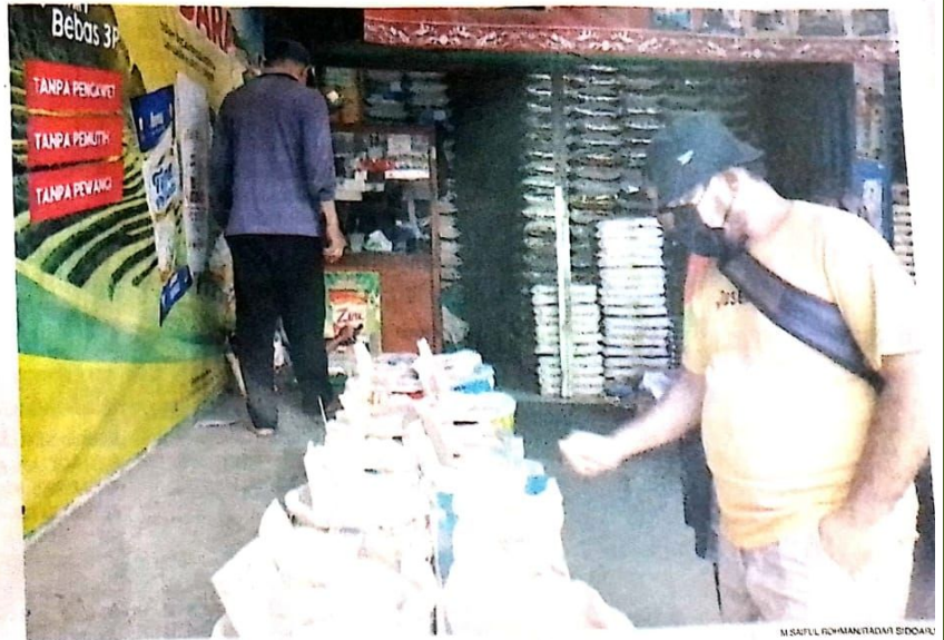
MAHAL: Seorang pembeli melihat beras di Pasar Larangan.