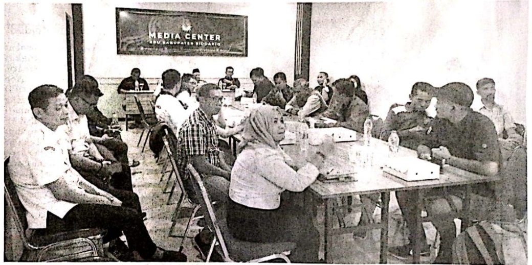
DISKUSI: Anggota KPU Sidoarjo beserta perwakilan parpol dan bawaslu saat rapat koordinasi persiapan pencermatan DCT.

Salah satu poin penting yang disampaikan adalah persyaratan ber-