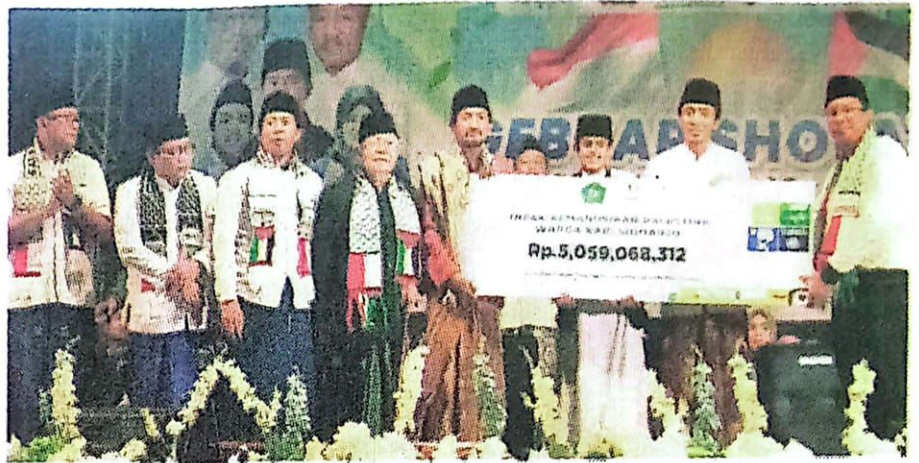
Bupati menunjukkan hasil penggalangan dana bantuan untuk Palestina.

"Solidaritas kita kepada saudara kita di Palestina, bukan hanya berkata dengan agama,