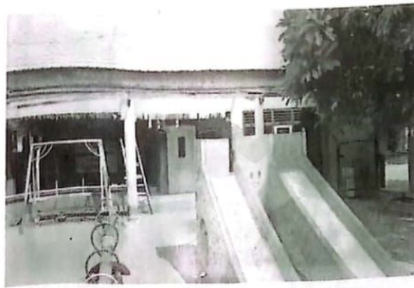
TK Dharma Wanita Persatuan Direhabilitasi.