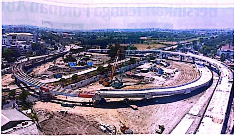
HASIL KERJA NYATA: Kabupaten Sidoarjo di bawah kepemimpinan Bupati Ahmad Muhdlor Ali SIP berhasil mewujudkan pembangunan-pembangunan infrastruktur yang berkontribusi langsung terhadap peningkatan kualitas hidup masyarakat Sidoarjo. Salah satunya adalah flyover Aloha yang saat ini telah menyelesaikan pemasangan balok girder dan siap diuji coba akhir tahun.