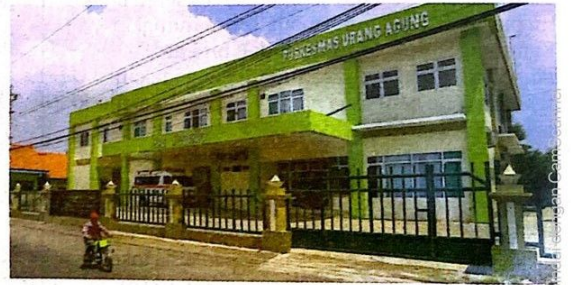
SUDAH BEROPERASI: Puskesmas Urangagung II yang baru saja diresmikan kemarin (26/11).

Puskesmas Urangagung II bakal melayani pasien di wilayah Kelurahan Urangagung, Sidoarjo. Nanti puskesmas menangani warga empat desa atau kelurahan. Mulai dari Urangagung, Suko, Cemengkalang, hingga Sarirogo. "Kalau yang Puskesmas Urangagung I tangani wilayah kelurahan di timurnya lagi, seperti Sumpat dan Jati," ujarnya. (eza/c6/any)