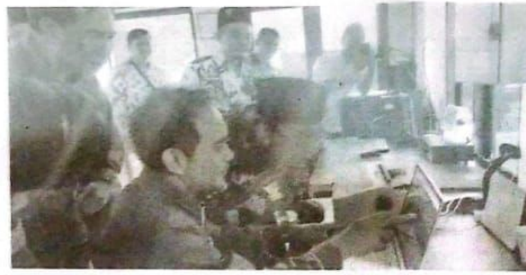
Bupati Sidoarjo Ahmad Muhdlor Ali di TPA Girimulyo.

"Dengan pembayaran tonase sampah yang masuk bukan dihitung berdasarkan KK, tetapi jumlah seberapa banyak yang dibuang oleh TPS 3R maka saya yakin ini menjadi sinyal baru, terobosan baru untuk mengurangi sampah yang masuk ke TPA Griyo Mulyo ini," kata Gus