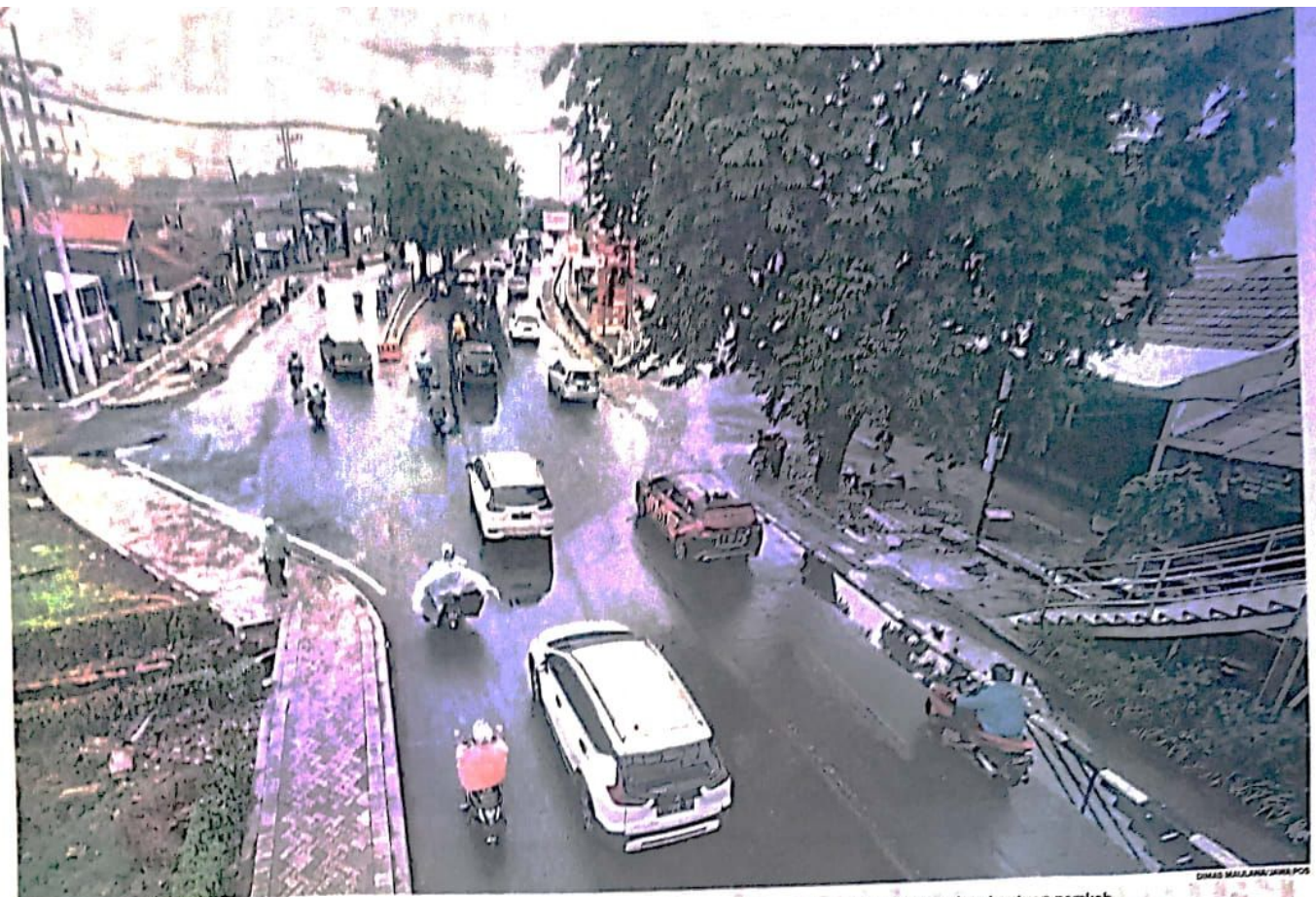
CARI SOLUSI TERBAIK: Kendaraan melintas di bundaran Aloha kemarin. Pelaku usaha yang terdampak pengerjaan flyover Aloha minta bantuan pemkab.