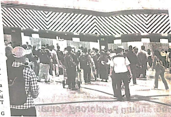
Suasana Bandara Internasional Juanda menjelang pelaksanaan KTT G20.

Melalui Bidang Tempat Pemeriksaan Imigrasi (TPI) Bandara Juanda, Kanim Surabaya menyiapkan sejumlah perlakuan khusus