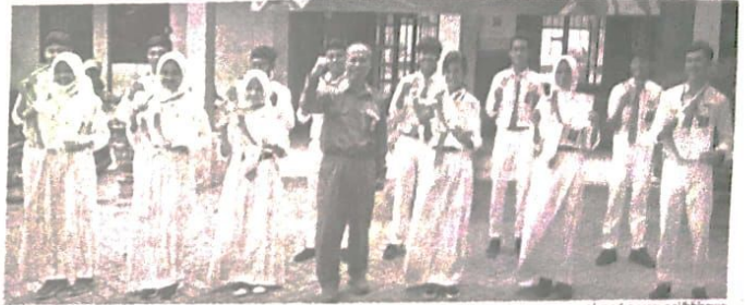
Kepala SMAN 4 Sidoarjo terus memberikan support kepada para siswanya.

Menurut Imam, pihak sekolah sangat mensupport kegiatan ekstrakurikuler para siswa. Diantaranya memberikan kemudahan atau dispensasi bila atlet harus berlomba meraih prestasi. Bahkan dirinya selalu hadir untuk memberikan support kepada mereka saat berlaga. [ach.fen]