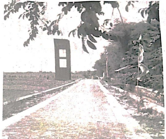
Proyek pembangunan pemeliharaan pavingisasi di RT4,5,6 RW 4 desa Kajeksan dusun Godekan yang diduga tidak transparan pada publik tentang besarnya volume pekerjaan.

nyambung sampai finishing , ia menyarankan menghubungi kontraktor nya,Katanya pada Kabiro HR Pojok Kiri Sidoarjo H.Kholiq.SAg.Sedang investasi wartawan dilokasi proyek pavingisasi RT4,5,6 RW4 desa Kajeksan dusun Godekan pavingisasi dengan estimasi 220M2 X 4 m×75.000 harga estimasi paving ketemu angka Rp 66jt x ongkos kerja sampai finishing ketemu kurang lebih 140 jt.Sementara Sodik,warga setempat saat dikonfirmasi wartawan terkait proyek pemeliharaan pavingisasi RT 02,RW7 yang mangkrak tidak nyambung sampai titik finishing , ia sangat menyesalkan proyek yang diduga jadi bancakan itu,Katanya pada wartawan.Dia menuturkan pada wartawan masyarakat sempat bertanya kok tidak nyambung sebesar Rp175 juta,Tandasnya. Dia juga mengkritisi pemasangan ikatan paving terlihat kurang semen yang berakibat rawan ambrol pavingisasi itu,Katanya. Sedangkan Solik ketua LSM AMPK Aliansi Masyarakat Perangi Korupsi kabupaten