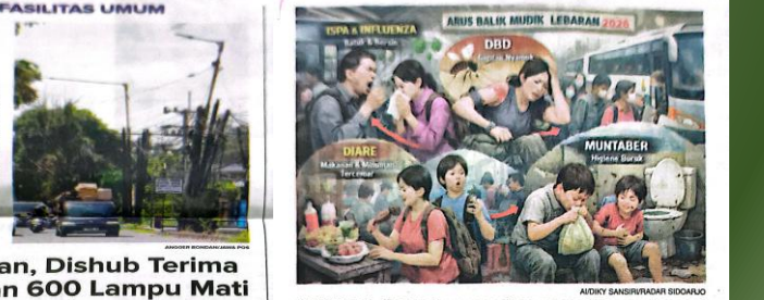
WASPADA: Ilustrasi pencegahan penyakit menular saat arus balik Lebaran.

Kekurangan Bakal Calon. KOTA-Meningkatkan pelaksanaan Pemilihan Kepala Desa (Pilkades) tahun 2026, pemerintah desa di Kabupaten Sidoarjo masih beresiko mengalami kekurangan bakal calon.