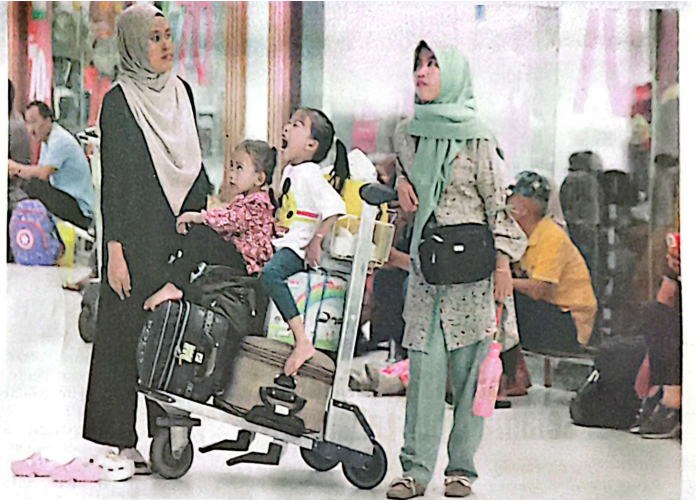
RAMAI: Arus balik Lebaran di Bandara Juanda menunjukkan peningkatan signifikan. Calon penumpang memadati area keberangkatan.