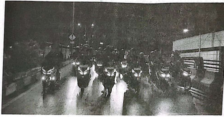
Para pengendara Honda saat berkendara di malam hari.

Untuk mendukung keselamatan berkendara, pengendara diimbau merencanakan perjalanan dengan baik, termasuk menentukan rute dan waktu tempuh. Istirahat secara berkala setiap dua jam sangat disarankan dengan memanfaatkan