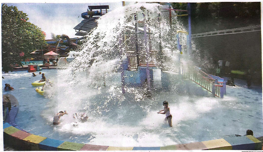
DESTINASI WISATA: Kunjungan ke Sun City Waterpark mencapai 500 orang per hari selama libur Idul Fitri.

terjadi pada destinasi wisata lain. Seperti Wisata Lumpur Sidoarjo, Bahari Tlocor, Monstro Fishing Park hingga pemancingan Tambak Cemandi. Kepala Dinas Pemuda, Olahraga dan Pariwisata (Disporapar) Sidoarjo Yudhi Irianto menyampaikan bahwa kenaikan kunjungan di destinasi wisata hanya 3 persen. Hal itu dipengaruhi sejumlah hal. Selain banyak masyarakat berlibur ke luar kota, faktor cuaca juga menghambat kunjungan. "Cuaca masih cenderung hujan. Kondisi itu jadi pertimbangan masyarakat," katanya. (ful/hen)