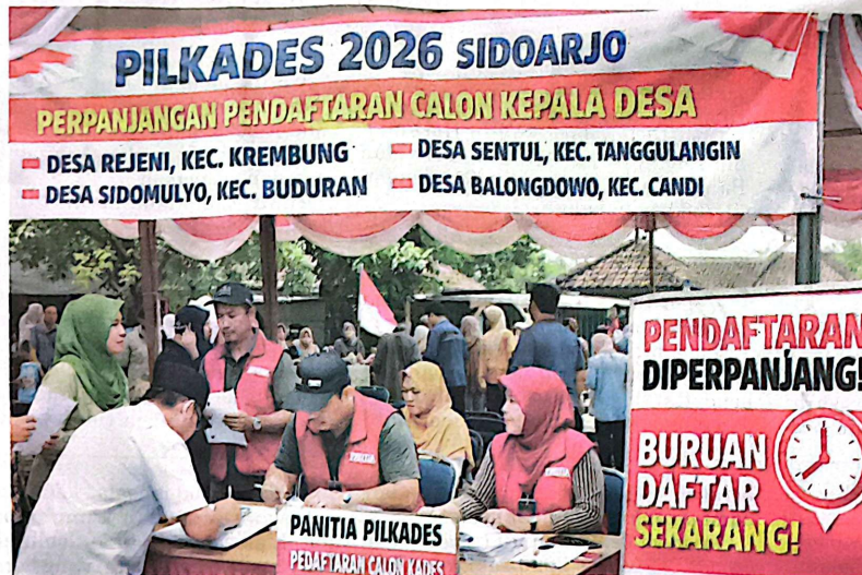
Ilustrasi desa di Sidoarjo memperpanjang masa pendaftaran Pilkades 2026.