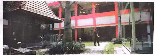
TINGKATKAN PELAYANAN: Proyek penambahan ruang di Gedung Mawar Merah Putih akan digarap Juli.

Selama proses pengerjaan, dia memastikan pelayanan tetap berjalan. Lantai dua Gedung Mawar Merah Putih akan dikosongkan sementara. Sebanyak 26 bed dialihkan ke ruang Mawar Kuning, Tulip dan Teratai. (ful/hen)