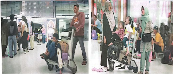
RAMAI: Arus balik Lebaran di Bandara Juanda menunjukkan peningkatan signifikan. Calon penumpang memadai area keberangkatan.