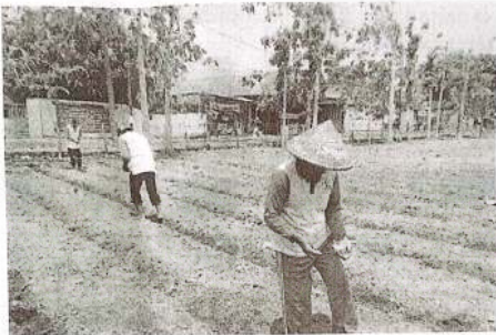
Warga binaan pemsarakatan mulai menanam jagung yang baru diresmikan Plt Dirjen Pemasarakatan.

ini, sesuai dengan arahan Kalapas Kelas I Surabaya karena kemudahan dalam perawatan maupun fokus perawatan untuk beberapa tanaman terlebih dahulu sehingga potensi hasil bisa dirasakan secara maksimal bagi petugas, WBP, maupun masyarakat" ujarnya.