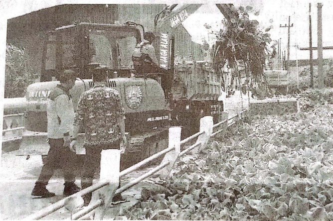
Alat berat dikerahkan untuk mengangkut eceng gondok dari aliran Kali Buntung.