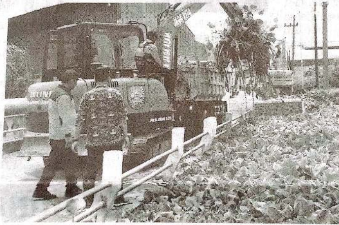
Alat berat dikerahkan untuk mengangkut eceng gondok dari aliran Kali Buntung.