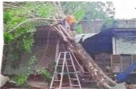
PROSES EVAKUASI: Petugas dari tim reaksi cepat (TRC) yang diterjunkan sesuai bencana angin kencang di Desa Ngingas, Waru, Sabtu (30/11).