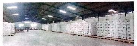
SELESAI REKAP: Seluruh kotak suara berisi dokumen hasil coblosan Pilkada Serentak 2024 sudah tersimpan di gudang KPU Jalan Erlangga kemarin.

Meski selesai dengan cepat, Haidar mengakui selama proses rekapitulasi ditemukan sejumlah masalah administratif. Yang paling banyak adalah soal perbedaan jumlah surat suara di sejumlah tempat pemungutan suara (TPS) yang lebih sedikit