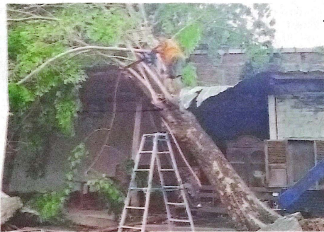
PROSES EVAKUASI: Petugas dari tim reaksi cepat (TRC) yang diterjunkan se usai bencana angin kencang di Desa Ngingas, Waru, Sabtu (30/11).