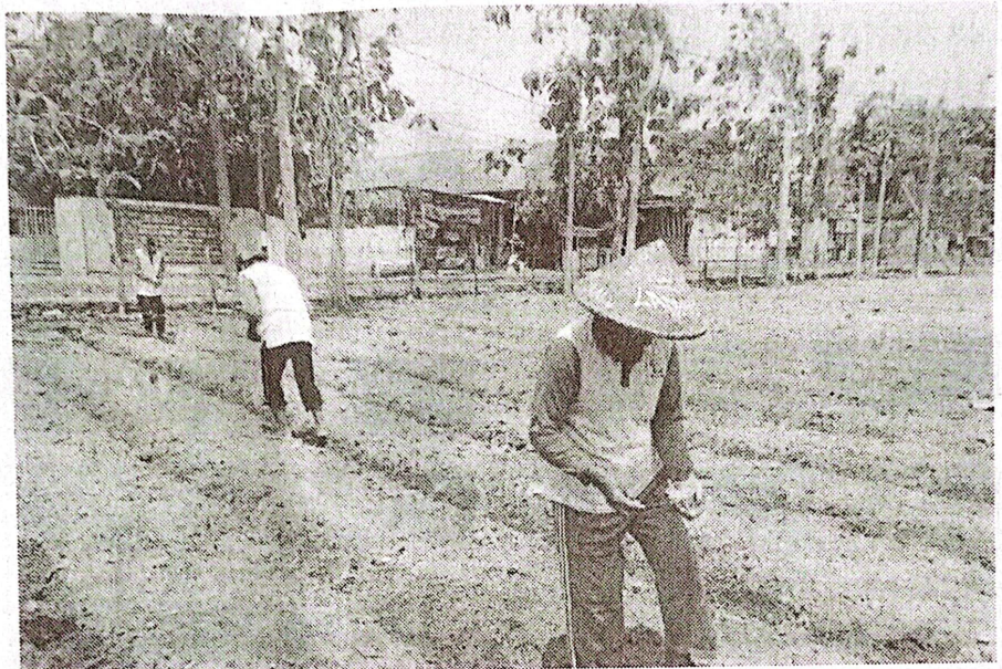
Warga binaan pemasyarakatan mulai menanam jagung yang baru diresmikan Plt Dirjen Pemasyarakatan.

ini, sesuai dengan arahan Kalapas Kelas I Surabaya karena kemudahan dalam perawatan maupun fokus perawatan untuk beberapa tanaman terlebih dahulu sehingga potensi hasil bisa dirasakan secara maksimal bagi petugas, WBP, maupun masyarakat” ujarnya.