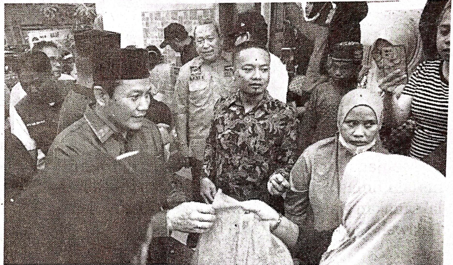
Penyerahan bantuan kepada warga terdampak puting beliung.