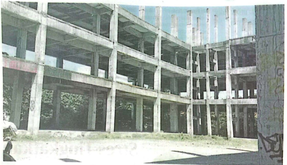
TERBENGKALAI: Di gedung inilah, warga sekitar mendapati perbuatan tak patut sejumlah pelajar. Diketahui, gedung ini sudah lama mangkrak.

Mereka naik ke lantai 2 bangunan tersebut sekitar