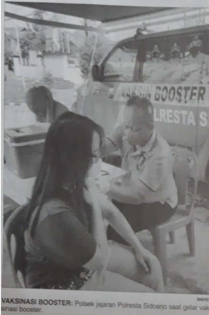
VAKSINASI BOOSTER: Polsek jajaran Polresta Sidoarjo saat gelar vaksinasi booster.

"Silakan bagi masyarakat yang belum vaksin, khususnya dosis ketiga dapat mendatangi layanan vaksinasi kami, termasuk di gerai vaksinasi Polresta Sidoarjo di pos polisi Taman Pinang Indah," ujarnya. (udi)