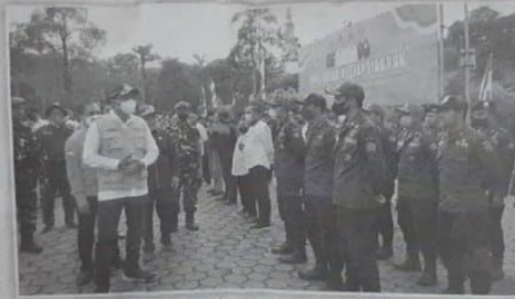
Personel apel siaga bencana hidrometeorologi mendapat pencerahan dari bupati.

"Saya harap dalam penanganan bencana ini pertama, masing-masing