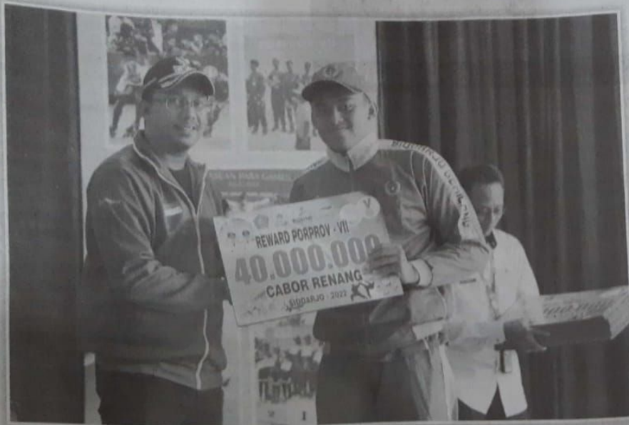
Bupati Sidoarjo memberi reward atlet peraih medali di Porprov Jatim ke-VII.

Sebagai informasi, kontingen Sidoarjo pada Porprov Jatim VII tahun ini meraih 61 medali emas, 66 perak dan 83 perunggu. Kontingen Sidoarjo berada di posisi ke tiga di bawah Kota Surabaya, dan Kota Malang. (adv/jok/mik)