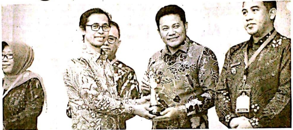
PENGHARGAAN - Pemkab Sidoarjo menerima penghargaan Innovative Government Awards (IGA) 2022 dengan kategori Kabupaten Sangat Inovatif saat Penganugerahan IGA 2022 di Gedung C Lantai III Ruang Sasana Bhakti Praja Kementerian Dalam Negeri, Jumat (23/12/2022).

"Kabupaten Sidoarjo memiliki kebijakan satu OPD minimal membuat satu inovasi. Kebijakan ini sudah dituangkan dalam Peraturan Bupati (Perbup) Sidoarjo. Melalui Perbup itu seluruh OPD Sidoarjo berlomba-lomba mem-