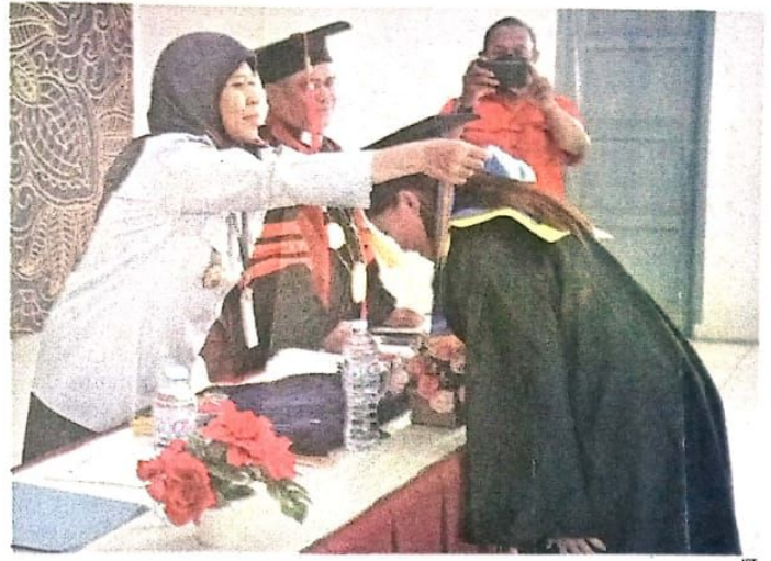
LULUS: Salah satu warga binaan rutan perempuan yang diwisuda, Jumat (23/12).