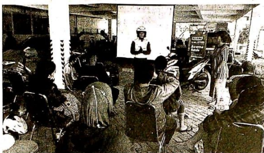
Sebanyak 50 penyandang disabilitas antusias mengikuti edukasi dan pelatihan safety riding yang di sampaikan oleh instruktur safety riding PT. Mitra Pinasthika Mulia (MPM Honda Jatim).

anggota komunitas Disabilitas Motorcycle Indonesia (DMI) Jatim. Pelatihan yang diberikan