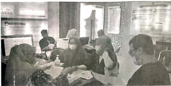
ANTRE: Warga yang mendaftar Panitia Pemungutan Suara (PPS) di kantor KPU Sidoarjo.

KOTA-Komis Pemilihan Umum (KPU) Sidoarjo memperpanjang jadwal pendaftaran rekrutmen Panitia Pemungutan Suara (PPS). Sebelumnya, pendaftaran dibuka pada 18 hingga 27 Desember. Namun sesuai dengan Keputusan KPU nomor 534 tahun 2022, penerimaan pendaftaran PPS berakhir pada 30 Desember.