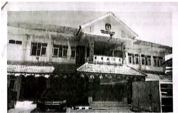
Kantor KPU Kabupaten Sidoarjo Jl.Raya Cemengkalang No.1 Sidoarjo(FT/)

DEWAN PERWAKILAN RAKYAT DAERAH KABUPATEN SIDOARJO