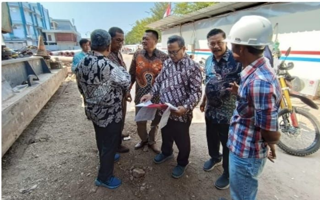
Komisi C DPRD Sidoarjo saat meninjau pembangunan Gedung Pusat Terpadu (GPT) di RSUD Sidoarjo pada pertengahan Agustus 2023.

Menurut rencana, GPT RSUD Sidoarjo ini bakal difungsikan untuk perkantoran manajemen rumah sakit, ruang pertemuan, klinik-klinik pelayanan, maupun pusat diagnostik terpadu yang akan melayani beragam pemeriksaan kesehatan dalam satu gedung.