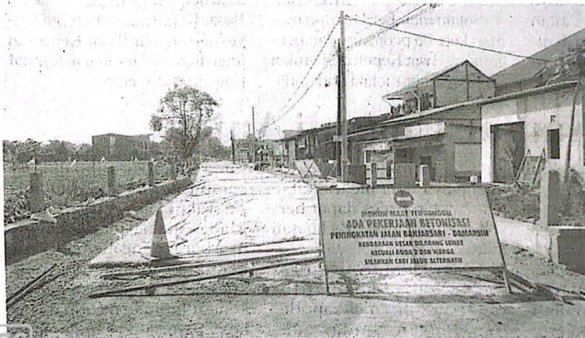
Proyek Betonisasi Ruas Jalan Banjarsari - Damarsi.