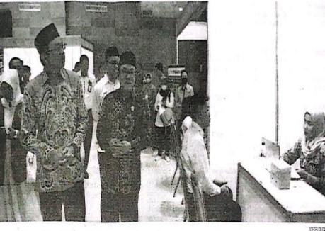
Bursa Kerja Hybrid 2023 Sidoarjo Selasa (22/8/2023).

SIDOARJO - Pemerintah Kabupaten Sidoarjo melalui Dinas Tenaga Kerja Kabupaten Sidoarjo mengambil langkah proaktif untuk meningkatkan peluang pekerjaan bagi masyarakat Sidoarjo dengan menyelenggarakan kegiatan bursa kerja terbuka secara hybrid (online dan offline) di MPP Sidoarjo selama dua hari mulai Selasa 22 - 23 Agustus 2023. Bupati Sidoarjo Ahmad Muhdlor Ali menegaskan dengan adanya bursa kerja terbuka secara hybrid ini, diharapkan benar-benar dimanfaatkan oleh masyarakat khususnya warga Sidoarjo untuk mencari peluang pekerjaan sesuai dengan passionnya. "Saya berpesan jangan sampai warga lokal di Kabupaten Sidoarjo hanya menjadi penonton di daerahnya sendiri, atau ibaratnya jangan sampai ayam-ayam mati di tengah lumpung padi, jadi tolong benar-benar dimanfaatkan kesempatan baik ini," tegas Gus Muhdlor sapaan akrabnya. Kepala Dinas Tenaga Kerja