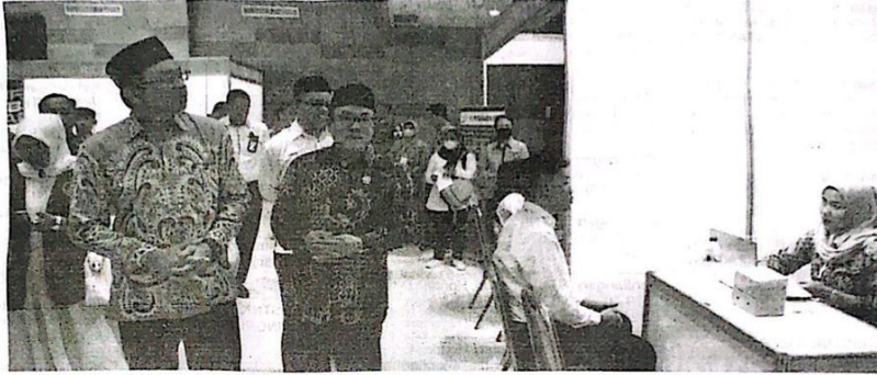
Bursa kerja Hybrid 2023 Sidoarjo Selasa (22/8/23).