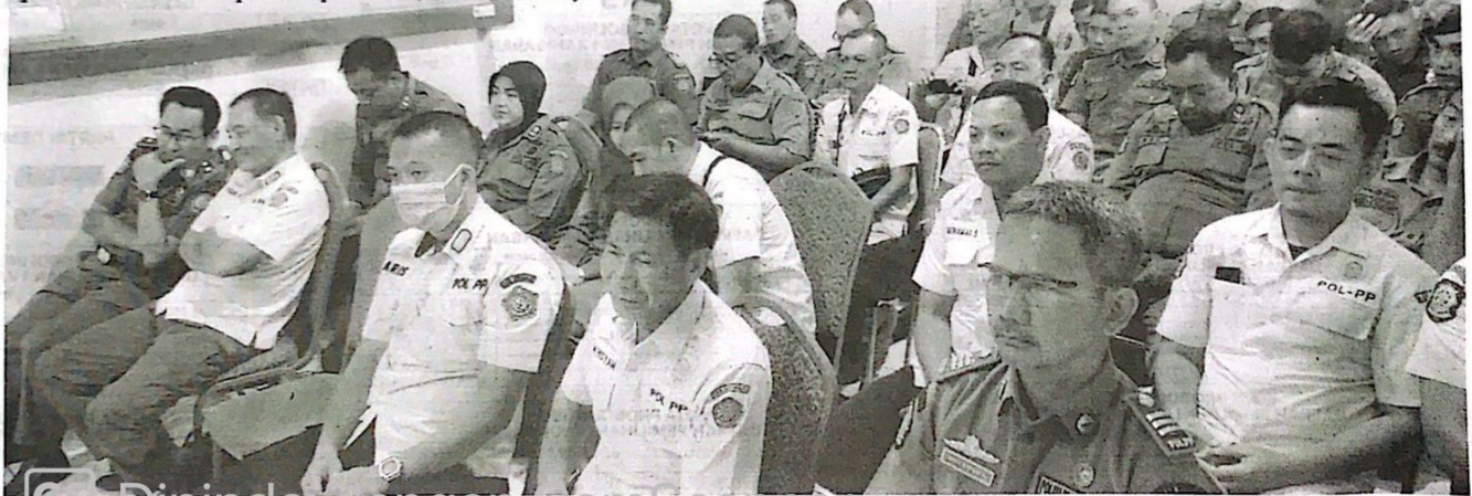
SOSIALISASI: Satpol PP Sidoarjo gelar sosialisasi peredaran rokok ilegal di ruang sidang, dihadiri anggota DPRD Sidoarjo, petugas Pengawasan Dan Pelayanan Bea Dan Cukai Tipe Madya Pabean B Sidoarjo. (gus)

Operasi pasar akan membawa alat khusus untuk mendeteksi peredaran rokok ilegal. Harapan kami semoga kedepan adalah rokok ilegal makin berkurang di Kabupaten Sidoarjo. "Sosialisasi dan operasi pasar terus kami galakkan, sehingga masyarakat lebih tahu, mengerti, paham, tentang apa rokok ilegal. Mana rokok yang ilegal, dan mana rokok yang legal," pungkasnya. (gus /dar)