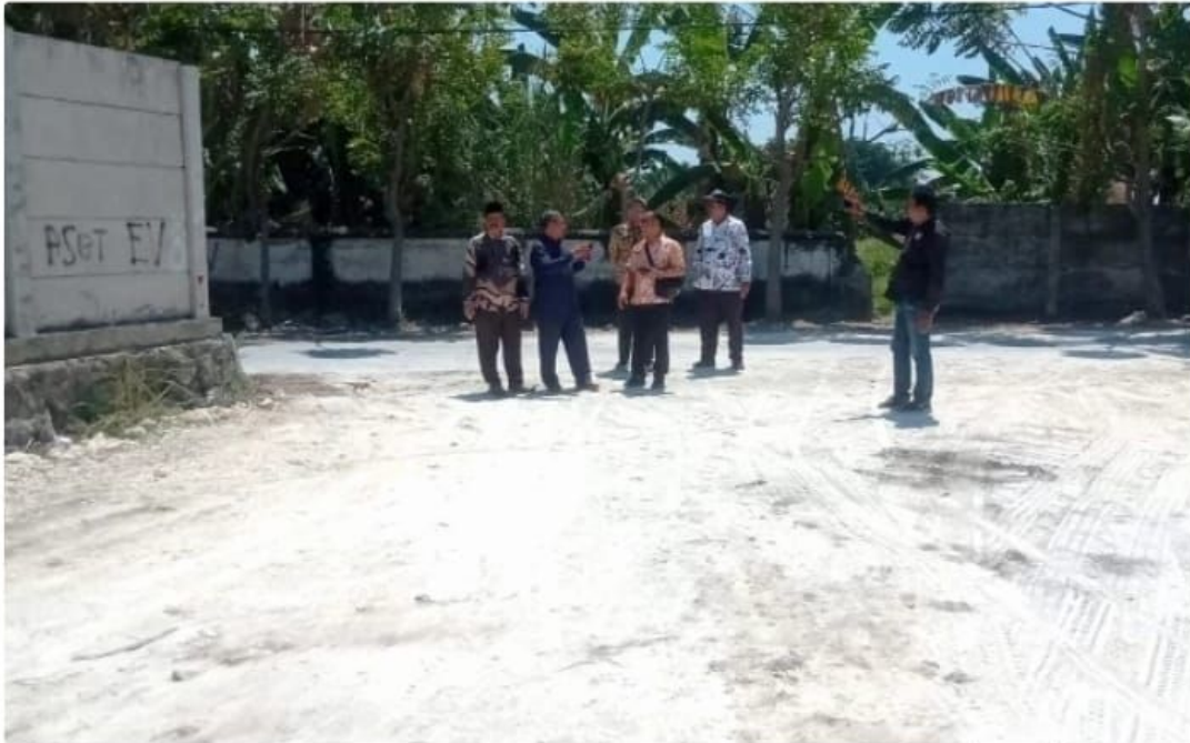
Rombongan Komisi C DPRD Sidoarjo mengamati lokasi urukan proyek untuk gedung baru di RSUD Sidoarjo Barat pada Selasa (22/8/2023).

"Kami langsung menindaklanjuti pengaduan masyarakat menyangkut pengurukan lahan itu," katanya sekembali dari sidak di Krian ke kantor DPRD Sidoarjo.