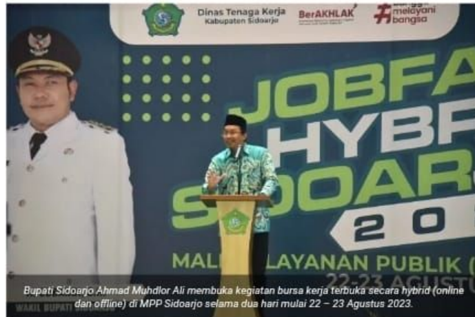
Bupati Sidoarjo Ahmad Muhdlor Ali membuka kegiatan bursa kerja terbuka secara hybrid (online dan offline) di MPP Sidoarjo selama dua hari mulai 22 – 23 Agustus 2023.

SIDOARJO (wartadigital.id) – Pemkab Sidoarjo melalui Dinas Tenaga Kerja setempat mengambil langkah proaktif untuk meningkatkan peluang pekerjaan bagi masyarakat Sidoarjo dengan menyelenggarakan kegiatan bursa kerja terbuka secara hybrid (online dan offline) di MPP Sidoarjo selama dua hari mulai 22 – 23 Agustus 2023.