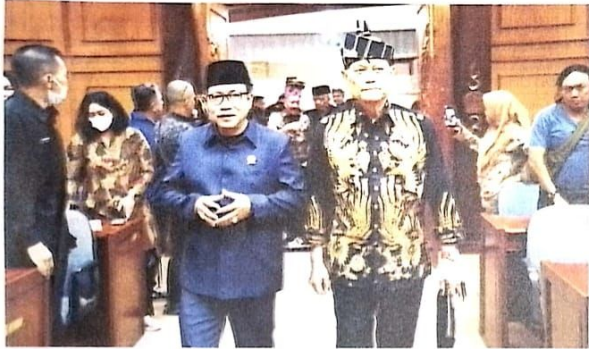
KOORDINASI: Ketua DPRD Sidoarjo Usman menyambut kedatangan Ketua MKD DPR RI Adang Daradjatun, Senin (4/9).

KOTA - Majelis Kehormatan Dewan (MKD) DPR RI di bawah kepemimpinan Ketua MKD Adang Daradjatun mengeluarkan imbauan untuk menunda sementara pemeriksaan terhadap calon anggota DPRD/RI hingga selesainya Pemilihan Legislatif (Pileg). Pernyataan tersebut disampaikan oleh Adang, Senin (4/9) di kantor DPRD Sidoarjo.