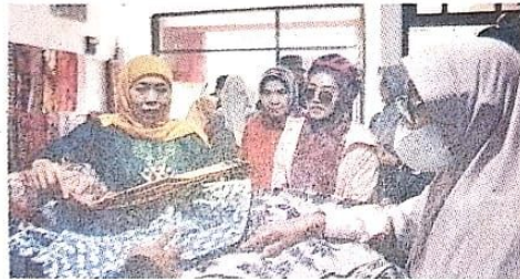
KAMPOENG BATIK - Gubernur Jatim Khofifah Indar Parawansa didampingi istri Bupati Sidoarjo Ny Sa'adah Ahmad Muhdlor mengunjungi Kampoeng Batik Jetis.

"Porprov Jatim 2023 ini bukan hanya ajang olahraga saja. Tetapi menjadi momen yang tepat mempromosikan produk lokal