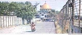
BULAN DI OKEKARJAN: Pengendara melintas di Jalan Pasar Waru kemarin (4/9). Kawasan ini termasuk dalam proyek lanjutan freeway road (FR).

SIDOARJO - Lelang proyek pembangunan Blok freeway road (FR) ruas Ubeli Sari hingga pabrik pakan di Kecamatan Pemungung PT Jaya Etika Teknik. Pemenang proyek tersebut sudah digarap. Perkala Dinas Pekerjaan Umum Bina Marga dan Sumber Daya Air (BINA MARGA) Sidoarjo Puri Iko Saptono mengatakan, proses penandatanganan kontrak antara Pankah Sidoarjo dan pemenang lelang juga sudah selesai dilakukan. Rencana, proses pembangunan dimulai minggu depan. Diawali pembangunan jembatan di jalur FR terlebih dahulu. Sebab, proses pembangunan jembatan memerlukan waktu lebih lama. Total ada tiga jembatan di jalur FR. Jembatan yang melintasi Sungai