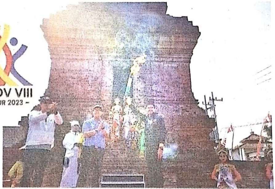
Pengambilan api di Candi Pari sebagai tanda akan dimulainya Porprov VIII Jatim.