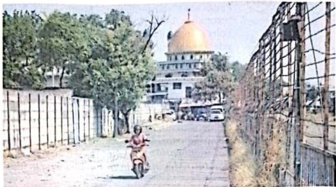
BULAN INI DIKERJAKAN: Pengendara melintas di Jalan Pasar Waru kemarin (4/9). Kawasan ini termasuk dalam proyek lanjutan frontage road (FR).

Total ada tiga jembatan di jalur FR. Yakni, jembatan yang melintasi Sungai