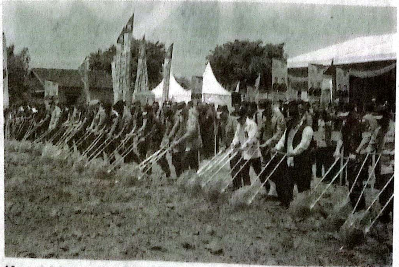
Kapolri bersama Panglima TNI di acara penyerahan bibit unggul, di Bulang, kemarin.

Kapolri menyebut, bahwa kegiatan ini sebagai kegiatan awal dari rangkaian kegiatan yang akan terus dilaksanakan, dan hari ini juga memberikan bantuan kepada petani, berupa bibit maupun anggaran. (cat/rus)