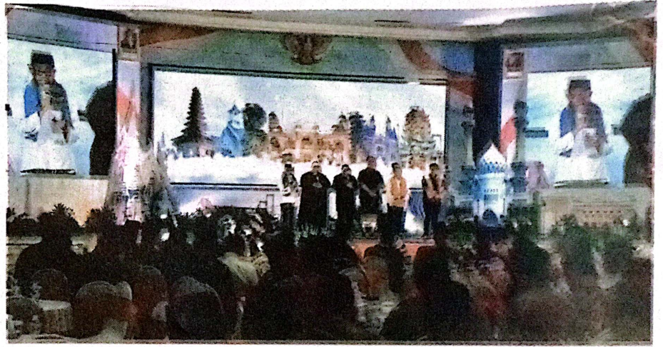
Panglima TNI, Kapolri, Danpuspenerbal Doa lintas agama untuk Pilkada 2024

Ini juga lanjutnya, merupakan bagian dari upaya agar seluruh rangkaian kegiatan pilkada ini berjalan dengan aman, lancar. Dan tentunya kita