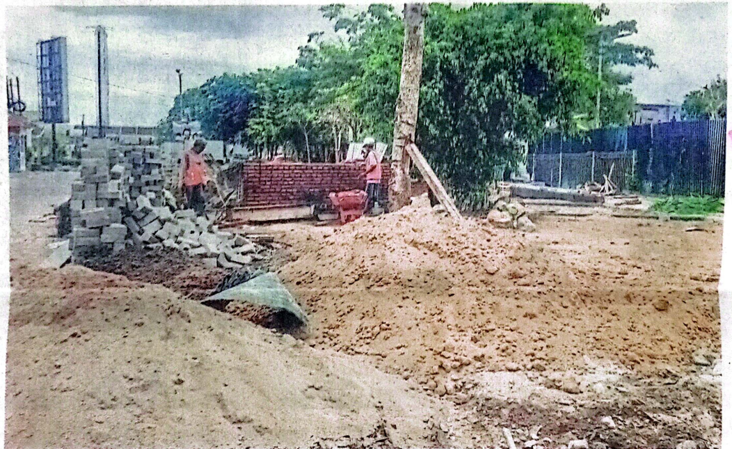
BERTAHAP: Pembangunan Taman ASEAN di Pagerwojo tengah berlangsung. Kawasan ini diproyeksikan menjadi area rekreasi.

Sesuai rencana, taman tersebut akan diubah menjadi taman aktif. Pengunjung dapat memanfaatkan