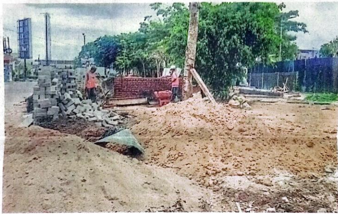
BERTAHAP: Pembangunan Taman ASEAN di Pagerwojo tengah berlangsung. Kawasan ini diproyeksikan menjadi area rekreasi.

Sesuai rencana, taman tersebut akan diubah menjadi taman aktif. Pengunjung dapat memanfaatkan