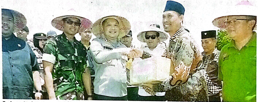
Forkopimda Pasuruan bersama Polres Pasuruan menyerahkan bantuan bibit jagung kepada Gapoktan Desa Karangsono.

Kegiatan diawali dengan pembukaan, doa, dan