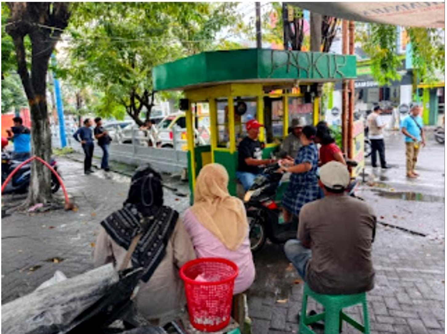
Titik parkir di depan Pasar Krian.

Monday, February 13, 2023, February 13, 2023 WIB