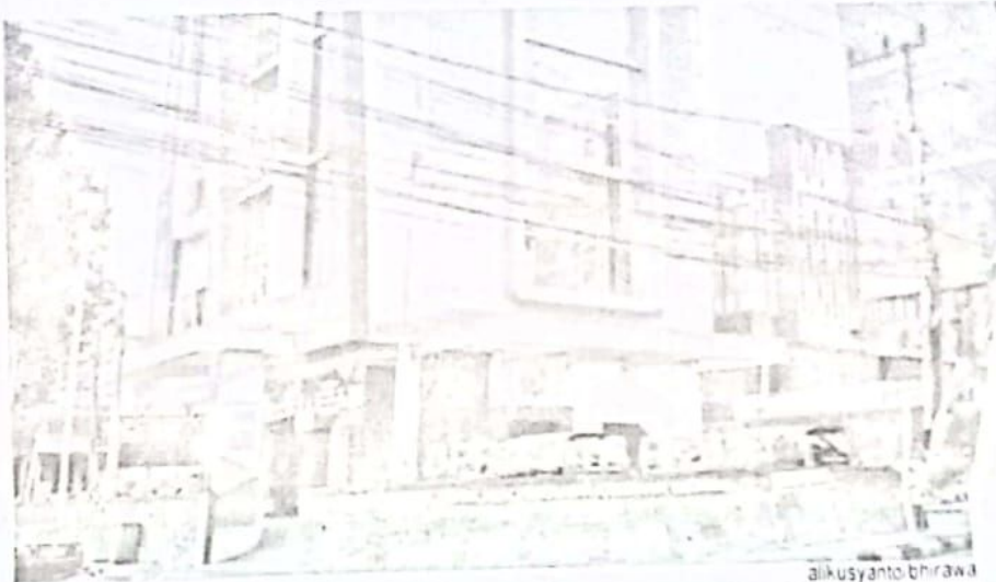
Gedung Kantor BPR Delta Artha Sidoarjo, yang berada di jalan A.Yani No.16 Sidoarjo

DEWAN PERWAKILAN RAKYAT DAERAH KABUPATEN SIDOARJO