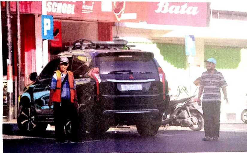
MASIH BOLEH: Salah satu titik parkir yang dikelola oleh PT ISS.

KOTA-Polemik sistem parkir di Sidoarjo hingga saat ini masih bergulir. Sebelumnya, sudah dilakukan mediasi antara PT ISS dan Tim Koordinasi Kerjasama Daerah (TKKSD) Kabupaten Sidoarjo. Dalam waktu dekat, Komisi B DPRD Sidoarjo juga akan memanggil keduanya dalam rapat dengar pendapat.