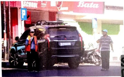
MASIH BOLEH: Salah satu titik parkir yang dikelola oleh PT ISS.