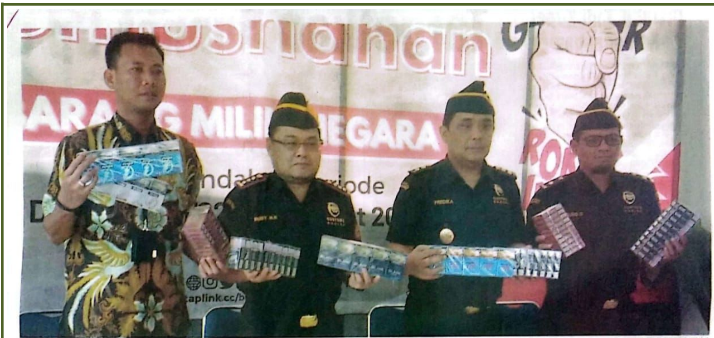
DIPAMERKAN: Kantor Pengawasan dan Pelayanan Bea Cukai (KPPBC) Tipe Madya Pabean B Sidoarjo memusnahkan 794 ribu batang rokok ilegal.

DEWAN PERWAKILAN RAKYAT DAERAH KABUPATEN SIDOARJO