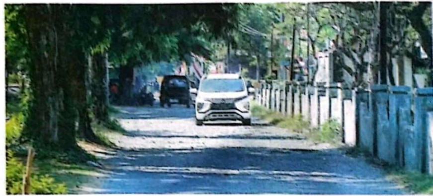
SEGERA TERHUBUNG: Pengendara melintas di Jalan Letjen S. Parman, Waru, yang akan digunakan sebagai frontage road kemarin.