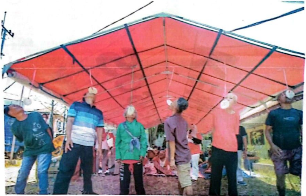
BANGKITKAN INGATAN: Penghuni dan pegawai liponsos mengikuti lomba makan kerupuk dalam peringatan HUT Ke-78 RI kemarin.

Menurut dia, penting membangun ingatan dan kesadaran para penghuni, terutama para ODGJ. Misbach menyebut hampir seluruh penghuni pernah mengikuti lomba peringatan Agustusan sebelumnya. "Jadi, kami ingin membangun