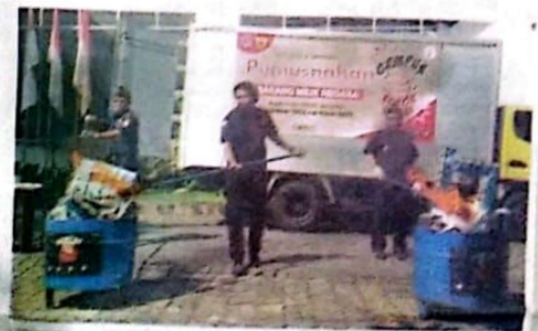
MELANGGAR ATURAN: Rokok ilegal dibakar untuk dimusnahkan.