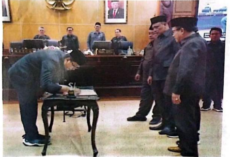
SAM: Eksekutif dan legislatif menandatangani nota kesepakatan bersama terhadap rancangan perubahan KUA-PPAS tahun anggaran 2023.