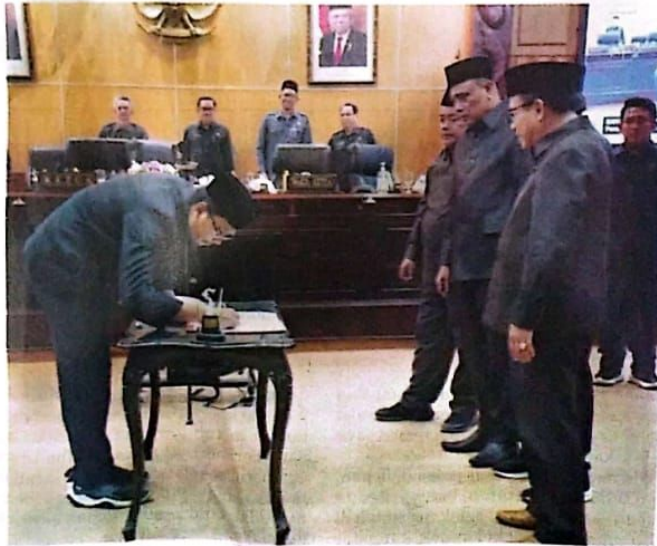
SAH: Eksekutif dan legislatif menandatangani nota kesepakatan bersama terhadap rancangan perubahan KUA-PPAS tahun anggaran 2023.