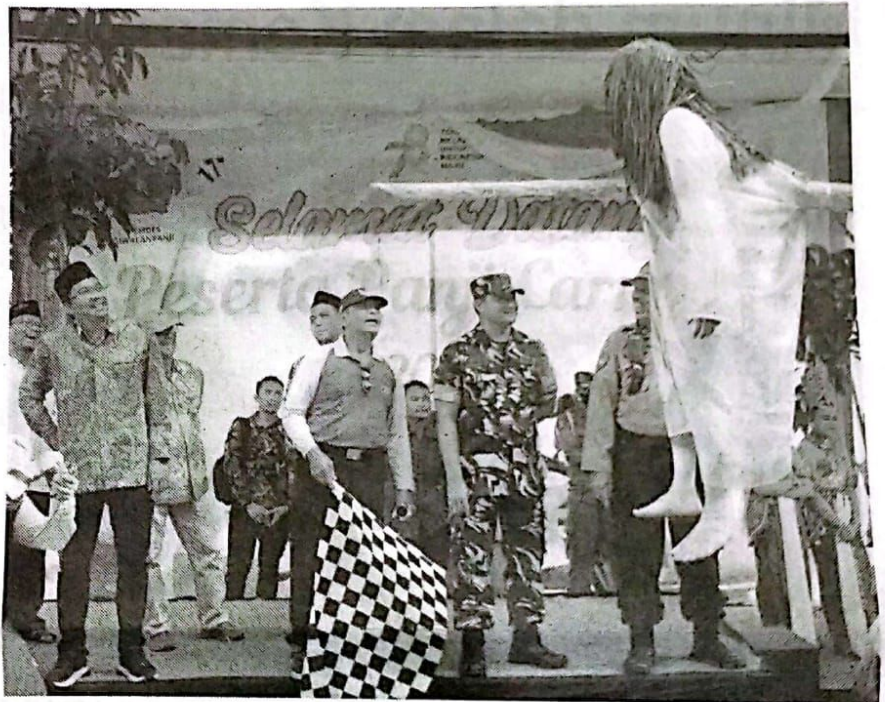
BERANGKATKAN - Bupati Sidoarjo Ahmad Muhdlor Ali saat memberangkatkan peserta Panji Carnival yang digelar di Desa Siwalanpanji, Kecamatan Buduran, Sidoarjo, Minggu (27/08/2023).

Selain itu, Bupati alumni Fisip Unair Surabaya ini menambah-