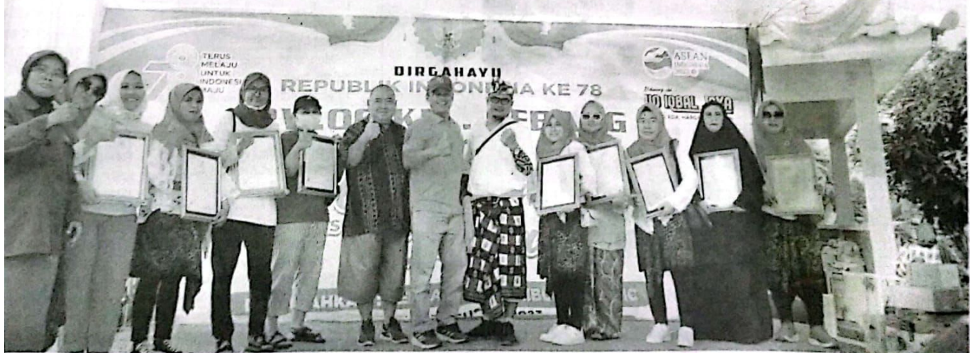
SERTIFIKAT HALAL: Warga Perum Gebang Raya Kelurahan Gebang penerima Sertifikat Halal yang diserahkan pada acara pe peringatan HUT RI ke 78 dan Kepala Kelurahan Gebang Kecamatan Sidoarjo Kota Sayudi SH (fan)

Sementara itu, pejabat Dinas Koperasi dan UKM Propinsi Jatim Erna menyatakan, hingga hari ini sudah ratusan UMKM Sidoarjo mendapatkan sertifikat halal. Pemerintah terus memfasilitasi UMKM untuk mendapat legalitas usahanya. Mulai NIB, IRT hingga sertifikat halal. "Hingga hari ini secara nasional sudah diserahkan 1,2 juta sertifikat halal dan yang 600 ribu berasal dari Jatim," tutupnya. (fan/ono)