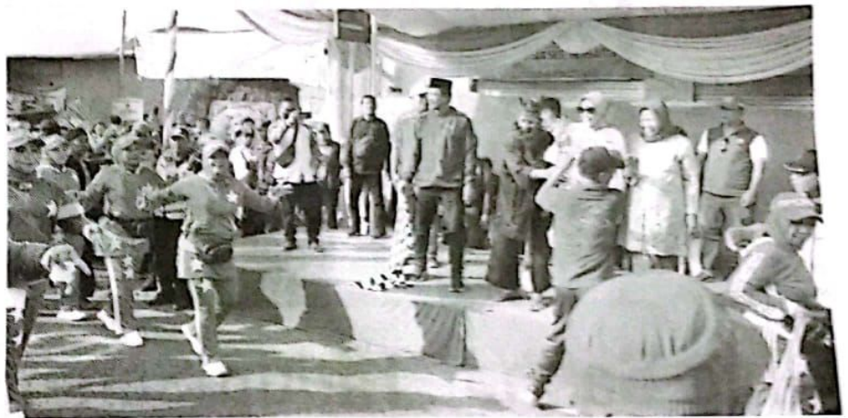
BERANGKATKAN - Bupati Sidoarjo Ahmad Muhdlor Ali memberangkatkan acara jalan sehat dan lomba kostum Desa Sugihwaras, Kecamatan Candi, Sidoarjo, Minggu (27/08/2023).

“Guyub dan rukun harus selalu hadir di tengah-tengah masyarakat. Dengan begitu akan