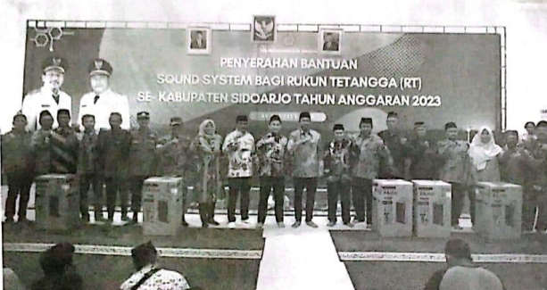
Bupati Sidoarjo Ahmad Muhdlor Ali menyerahkan bantuan sound system secara simbolis kepada perwakilan Desa Kecamatan Gedangan.

Program bantuan sound system ini ditujukan kepada masyarakat Sidoarjo agar terjalin hubungan yang baik antara masyarakat dan Pemerintahan Kabupaten (Pemkab) Sidoarjo. Gus Muhdlor, sapaan akrab bupati mengatakan selain