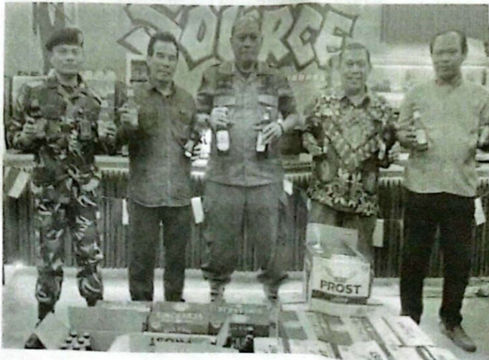
Petugas menunjukkan miras ilegal yang disita dalam razia pada Jumat malam kemarin.