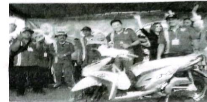
Wabup Sidoarjo Subandi dalam sebuah acara peringatan HUT Kemerdekaan RI ke-78 di Sedati.