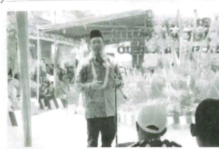
Bupati Sidoarjo Ahmad Muhdlor meresmikan BUMDes Sumber Makmur di Desa Sumberejo, Kecamatan Wonoayu.

"Ini menjadi alasan kenapa Sidoarjo bisa memiliki banyak tambak seperti tambak ikan bandeng atau tambak udang yang menjadi iconnya. Selain itu letak geografisnya, berada diantara 2 sungai besar pecahan dari Sungai Brantas yaitu Sungai Mas dan Sungai Porong," jelasnya.