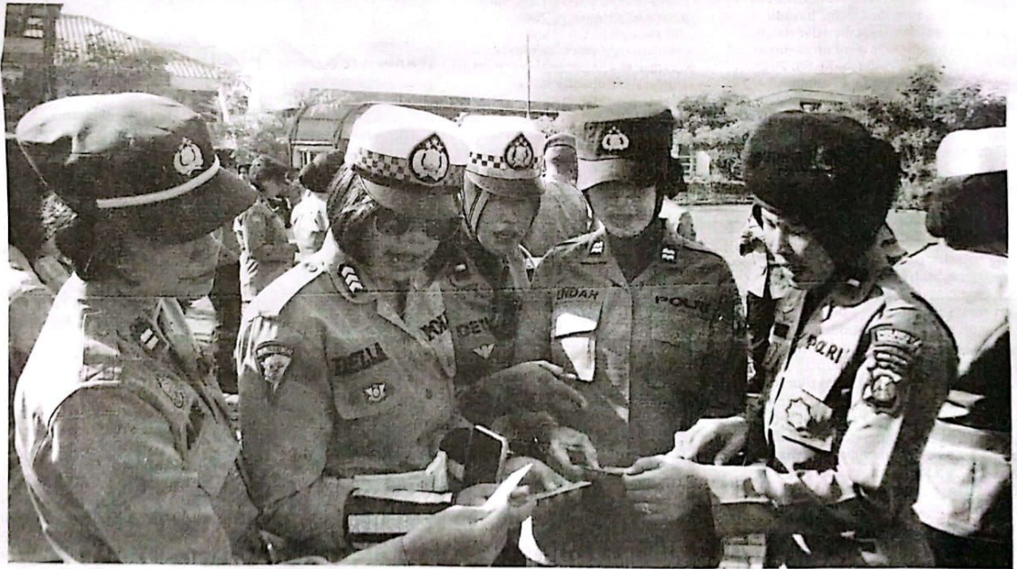
Gaktiblin anggota Polresta Sidoarjo Senin (28/8/23)

"Anggota Polwan Polresta Sidoarjo diharapkan dapat disiplin dan patuh aturan kedisiplinan. Sehingga dapat menunjang pelayanan terbaik saat hadir di tengah masyarakat," jelasnya. ●Loe