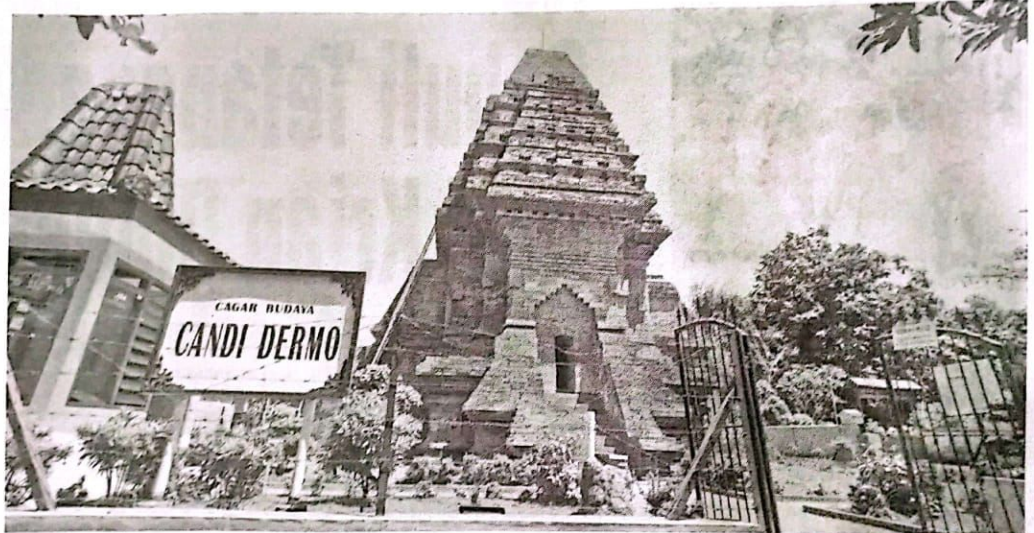
JADI JUJUKAN: Candi Dermo berlokasi di Desa Candinegoro, Kecamatan Wonoayu terlihat megah.

Hingga saat ini, imbuh Ghozali, Candi Dermo masih digunakan untuk ritual oleh masyarakat. Kendati menjadi tempat yang diagungkan, Candi Dermo juga menjadi salah satu cagar budaya yang banyak dikunjungi. Sebanyak 200 orang