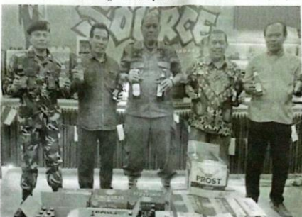
Petugas menuntun miras ilegal yang disita dalam razia pada Jumat malam kemarin.

Sementara itu Satpol PP Sidoarjo demi meningkatkan Perda di Sidoarjo rutin melakukan operasi ketertiban di tengah masyarakat di antaranya dengan razia peredaran miras ilegal. "Kita secara rutin melakukan razia demi menjaga dan menciptakan kondisi yang aman di tengah masyarakat sesuai laporan dan regulator yang ada" ujar Yani Setiawan, pejabat Satpol PP Sidoarjo.