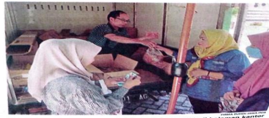
HARGA STABIL: Warga membeli kebutuhan pokok di halaman kantor Kecamatan Gedangan kemarin (10/12).

Menurut dia, hal tersebut dilakukan bersama Forkopimka Balongbendo dan warga setempat. Sugeng mengatakan, bibit tanaman yang dibagikan, yaitu cabai dan terong serta sejumlah karung pupuk. "Nanti akan dilakukan penanaman serentak setelah distribusi. Proses ini akan dipimpin oleh para bhabin kamtibmas yang berperan sebagai penggerak ketahanan pangan," paparnya. (eza/fal)