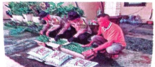
KETAHANAN PANGAN: Kardus-kardus berisi bibit cabai dan terong serta pupuk yang akan dibagikan bhabin kamtibmas.