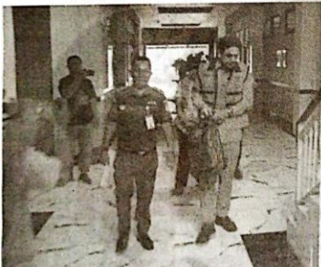
Petugas kejaksaan mengamankan tersangka dugaan korupsi.

Rencananya, operasi pasar murah bakal terus digelar menjelang Nataru. Hari ini (11/12), kegiatan pasar tani dilakukan di kantor Dinas Pangan dan Pertanian. (uzi/fal)