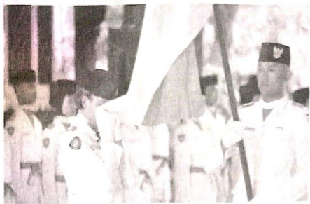
Bupati Sidoarjo, Gus Muhdlor saat kukuhkan Paskibraka Sidoarjo