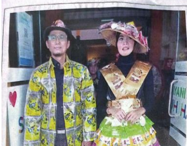
Pasangan pegawai ASN dari Dinas Perikanan Sidoarjo memamerkan produk fashion UMKM Sidoarjo, yang lahir dari bahan limbah ikan.

Dia mengungkapkan, di sisa waktu yang ada Deltras akan memaksimalkan latihan dan strategi tim yang sudah disiapkan. "Kami butuh doa dan dukungan Deltamania," ucapnya.