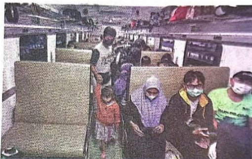
ATURAN BARU: Penumpang duduk di dalam rangkaian gerbong KA Penataran di Stasiun Sidoarjo kemarin. PT Kereta Api Indonesia (KAI) memberlakukan syarat baru bagi calon penumpang kereta api jarak jauh.

Pada masa transisi aturan baru, sejak kemarin hingga