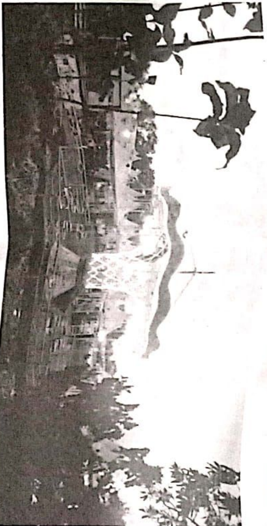
Gebyar UMKM di Lapangan Waruberon disambut antusias Warga

DEWAN PERWAKILAN RAKYAT SIDOARJO KABUPATEN SIDOARJO