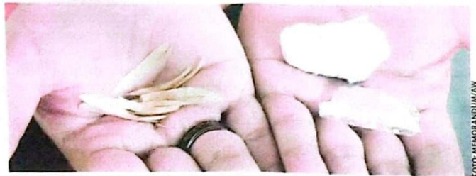
Jimat yang ditemukan petugas tes CASN.

Untuk diketahui setiap harinya pelaksanaan SKD Kemenkumham di