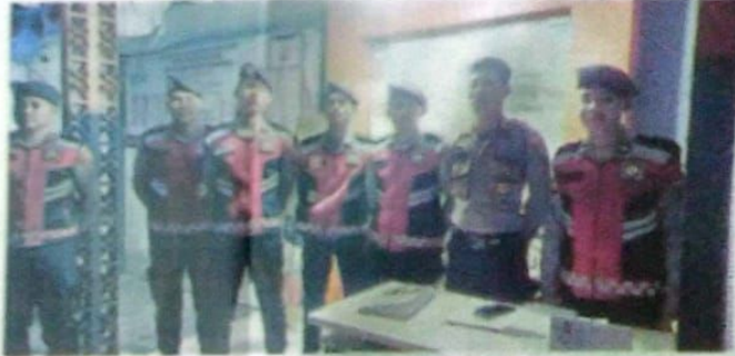
Anggota Satuan Samsapta Polresta Sidoarjo berjaga di kantor Bawaslu.

"Keberadaan anggota Satsamapta di pos pengamanan ini adalah bentuk nyata dari upaya