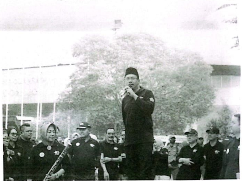
Bupati saat berangkatkan jalan sehat HKN.