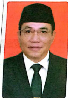
USMAN Ketua DPRD Sidoarjo