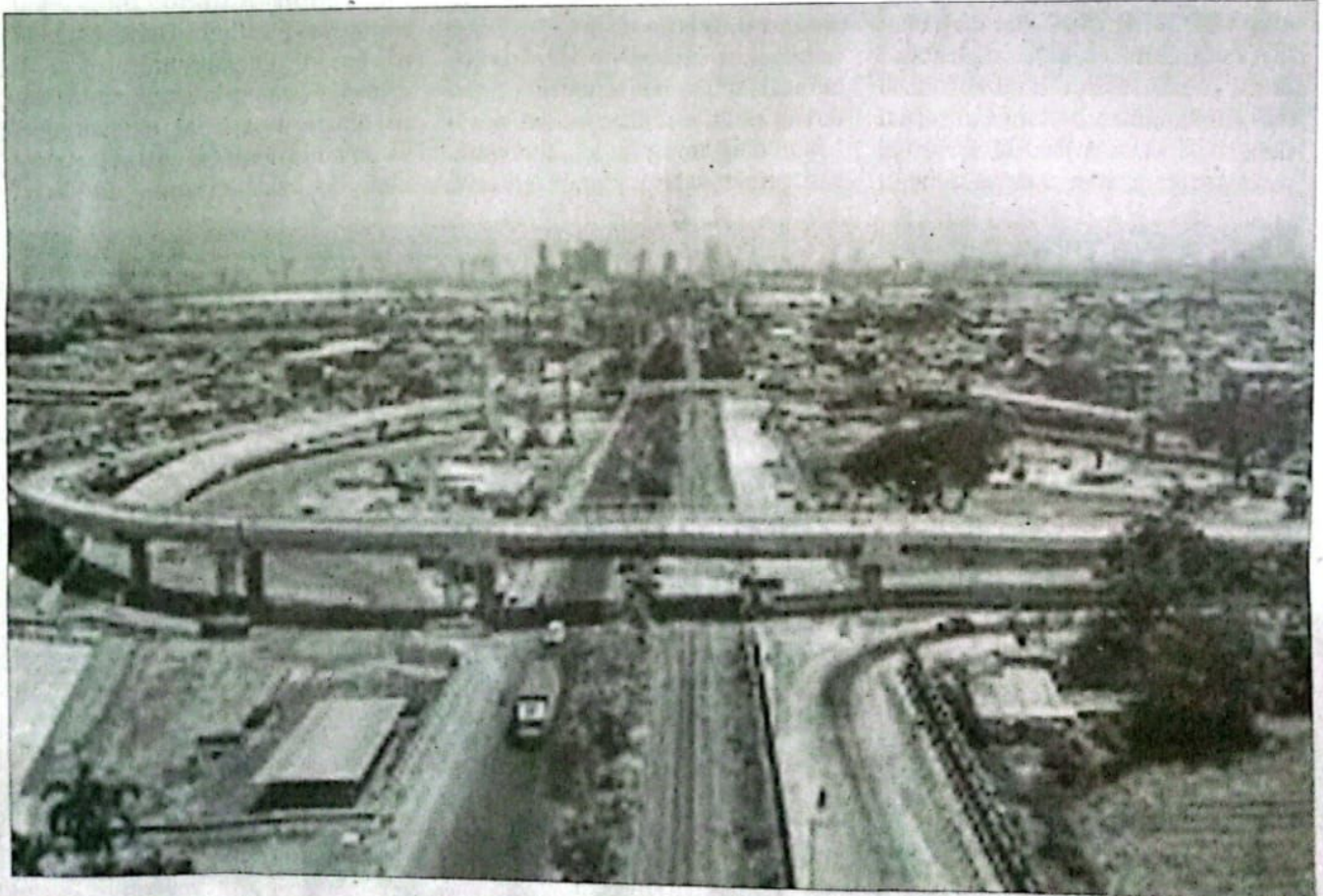
UJI COBA: Flyover Aloha di Gedangan, Sidoarjo, siap diuji coba saat libur Natal dan Tahun Baru (Nataru) 2024 mendatang

"Kami berharap dengan uji coba ini, kami dapat mengidentifikasi dan mengatasi setiap potensi masalah yang mungkin muncul, sehingga proyek ini dapat memberikan manfaat yang maksimal bagi masyarakat setempat," pungkasnya. (udi)