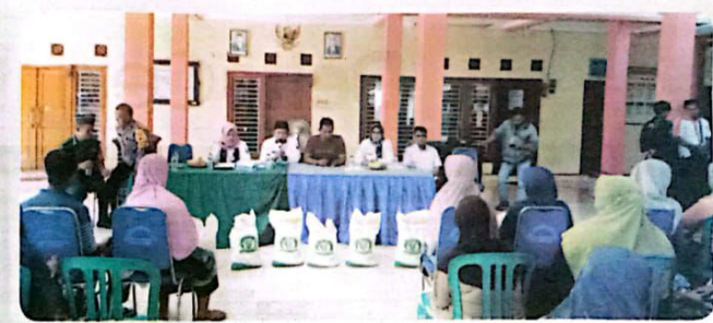
DILANJUTKAN: Pemberian bantuan sosial kepada masyarakat yang membutuhkan

dalam upaya meningkatkan kesejahteraan masyarakat Kabupaten Sidoarjo. Ketua DPRD Sidoarjo Usman mengatakan, beberapa program untuk masyarakat sudah dijalankan oleh Pemkab Sidoarjo. Termasuk bantuan beras, bedah rumah maupun juga berbagai pelatihan kerja. Dia menilai program pengentasan dan penanggulangan kemiskinan yang sudah dijalankan sudah baik. "Sehingga tahun depan hanya perlu ditingkatkan saja, agar kesejahteraan masyarakat bisa merata dan masyarakat miskin berkurang,"ujarnya. Keterlibatan Pemerintah Desa dan Kecamatan serta peran