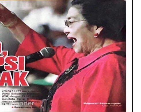
Melaksanakan Rapat Kerja Partai Solidaritas Indonesia (PSI) dengan 39 peserta melebihi Partai Gerindra dengan perolehan sebanyak 184.732 suara. ● Bersambung Hal 11

Jakarta, Pajok Kiri - Komisi Pemilihan Umum (KPU) Solo dalam memantapkan hasil Pemilihan Umum Anggota DPRD Tingkat Kota, Kabupaten dan Kecamatan di Indonesia Perjuangan (PDIP) menjadi partai dengan perolehan suara terbanyak untuk pemilihan legislatif (pileg) dengan jumlah sebanyak 143.433 suara.