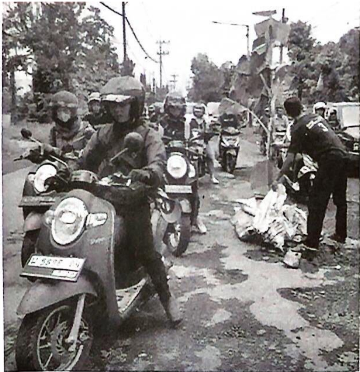
Pohon pisang ditanam warga di tengah jalan Kletek Sidoarjo yang berlubang.