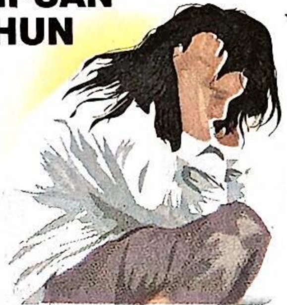
GRAFIS: BAGUS/JAWA POS

JUMLAH korban kekerasan terhadap perempuan naik pada 2022. Sementara itu, pada 2023 kasus tersebut mengalami penurunan, tapi tidak signifikan. Sebagian besar perempuan melaporkan tindakan kekerasan dalam rumah tangga (KDRT). (e2a/c7/any)