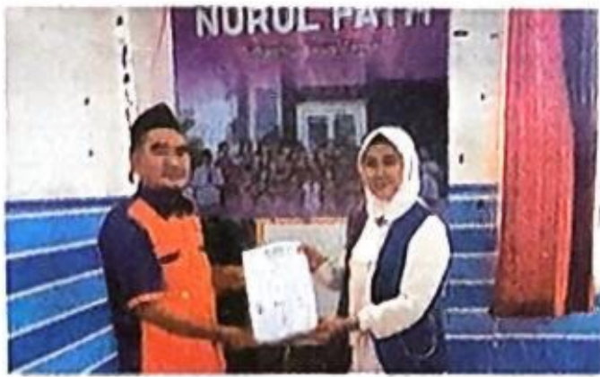
KURIA, M. S. / SURYA

"Ada 11 yayasan atau panti asuhan dari 11 Kecamatan di Kabupaten dengan total anak-anak 371 yang kita tuju. Mereka bisa kumpang kemudian kita berikan santunan berupa dana dan sembako," kata Ketua DPC Iwapi