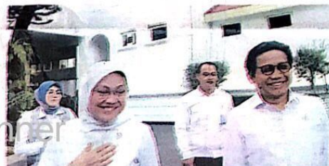
MENGENAL JOKOWI, Menteri Ketenagakerjaan yang juga Wakil Ketua Umum DPP PKB Ida Fauziyah dan Mendes PDTT yang juga Ketua DPP PKB Jawa Timur Abdul Halim Iskandar di Istana Kepresidenan Jakarta, Senin (18/3/2024). Mereka melaporkan pekerjaan sekaligus 'pecah telur' PKB di Pileg 2024.

melaporkan hal yang sama," kata Abdul Halim usai pertemuan, kemarin. Selain melaporkan capaian kinerja, Abdul Halim dan Ida juga menyampaikan terima kasih kepada Jokowi karena