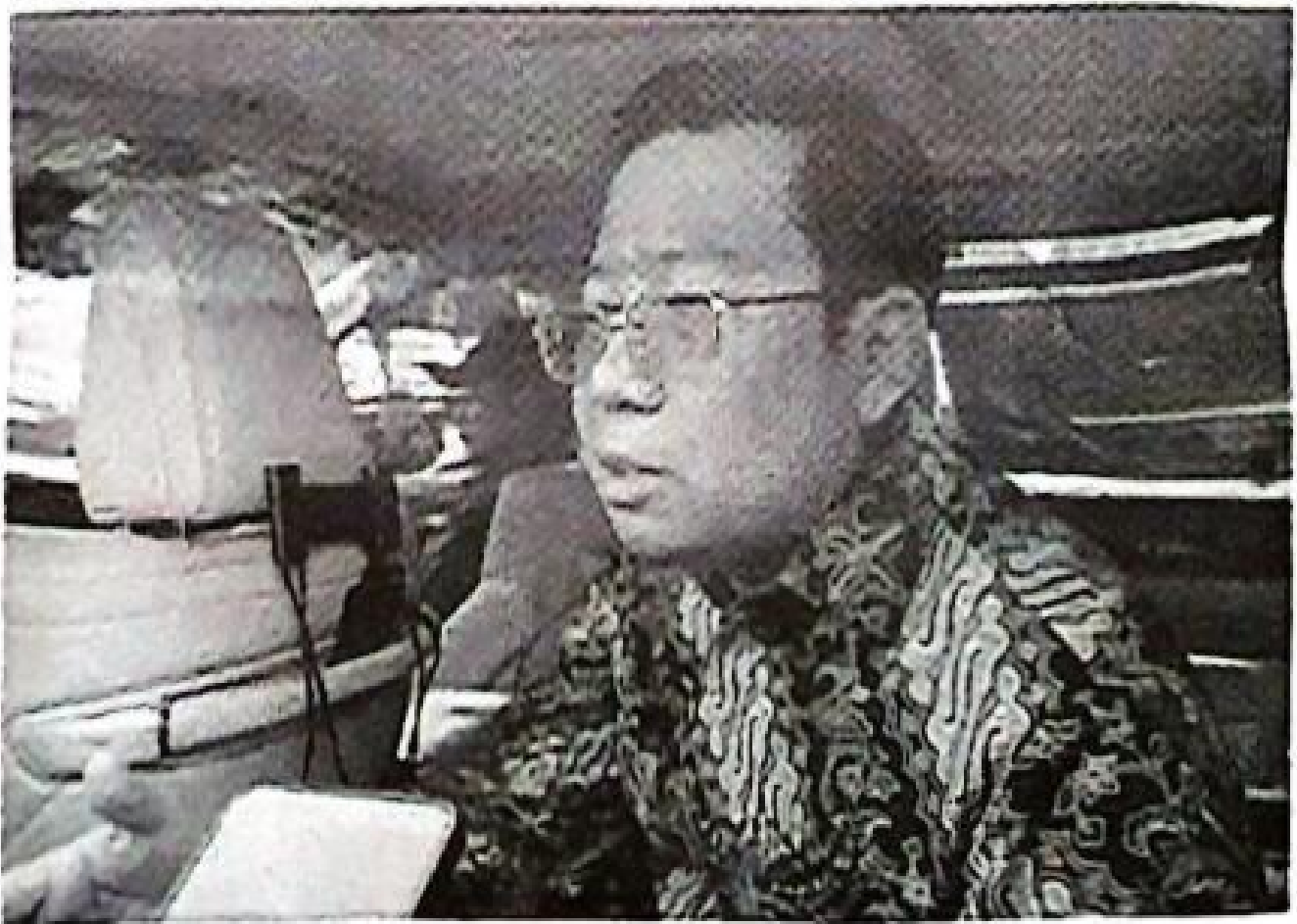
Kepala Badan Pangan Nasional Arief Prasetyo Adi.

"Satu rumah tangga bisa 3-4 orang. Jadi maksud saya itu sudah (diantisipasi). Kemudian, Gerakan Pangan Murah, Pak (Menteri Dalam Negeri) Tito (Karnavian) dan semua pemerintah daerah melakukan ya," ujarnya. (ant/ns)