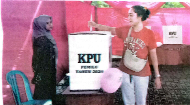
PARTISIPASI: Coblosan ulang di TPS 05 Desa Durung Banjar, Kecamatan Candi pada 22 Februari lalu.