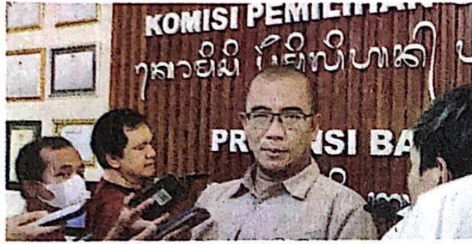
Ketua Komisi Pemilihan Umum (KPU) RI, Hasyim Asy'ari

Ketua KPU RI Hasyim Asy'ari menjelaskan, terdapat lima provinsi ter-