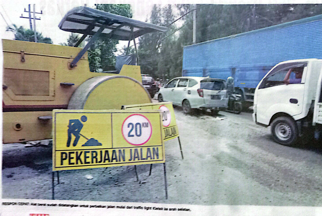
RESPON DPRD: alat berat sudah didatangkan untuk perbaikan jalan mulai dari traffic light Kletek ke arah selatan.