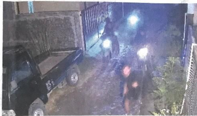
KABUR: Tangkapan layar rekaman CCTV yang menunjukkan dua kelompok perusuh lari saat dikejar warga Desa Bohar, Taman.

Mistur mengungkapkan, pelaku diamankan warga Bohar dan digiring ke balai desa sekitar pukul 03.00. Diketahui, awalnya ada kelompok geng balap liar yang balapan di sekitar Dusun Legok, Desa Suko, Sukodono. Pada saat bersamaan, kelompok