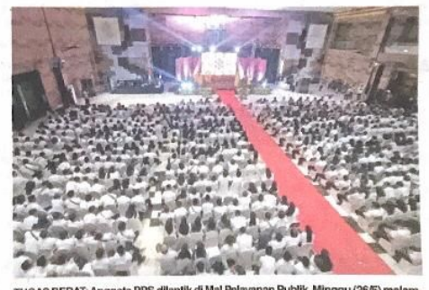
TUGAS BERAT: Anggota PPS dilantik di Mal Pelayanan Publik, Minggu (26/5) malam.

"Semoga amanah yang diemban ini dapat ditunai dengan sebaik-baiknya, sehingga Pemilu 2024 ini dapat menghasilkan pemimpin yang terbaik untuk negeri ini, baik di jajaran eksekutif maupun legislatif," pungkasnya. (sa/vga)