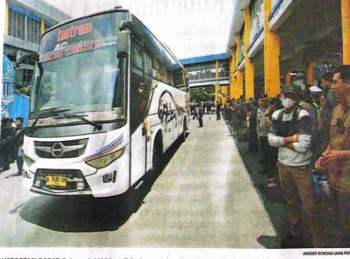
TRANSPORTASI DARAT: Sebanyak 100 bus disiapkan untuk melayani pemudik di Terminal Purabaya.

Siabudi meminta pengerjaan dilakukan dengan kerjasama ber-bagi pihak agar bisa cepat selesai.