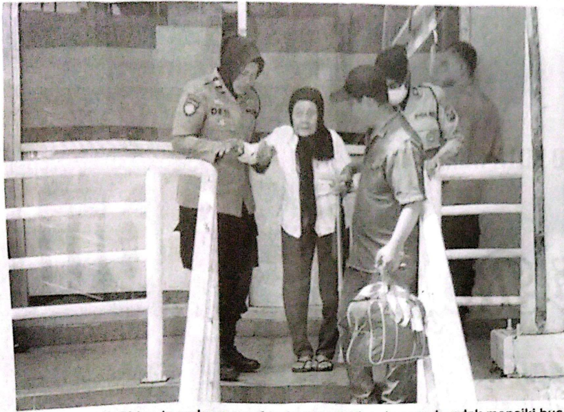
Polwan Polresta Sidoarjo sedang membantu seorang lansia yang hendak menaiki bus yang dituju di Terminal Purabaya.