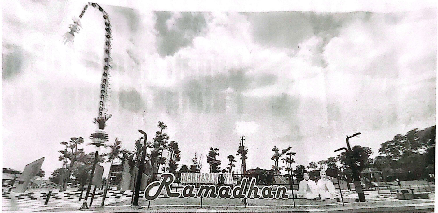
INDAH: Suasana Alun-alun Sidoarjo yang menjadi salah satu ruang terbuka hijau favorit masyarakat.