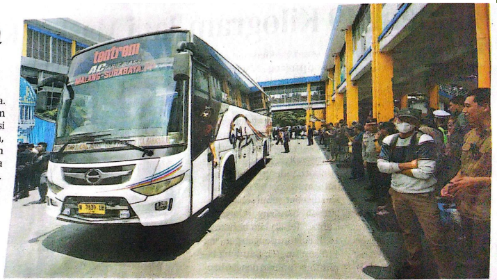
TRANSPORTASI DARAT: Sebanyak 1.100 bus disiapkan untuk melayani pemudik di Terminal Purabaya.

siapkan cadangannya," ujarnya. Penambahan armada kebanyakan untuk bus Antar Kota Dalam Provinsi (AKDP), seperti jurusan Madiun, Trenggalek, Jombang, Kediri, dan sejumlah kota di Pulau Madura seperti Sampang dan Pamekasan. Untuk memastikan kesiapan armada, petugas juga melakukan inspeksi keselamatan atau ramp check terhadap bus reguler. "Sejumlah sopir dan kru bus juga dilakukan pengecekan kesehatan agar keselamatan para pemudik juga terjaga," pungkas Verie. (eza/hen)