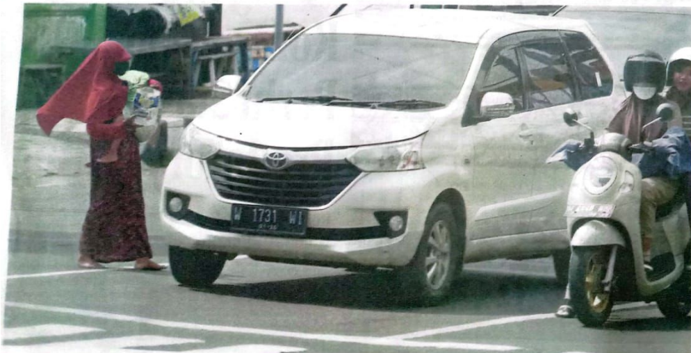
MAJORITYS PENDATANG: Pengemis terlihat di jalan utama dan perempatan di pusat Kota Delta kemarin (17/3).

SIDOARJO - Selama Ramadan, pengemis dan gelandangan semakin banyak terlihat di Sidoarjo. Terutama di sekitar alun-alun. Mayoritas bukan warga Sidoarjo.