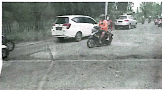
BUTUH PERBAIKAN: Kondisi Jalan Raya Sawunggaling di Kletek rusak. Banyak lubang dan aspal yang mengelupas.

Menurut dia, perbaikan jalan itu tidak cukup jika