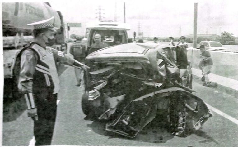
TSP: Petugas Unit PJR II Ditlantas Polda Jatim menunjukkan lokasi dan Porsche yang menabrak kendaraan Grand Livina kemarin (17/3).