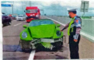
WUSAK: Petugas Unit PJR II Ditlantas Polda Jatim mengecek kondisi mobil Porsche 91 Carrera hijau yang ringsek pasca menabrak Grand Livina di tol Porong-Sidoarjo kemarin (17/3).

Insiden Porsche Tabrak Grand Livina di Tol Porong-Sidoarjo