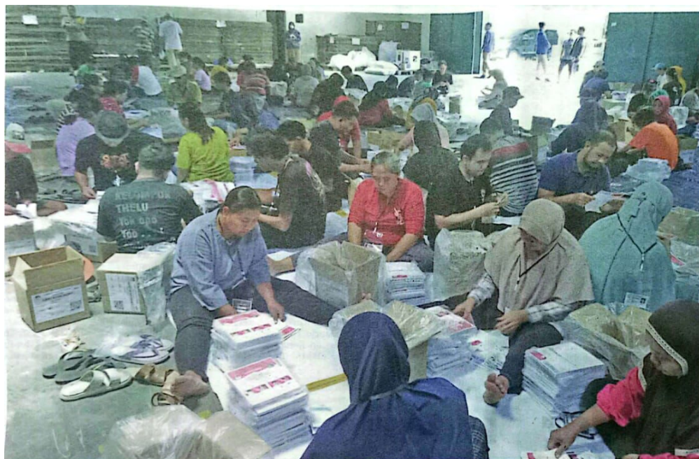
PILKADA: Para pekerja saat melipat surat suara di gudang KPU Sidoarjo Jalan Erlangga.