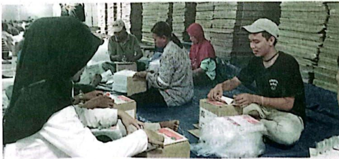
MASSAL: Proses sortir dan lipat suara di gudang KPU Sidoarjo di Jalan Erlangga kemarin (29/10) melibatkan 200 pekerja.

Komisioner Bawaslu Sidoarjo Fathur Rohman mengatakan bahwa berdasar tinjauannya, belum ada temuan surat yang harus diganti. "Hari ini (kemarin, Red) belum ada temuan. Besok (hari ini, Red) kami pantau lagi ke lokasi," pungkasnya. (uzi/ris)