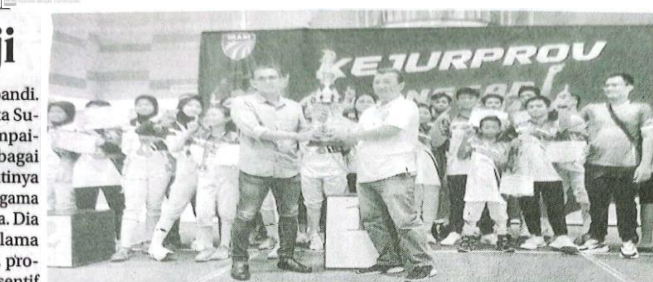
Athlet Anggar Sidoarjo menerima piala, berhasil menjadi juara umum Kejurprov Jatim 2024.