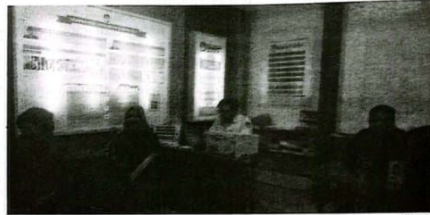
KPU Sidoarjo saat melayani warga pindah memilih untuk Pilkada 2024 Senin malam (28/10/24) menjelang penutupan pendaftaran.

kan sosialisasi pelayanan pindah pilih (pindah memilih) melalui media sosial, web site resmi KPU Sidoarjo, Media Masa dan pertemuan tatap muka. Adapun syarat utama pengajuan pindah memilih adalah sudah tercantum dalam Daftar Pemilih Tetap (DPT). Pemilih dapat mengecek melalui laman cekdptonline.kpu.go.id, jika belum tercantum, pemilih dapat mendaftar ke dalam Daftar Pemilih Khusus terlebih dahulu.