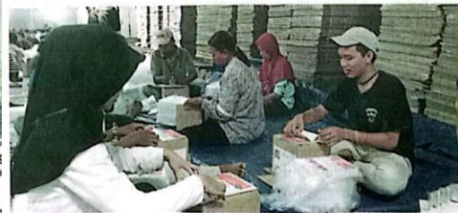
MASSAL: Proses sortir dan lipat suara di gudang KPU Sidoarjo di Jalan Erlangga kemarin (29/10) melibatkan 200 pekerja.

Komitmen itu, kata Subandi, sudah disampai-kannya dalam berbagai kegiatan yang diikutinya bersama para guru agama maupun guru swasta. Dia menambahkan, selama menjadi Plt bupati, program pemberian insentif bagi guru ngaji sudah dijalankan dengan nilai sekitar Rp 350 ribu setiap bulan. Pihaknya berkomitmen tahun depan jumlah penerima insentif akan terus ditambah dan nilainya dinaikkan. (uzi/ris)