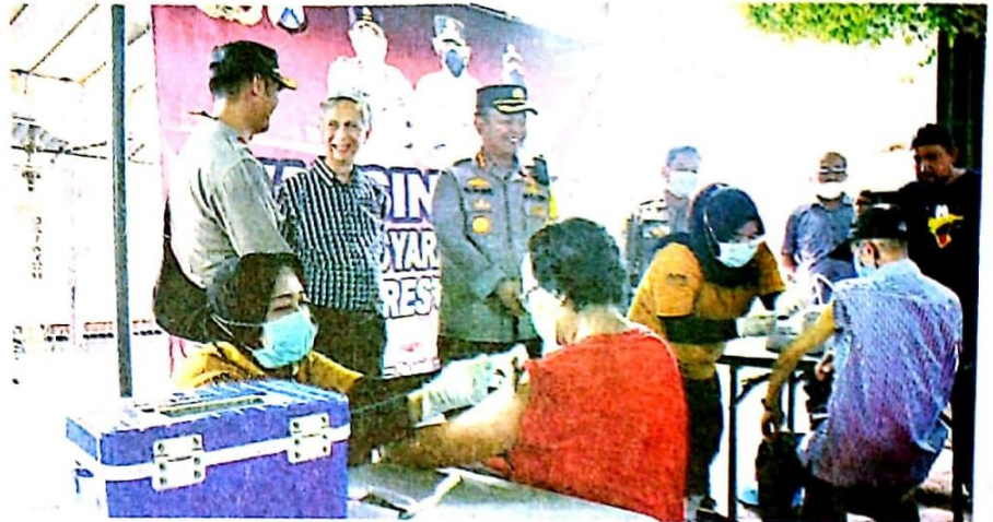
Kapolresta Sidoarjo Kombespol Kusumo Wahyu Bintoro memantau vaksinasi di Gereja Elohim agar ibadah jemaat berlangsung lancar dan sehat.

"Covid-19 masih ada, di saat ibadah Natal, kami berharap jangan lengah. Tetap patuhi protokol kesehatan (prokes) dan bagi yang belum vaksinasi dosis kedua maupun ketiga silakan melakukan di layanan yang telah kami sediakan," tutur kapolresta.