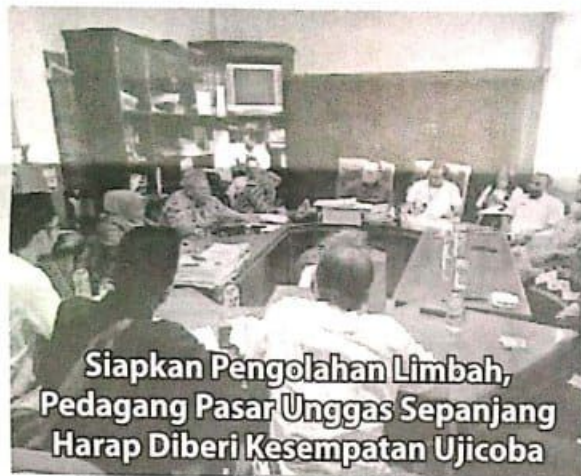
Siapkan Pengolahan Limbah, Pedagang Pasar Unggas Sepanjang Harap Diberi Kesempatan Ujicoba