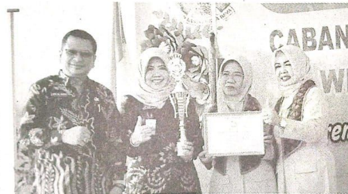
Kacabdin Dindik Jatim Wil Sidoarjo-Surabaya, Kepala SMKN 2 Buduran foto bersama usai penyerahan piala.

Prosesi penyerahan penghargaan diberikan istri Kepala Cabang Dinas Pendidikan Jawa Timur