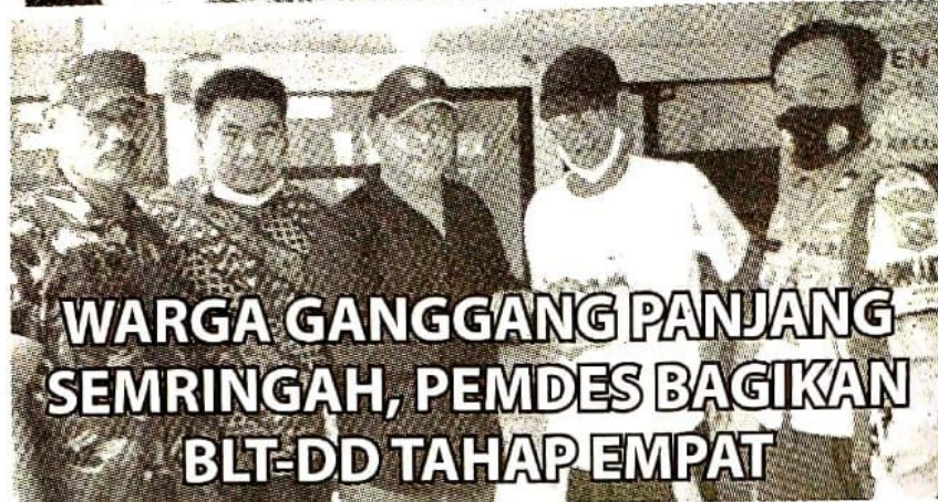
Pemdes Ganggang Panjang Cairkan BLT-DD Tahap 4