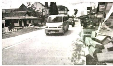
Jalan beton sepanjang 5,4 km yang dibancki warga 5 desa.

Tujuannya untuk koordinasi memberikan CSR dengan