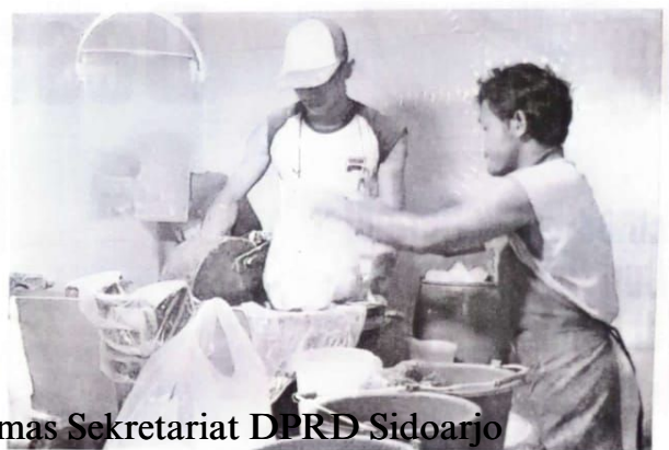
RAMAI: Proses penggilingan daging untuk adonan bakso.

"Nantinya dia akan masak dan santap bakso buat makan bersama keluarga di rumah," pungkasnya. (sai/nis)