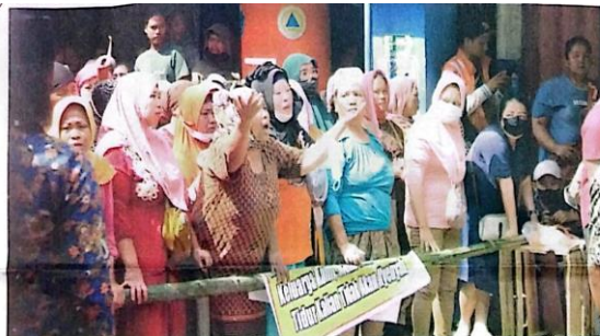
LANTANG: Sejumlah Pedagang Pasar Larangan saat menjadi pagar hidup menghadang Satpol PP.