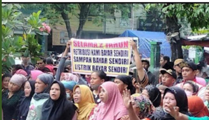
Emak-emak PKL Pasar Larangan pasang badan menjadi barikade saat akan dilakukan eksekusi oleh Satpol PP.

Monday, January 9, 2023, January 09, 2023 WIB