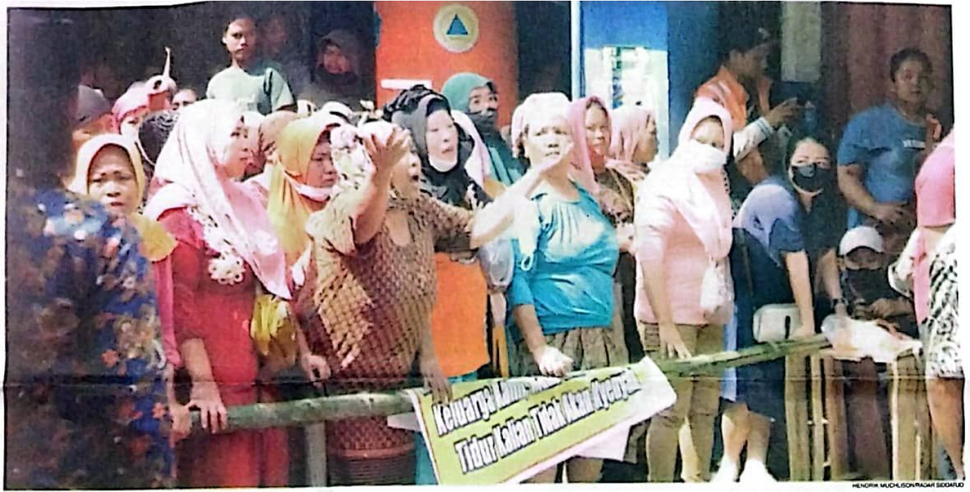
LANTANG: Sejumlah Pedagang Pasar Larangan saat menjadi pagar hidup menghadang Satpol PP.