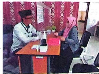
LAYANAN: Salah satu warga saat mencari informasi soal haji di kantor Kemenag Sidoarjo.