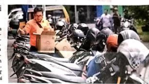
CUKUP SAMPAI DI SINI: Sejumlah kendaraan roda dua terparkir di kawasan Pasar Larangan, Sidoarjo, kemarin (9/1). Dinas Perhubungan (Dishub) Sidoarjo memuatkan surat ke kerja sama parkir dengan pihak swasta.

SIDOARJO - PT Indonesia Sarana Service-Kerja Sama Operasi (ISS-KSO) yang menjadi pihak ketiga pengelola parkir di Sidoarjo menyanggah pemutusan perjanjian kerja sama (PKS) yang dilakukan Dinas Perhubungan (Dishub) Sidoarjo. Kemarin (9/1) mereka melayangkan surat balasan ke Dishub Sidoarjo. Isinya, PT ISS tetap akan mengelola parkir sesuai PKS antara Dishub dan PT ISS.