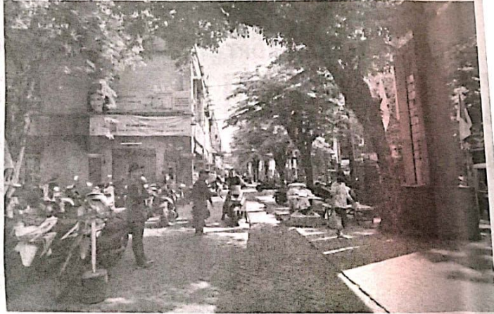
Pasar Larangan setelah ditertibkan terlihat lebih bersih dan asri.

"Pengunjung akan lebih suka dan senang berbelanja di pasar, maka perekonomian akan bergerak dan dagangan akan lebih laris," pungkasnya. (yud/jok/mik)