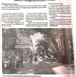
Pasar Larangan di sisi Timur Sidoarjo