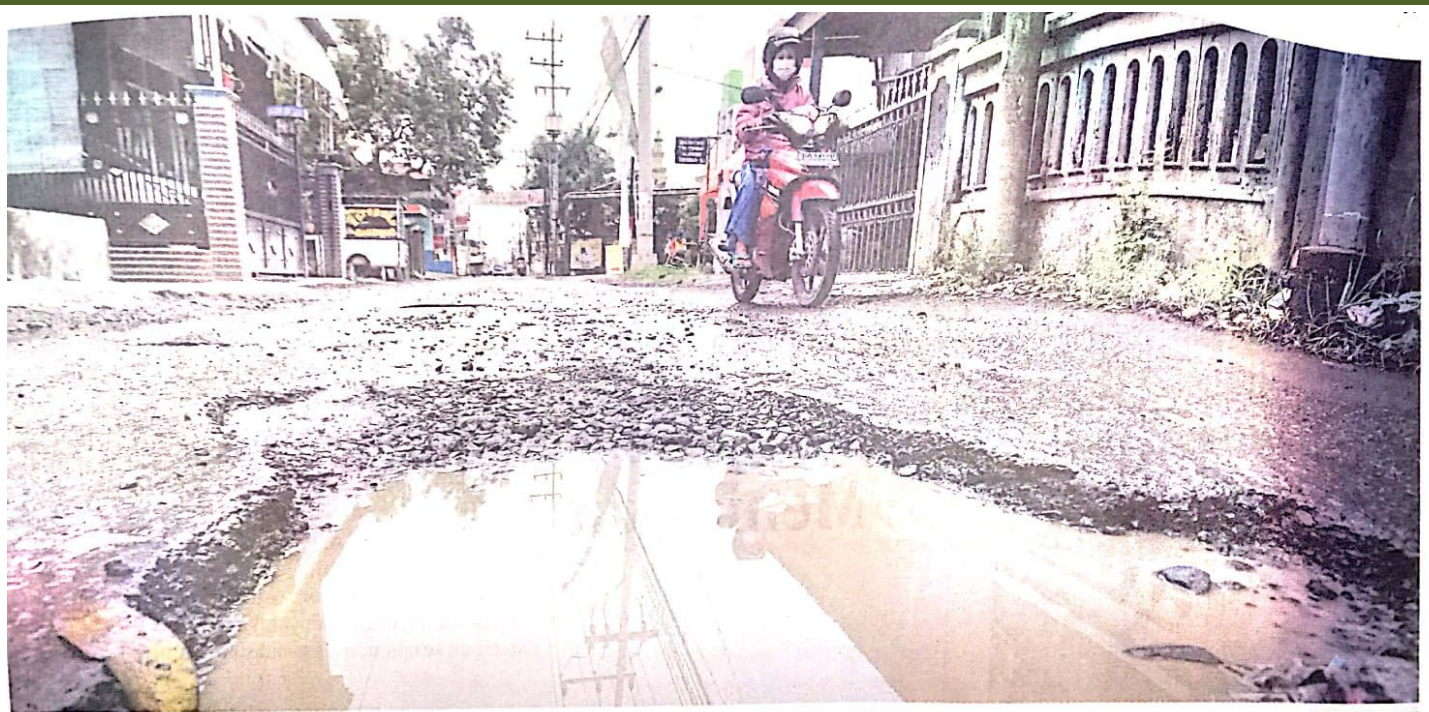
BAHAYAKAN PENGGUNA JALAN: Pengendara menghindari lubang di Jalan Raya Keling, Desa Jumputrejo, Kecamatan Sukodono, kemarin (7/2).

DEWAN PERWAKILAN RAKYAT DAERAH KABUPATEN SIDOARJO