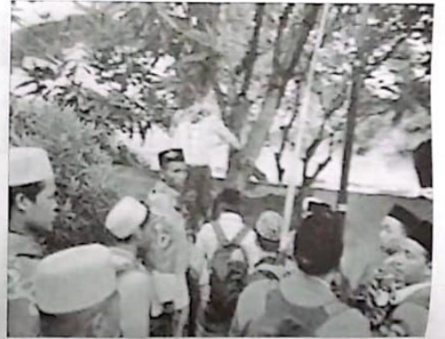
NAIK PAGAR Sebagian peserta peringatan seabad Nahdlatul Ulama (NU) di Stadion Gelora Delta Sidoarjo nekad naik pagar setinggi dua meter untuk masuk ke dalam kompleks stadion.

Dalam puncak resepsi seabad NU dihadiri oleh sejumlah menteri kabinet seperti Luhut Panjaitan, Prabowo Subianto, Sandiaga Uno, Ida Fauziyah. Hadir dalam kesempatan itu, Kapolri dan juga Gubernur Jawa Timur Khofifah Indar Parawansa bersama dengan Wakil Gubernur Jawa Timur Email Dardak. (udj)