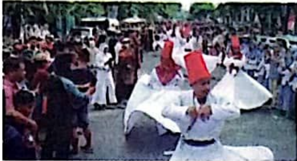
MENGHIBUR: Tarian Sufi di Karnaval Budaya Nusantara.