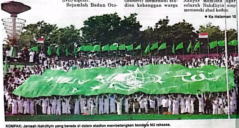
KOMPAS: Jamaah Nahdliyin yang berada di dalam stadion membetangkan bendera NU raksasa.