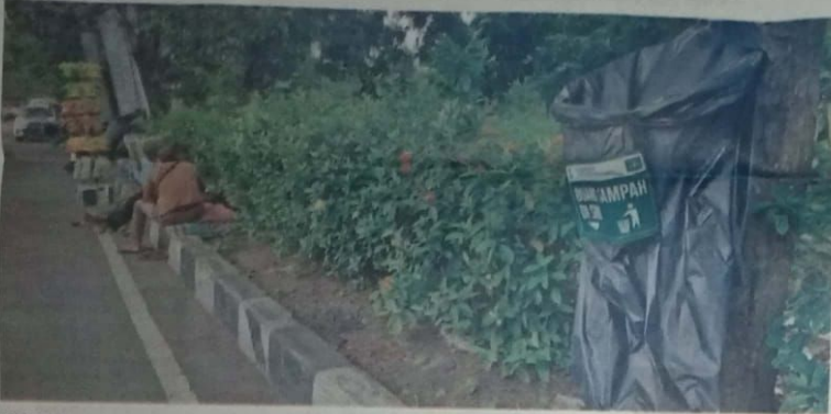
DISEDIAKAN: Kantong sampah yang disiapkan DLHK agar jamaah tidak membuang sampah sembarangan.

KOTA-Jutaan jamaah NU yang menghadiri acara puncak hari lahir (harlah) NU memadati wilayah GOR dan sekitarnya. Sebagai upaya untuk menjaga kebersihan, Dinas Kebersihan dan Lingkungan Hidup (DLHK) Sidoarjo menyiapkan sejumlah kantong sampah di beberapa titik.