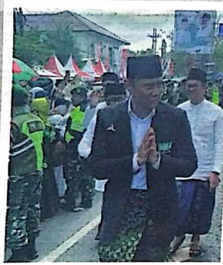
Agus Harimurti Yudhoyono (AHY) menghadiri 1 Abad NU.