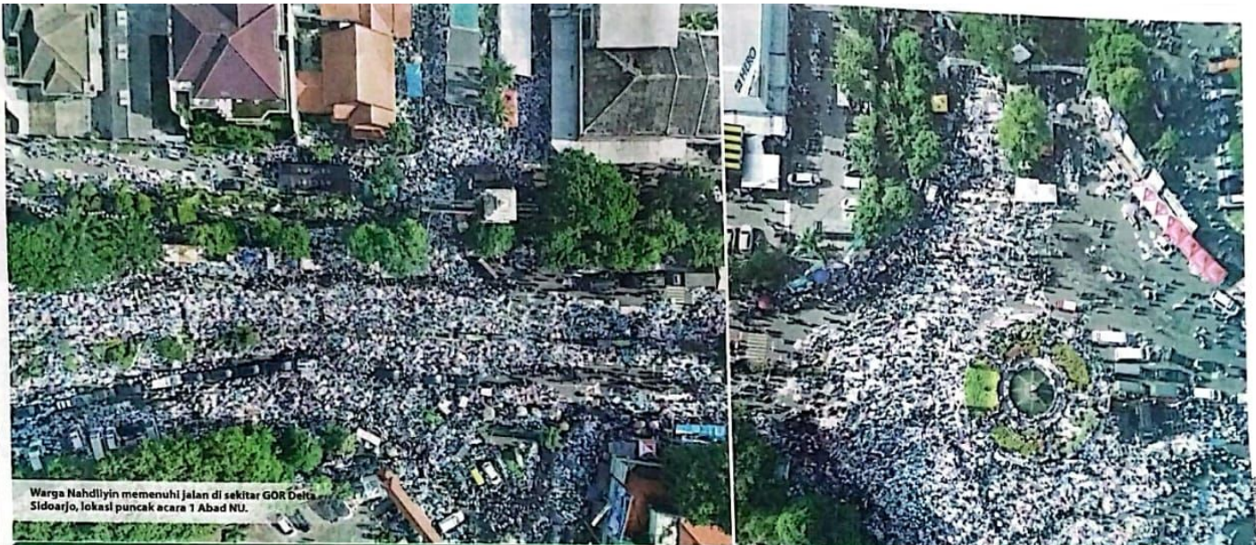
Warga Nahdliyin memenuhi jalan di sekitar GOR Delta Sidoarjo, lokasi puncak acara 1 Abad NU.

DEWAN PERWAKILAN RAKYAT DAERAH KABUPATEN SIDOARJO