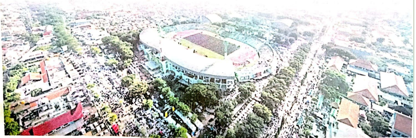
JUTAAN warga nahdliyin saat menghadiri puncak perayaan 1 Abad NU di GOR Sidoarjo, Selasa (7/2/2023). Tampak dari foto udara hampir semua jalan di Kota Sidoarjo dipenuhi jemaah.