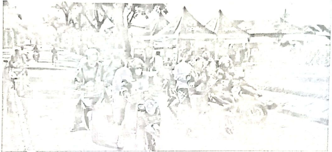
Gojek hadir di festival Nahdlatul Ulama 2023, dengan menghadirkan posko antar bagi para jemaah khususnya lansia dan ibu hamil.