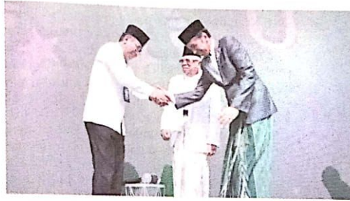
PRESIDEN Joko Widodo dan Wapres KH Ma'ruf Amin dan Ketum PBNU Yahya Cholil Staquf (Gus Yahya) saat harlah 1 Abad NU di GOR Sidoarjo.

Warga Antusias Saksikan Karnaval Satu Abad NU