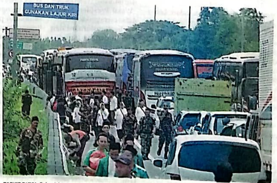
PARKIR DI TOL: Sejumlah orang yang akan menghadiri resepsi Satu Abad NU berjalan kaki dari sebelum pintu keluar gerbang tol Sidoarjo sejauh sekitar 4 kilometer karena bus rombongan hanya bisa sampai rest area tol Sidoarjo.