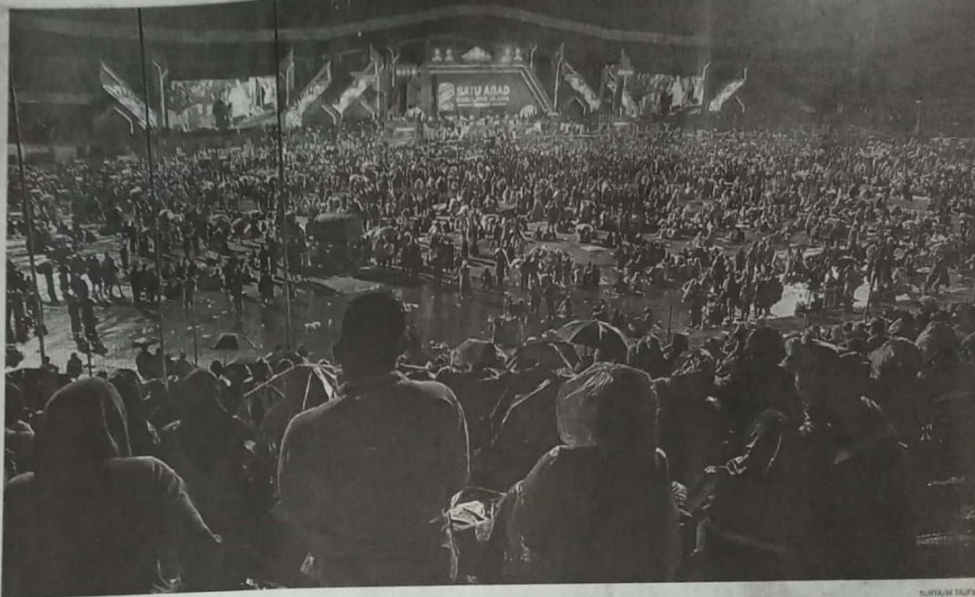
DEMI SLANK - Ribuan warga bertahan di bawah guyrun hujan demi menunggu penampilan grup band Slank di Stadion Gelora Delta Sidoarjo, Selasa (7/2). Penampilan Slank ini merupakan rangkaian kegiatan puncak resepsi peringatan Satu Abad NU.

Pada Selasa dini hari misalnya, acara berlangsung lancar. Baik Lailatul Qiro'ah, Manaqib Syech Abdul Qodir Jaelani, Qiyamul Lail, salat