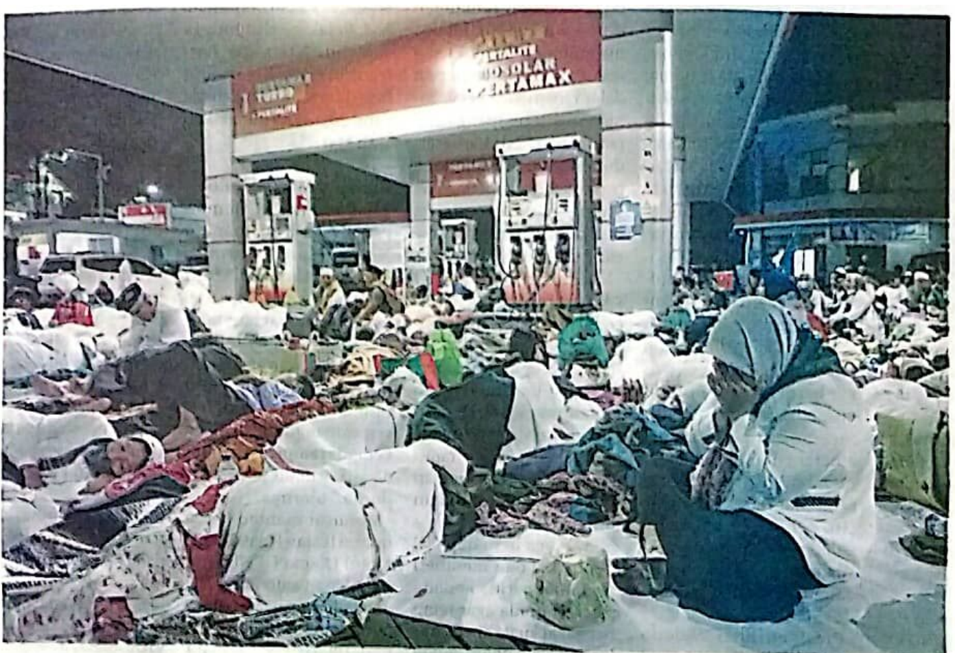
TIDUR DI MANA PUN: Ratusan nahdliyin memanfaatkan pelataran SPBU untuk beristirahat sembari menunggu acara pengajian yang digelar di parkir timur Stadion Gelora Delta, Sidoarjo, saat puncak resepsi Satu Abad Nahdlatul Ulama kemarin (7/2).