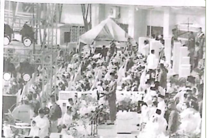
MEMBLUDAK Ribuan jemaah dari berbagai daerah di Indonesia berkumpul memadati GOR Delta Sidoarjo. Mereka mengenakan pakaian dengan dominasi warna putih.