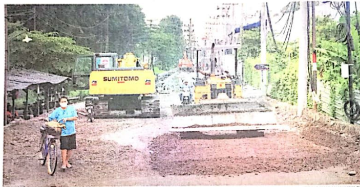
BULAN DEPAN BISA DILEWATI: Pekerja mengoperasikan alat berat untuk menyelesaikan pembangunan frontage road di kawasan Sruni, Kecamatan Gedangan, kemarin (7/2).

Penuntasan pembangunan jalan dengan pengaspalan bakal dilakukan tanpa menutup Jalan Manggis. Pengaspalan bisa dilakukan saat malam saat lalu lintas sepi. Meskipun sudah dibuka, area sekitar