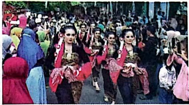
KHAS JAWA: Sejumlah seniman Tarian Gambyong saat menjadi peserta Karnaval Budaya Nusantara.