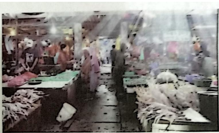
MULAI NAIK: Beberapa pedagang yang menjual sembako di Pasar Larangan, Sidoarjo.