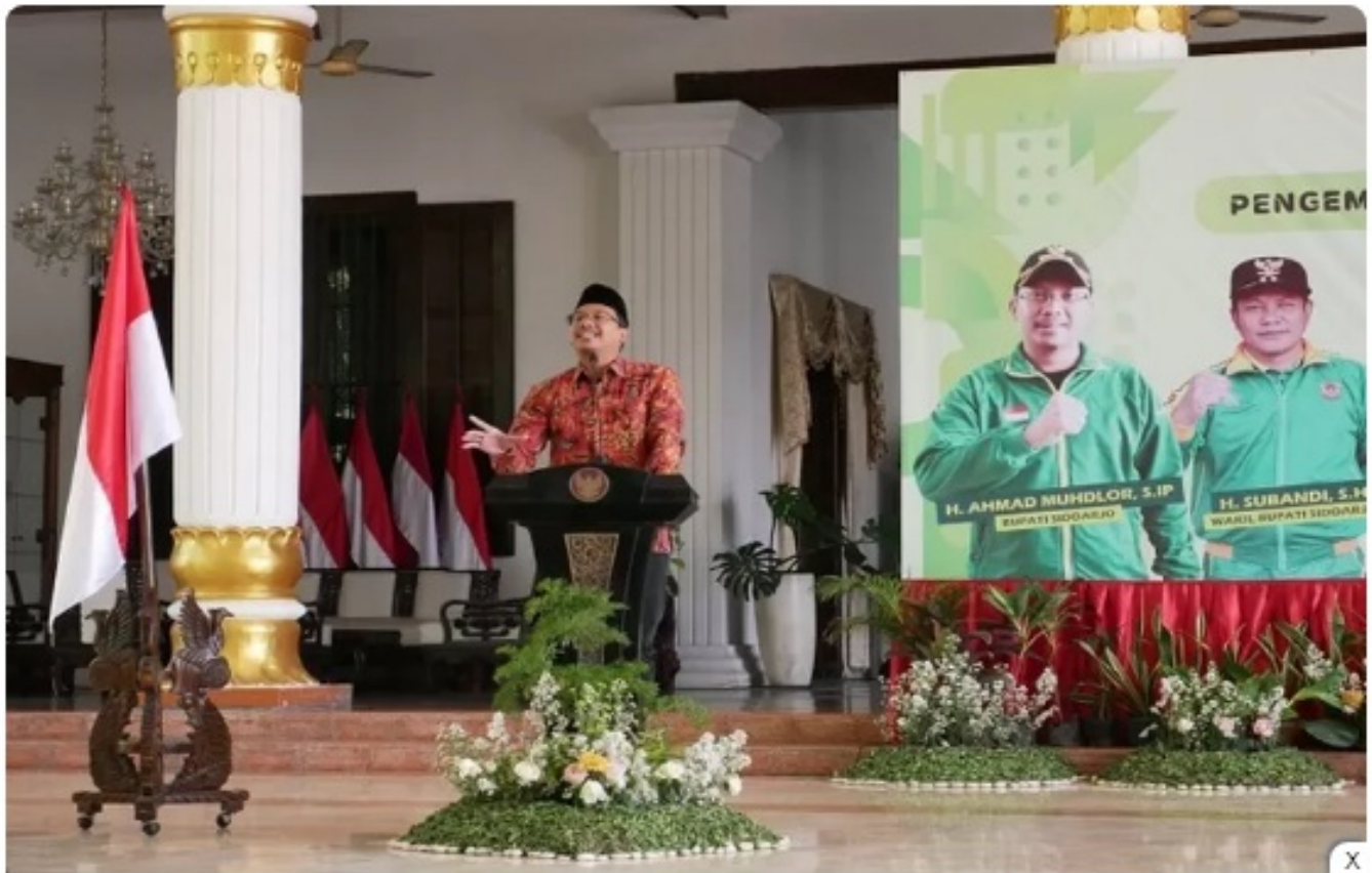
Bupati Sidoarjo Ahmad Muhdlor Ali