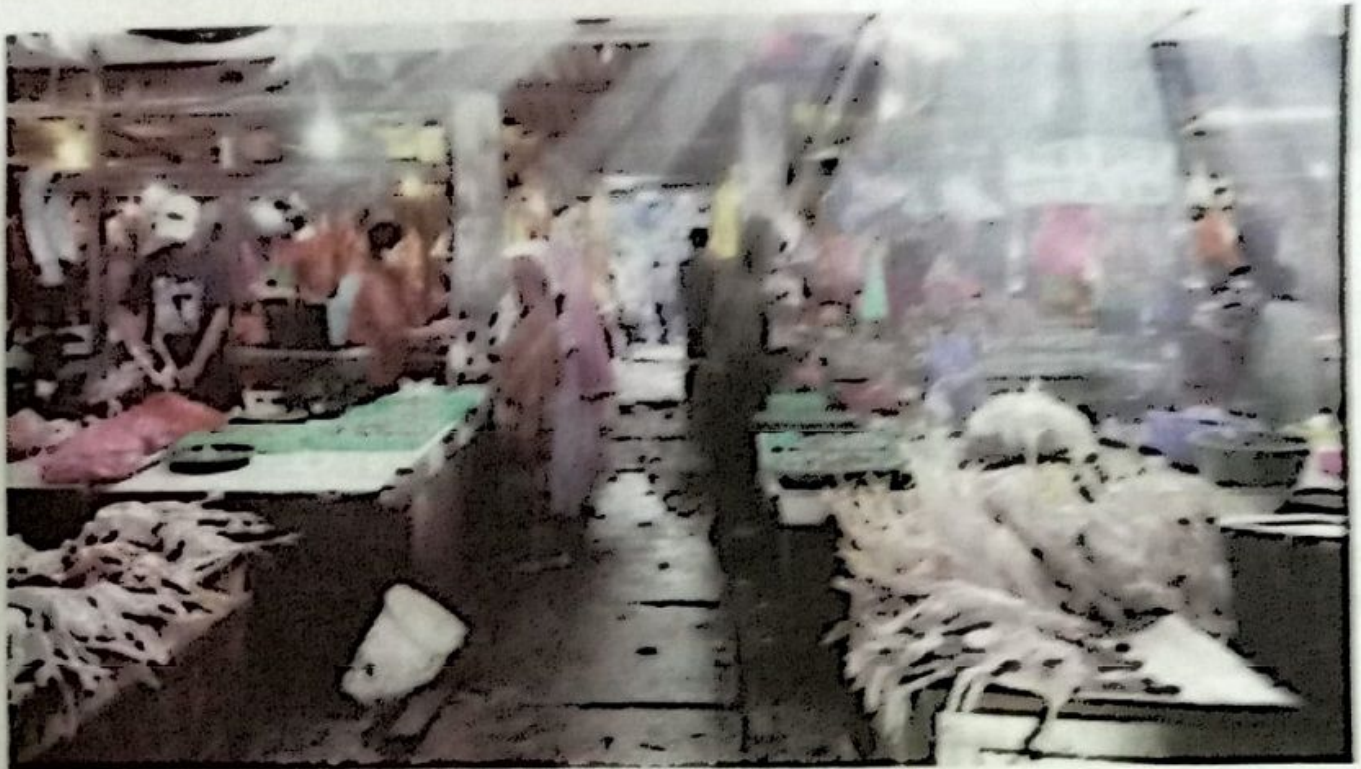
MULAI NAIK: Beberapa pedagang yang menjual sembako di Pasar Larangan Sidoarjo.