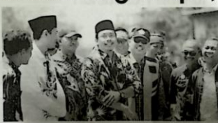
Bupati Sidoarjo Ahmad Muhdlir saat memberikan sambutan di acara penandatanganan MoU...

Sidoarjo, 20 Sept. - Bupati Sidoarjo Ahmad Muhdlir mengatakan bahwa Triwulan II Tahun 2023 mencapai Rp 5,6 triliun atau 77,8 persen dari target Rp 7,1 triliun. Bupati Sidoarjo optimis investasi tahun 2023 dapat menembus target Rp 7,1 triliun.