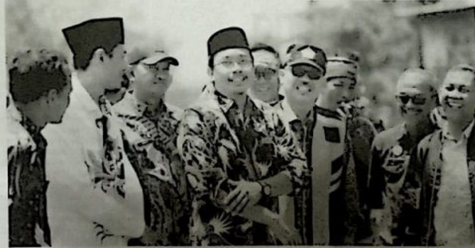
INVESTASI: Bupati Sidoarjo, Ahmad Muhdlor Ali optimis nilai investasi di Sidoarjo naik sesuai dengan target.

"Salah satu faktor yang mempengaruhi perkembangan iklim investasi di Sidoarjo adalah tata kelola yang baik. Diantaranya beberapa inovasi yang kami gagas di dalamnya kemudahan dalam