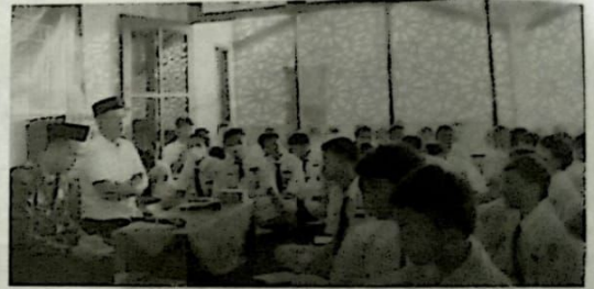
MELEK DEMOKRASI: Sosialisasi yang dilaksanakan KPU di SMPN 2 Buduran beberapa waktu lalu.

Dalam materi sosialisasi, para siswa juga diberikan pemahaman tentang ide dasar dan konsep demokrasi. Bagaimana demokrasi di Indonesia dijalankan, serta cara menilai baik dan buruknya demokrasi dan pemilu