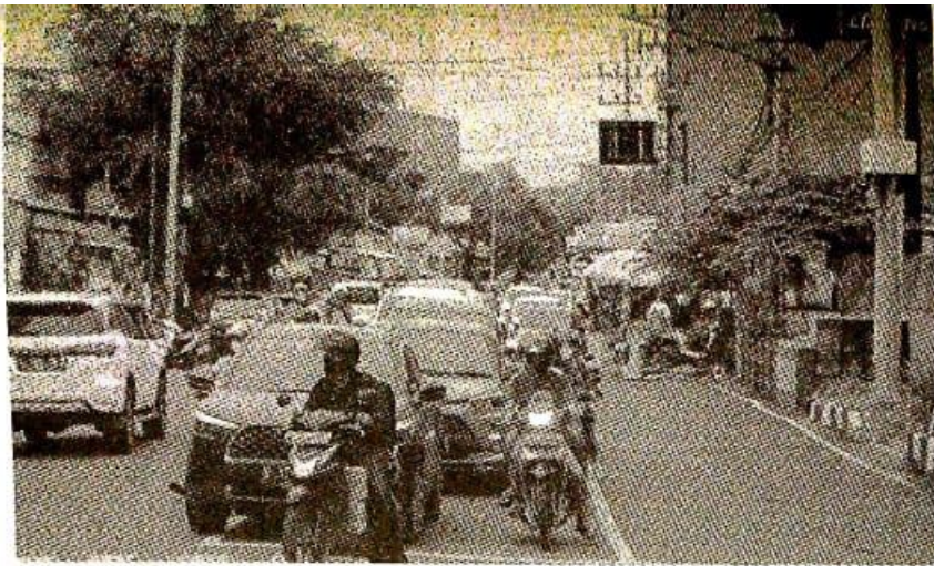
Pelanggaran marka di Sidoarjo. Ilustrasi