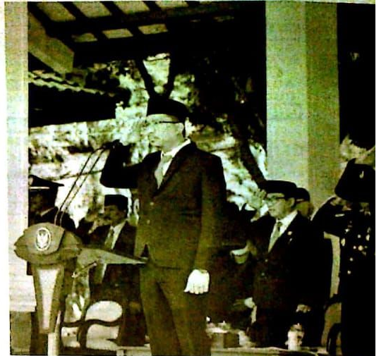
Bupati Ahmad Muhdlor saat memimpin upacara bendera memperingati Hari Pahlawan ke-77 di Alun-Alun Sidoarjo.

Usai upacara bendera, Bupati Muhdlor dan forkopimda melakukan ziarah ke TMP Sidoarjo. Ziarah ke makam para pahlawan yang di antaranya pejuang kemerdekaan ini juga diikuti sejumlah veteran yang tergabung dalam Legiun Veteran Republik Indonesia (LVRI) Kabupaten Sidoarjo. (ADV/sta/rdr)