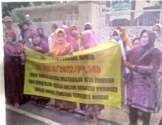
KECEWA: Sejumlah emak-emak saat menggelar demo di depan PN Sidoarjo.

KOTA-Puluhan emak-emak korban dugaan penipuan tanah kavling menggelar demo di depan Pengadilan Negeri (PN) Sidoarjo, Selasa (31/1). Mereka mengaku kecewa usai sidang perkara tersebut harus ditunda untuk kedua kalinya.