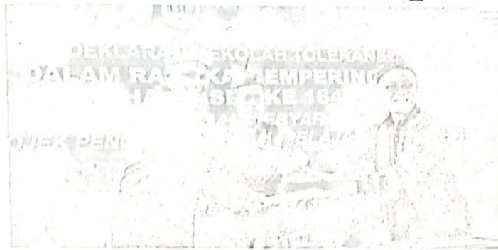
Deklarasi Sekolah Toleransi di SMPN 1 Gedangan.

di negara agama sudah ketinggalan zaman. Founding Fathers Republik Indonesia sudah berdialog keras dengan tokoh lintas agama, dan berbagai golongan untuk membantu NKRI. Bahwasanya berbeda itu bukan sesuatu yang membuat pecah belah, tapi untuk membangun keharmonisan sebagai sesama bangsa dan se-tanah air.