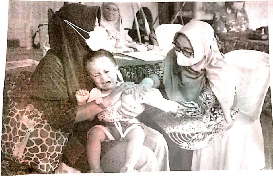
ALFIN: Seorang balita saat menerima suntikan vaksin agar semakin sehat.

KOTA-Dinas Kesehatan Sidoarjo mengevaluasi pelaksanaan imunisasi pada saat Bulan Imunisasi Anak Nasional (BIAN) pada tahun lalu. Hasilnya cukup memuaskan. Realisasinya melebihi target, yakni mencapai 105 persen.