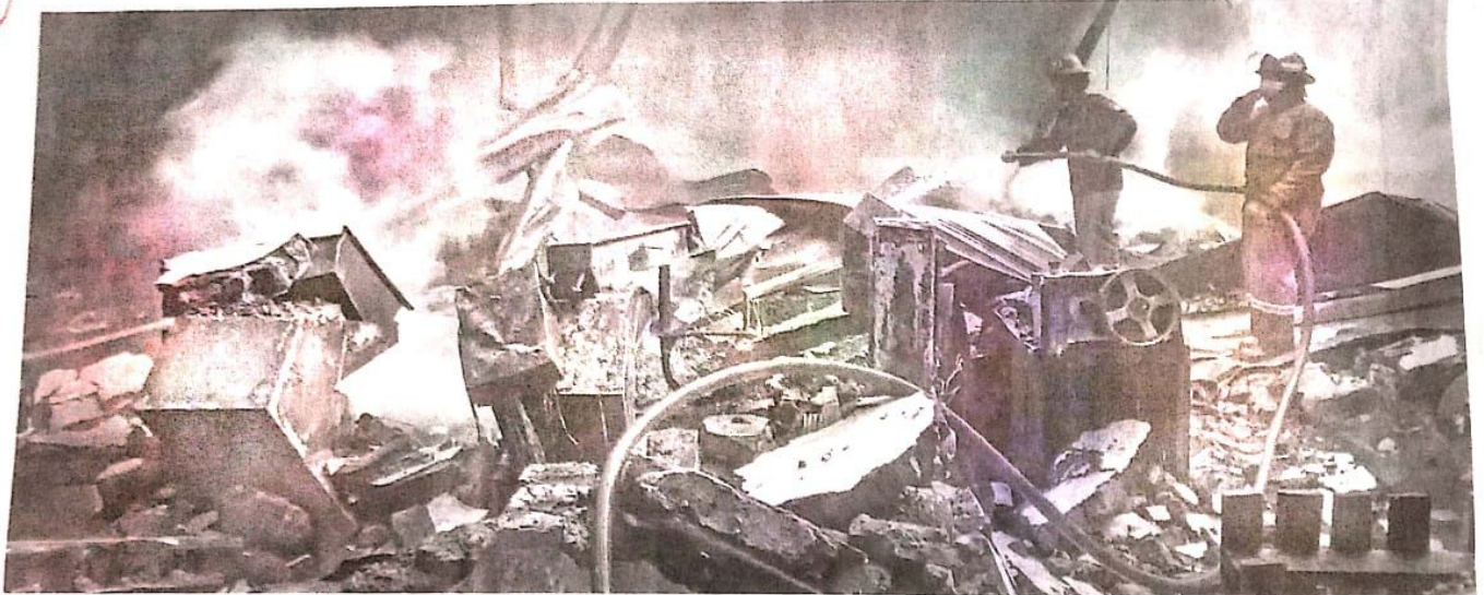
LUDES: Tim pemadam kebakaran Sidoarjo melakukan pembasahan di beberapa area titik potensi api.