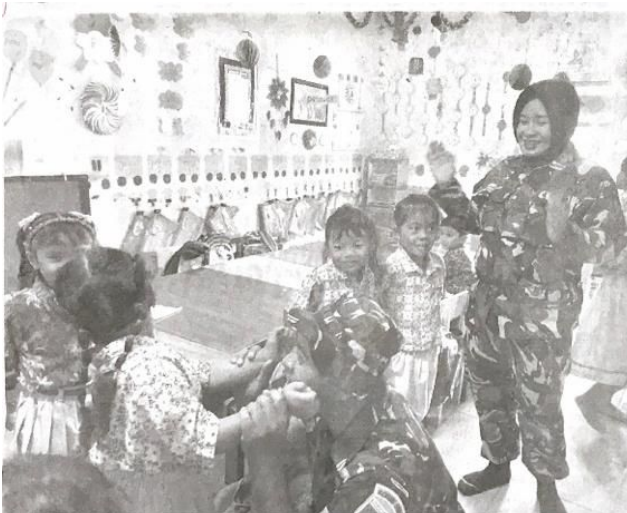
Personel Satgas TMMMD ke-120 Kodim 0816/Sidoarjo berkomunikasi akrab dengan murid TK Penambangan.