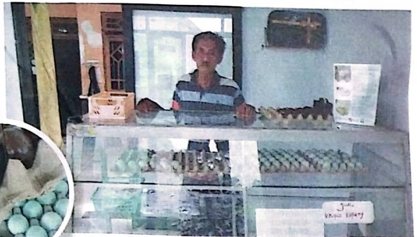
HASIL PRODUKSI: Telur asin yang berasal dari Kampoeng Bebek, Desa Kebonsari, Kecamatan Candi.

dengan pengolahan yang berbeda-beda. Seperti dengan cara diasap,