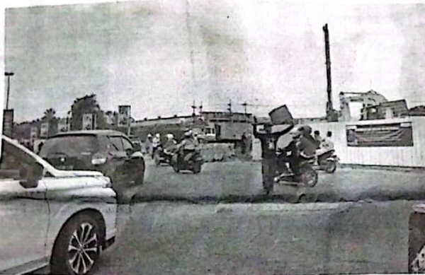
KEBUT PEKERJAAN: Pemasangan pondasi untuk fly over Aloha hingga saat ini masih berlangsung.

KOTA-Pembangunan flyover di kawasan Aloha sudah dimulai sejak 18 Januari lalu. Pekerjaan dimulai dengan pemasangan paku bumi yang dilanjutkan dengan pembangunan pondasi. Diperkirakan akhir bulan ini pondasi sudah bisa berdiri.