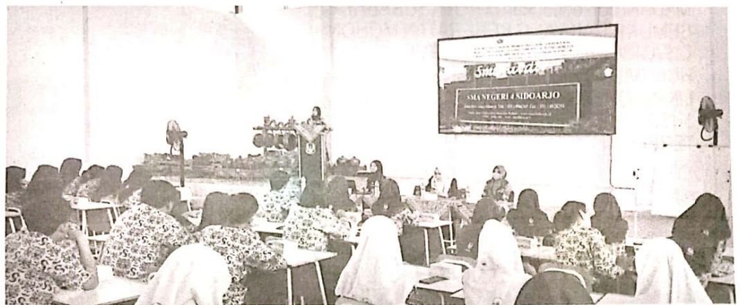
Kepala Dinas Tenaga Kerja Sidoarjo sedang memberikan pengarahan kepada para siswa.