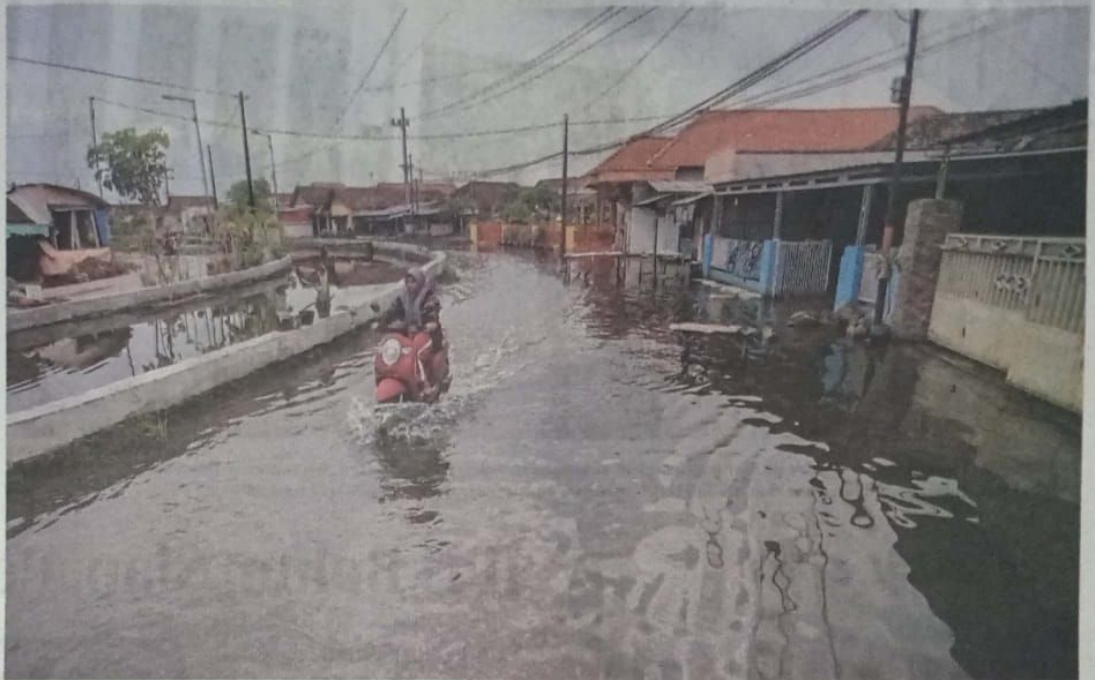
TIAP TAHUN BANJIR: Air yang merendam Desa Kedungbanteng, Kecamatan Tanggulangin, mulai surut kemarin (2/2). Pemkab Sidoarjo menetapkan status tanggap darurat banjir di tiga desa, Kecamatan Tanggulangin, yakni Desa Kedungbanteng, Banjarasri, dan Banjarpanji.

Dia belum bisa memastikan apakah kondisi tanah semakin turun. Menurut dia, dibutuhkan analisis lebih lanjut. "Ini saya belum dapat informasi