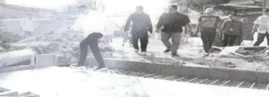
SIDAK Plt Bupati Sidoarjo Subandi saat melihat langsung proses pembangunan jalan dan jembatan di Desa Banjarsari, Kecamatan Buduran, Sidoarjo.