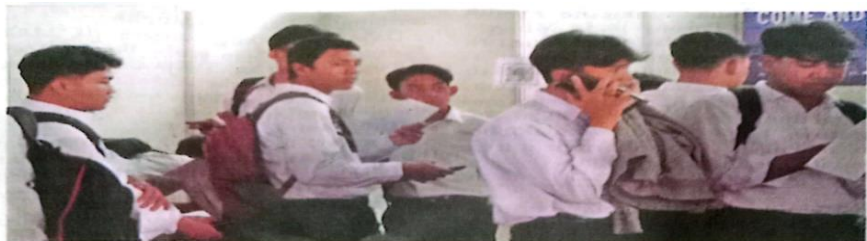
MINAT KERJA: Suasana pelaksanaan job matching di SMK Krian 2 Sidoarjo.