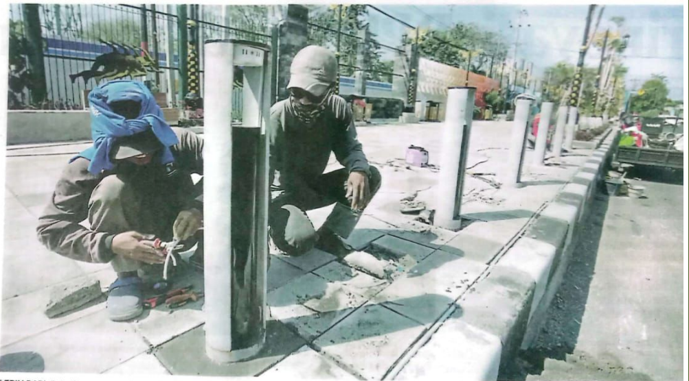
LEBIH RAPI: Pekerja memasang instalasi lampu trotoar di GOR Delta Sidoarjo kemarin.

Dia menyebut tidak ada kendala dalam proses pemeliharaan tersebut. "Target kami pertengahan Agustus ini sudah selesai semuanya," pungkasnya. (uzi/c7/any)